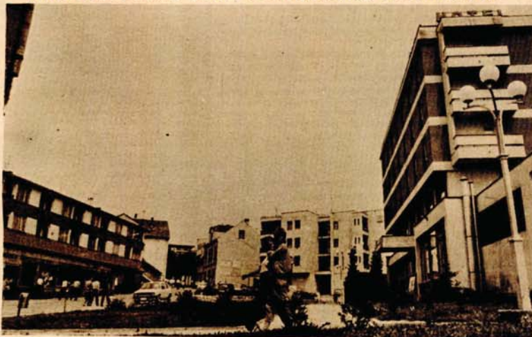
Prnjavor: novi industrijski objekti omogućavaju zapošljavanje mladih radnika

PRNJAVOR DANAS SLAVI 43-GODIŠNJICU OSLOBOĐENJA