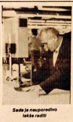
Sada je neuporedivo lakše raditi

Prnjavorški konfeksionari se iskreno nadaju i ulažu maksimum napora kako bi zadovoljili zahtjeve probirljivog svjetskog tržišta. Uskoro će se znati i prvi rezultati, ali treba vjerovati da će se nadanja obistinili i da će „Pionir“ brzo ući u red poznatih konfeksionara - izvoznika.