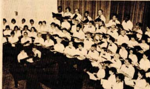
Neposredni i uvježbani — "Nju England Kora" na banjalučkoj sceni

Mažar", a našao je na izuzetan prijem riječke publike. Pored folklornih programa održavaju se muzičke priredbe aformisanih ansambala, orkestrara i solista iz SAD.