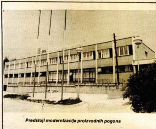
Predstoji modernizacija proizvodnih pogona

Cinjenica je da ni „Metalke“ ne ide sve „kao po loju“, ali i u najtežim trenucima ovaj kolektiv je znao da nadprvariješnja i da „ispliva iz krize“. Naročite, krize za sada, nema, ali ovdje gledaju i