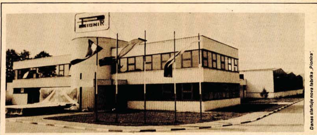
Danas startuje nova fabrika „Pionira“

U startu, od danas, u novim, savremenim proizvodnim pogonima, za novim mašinama „singer“ i „pal“ naci će se