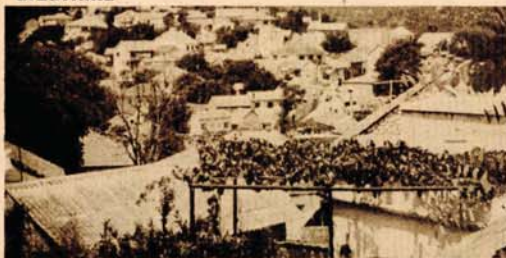
Gabela: Ako prava Troja nije u Maloj Aziji, da li je bila u blizini Capljine?

Antički Heleni falsifikovali „Iljadu“, a izgradnja „Troje“ u Maloj Aziji bila dio političke i religiozne zavjere starogrčkih sveštenika, filozofa i državnika