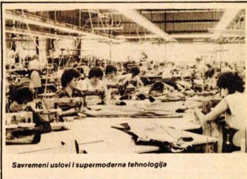
Savremeni uslovi i supermoderna tehnologija

Sam podatak da je „Novoteksa“ prihvatilo da u ovu veliku konfekcijsku kuću ude i