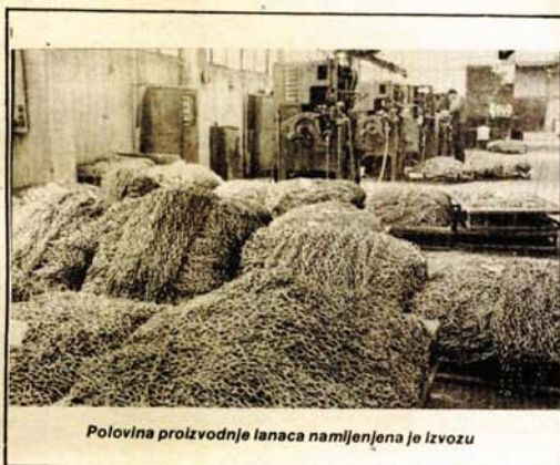
Polovina proizvodnje lanaca namijenjena je izvozu

građevinskih armatura i on dobro posluje. U jednoj smjeni se proizvode šest tona građevinskih armatura različitih dimenzija i profila. Radi se u dvije smjene, a ovdje priželjkuju da