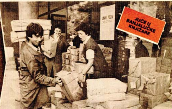
U knjižari „Svjetlost“: Prodavači žure da što prije raspakuju pakete

Slična je situacija i u drugim knjižarama, a rukovodilac prodavnice „Veselin Kozela“ Miro Ratković kaže da je cijena udžbenika ove godine za 50 do 40 odsto veća od prošlogodišnje. Iznosi i poštiku za naredne godine. Iznosi i poštiku za naredne godine. Iznosi i poštiku za naredne godine. Iznosi i poštiku za naredne godine.