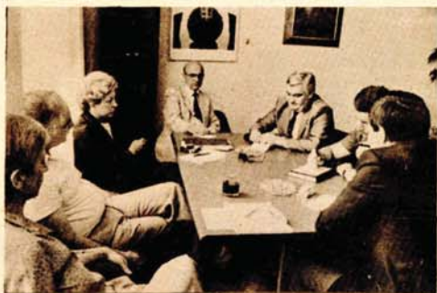
Razgovor u „Glasu“: Težiti ka informisanju iz baze

jačanje, kako u listu, tako i u cjelovitoj radnoj organizaciji.