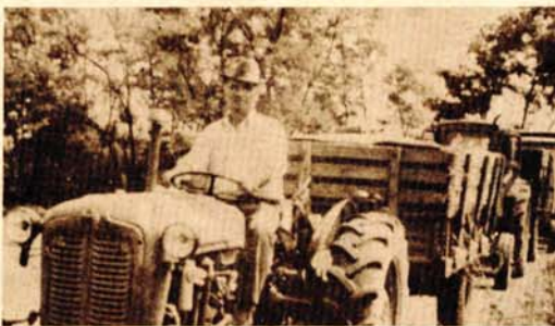
Prijem ovogodišnjeg roda pšenice u silosu „Napretka“ u Krnjevu