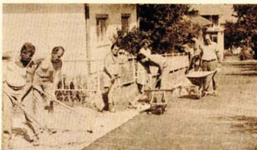
ZAVRŠNI RADOVI: Građani uređuju bankine, propuste i kanale

● Višegodišnji problem stanovnika ove dvije ulice, koji je posebno izražen u proljeće i jesen, kad padaju kiše, riješen je vlastitim radom i novčanim ulaganjem ● U pomoć je priskoćilo IZ za uređenje građevinskog zemljišta koji je uložio polovinu sredstava