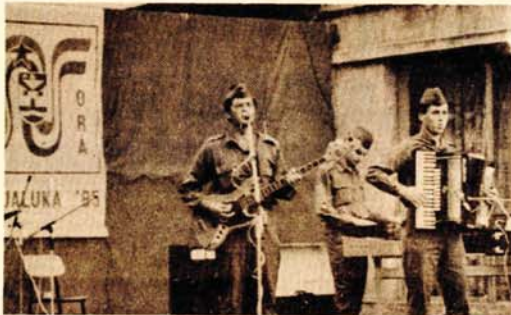
U kulturno—zabavnom dijelu programa brigadiste i njihove goste, između ostalih, zabavljao je i orkestar kasarne Kozara

„Banjaluka 85” u toku jula i avgusta učestvovalaće šest stotina mladih iz 12 gradova Jugoslavije i jedna brigada djece naših