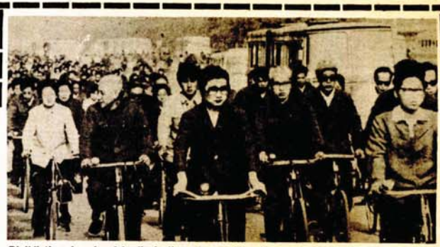
Biciklisti, nekrunisani kraljevi ulice glavnog kineskog grada

Posebno poglavlje u zapisu o egzotici svakodnevnog života je gradski prevoz u Bejđinu. Sami gradski oči su izračunali da je prosječna brzina ovog vida prevoza 5 km na sat.