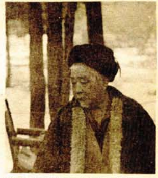
Ulični prodavac u Bejđinu (Pekingu)

Najsvojeljnija tačka gradskog prevoza u Bejđinu je metro. Daskora je postojala samo jedna linija koja se pružala južnim dijelom grada.