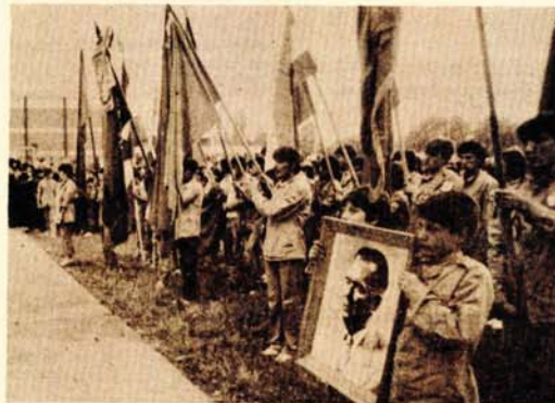
Nakon svečanog defilea, izvršena je smotra omladinskih radnih brigada

je na sinošnjem otvaranju, pamtili brigadirsku pjesmu proljeća 1970. godine. Djevojke i mladići iz cijele zemlje došli