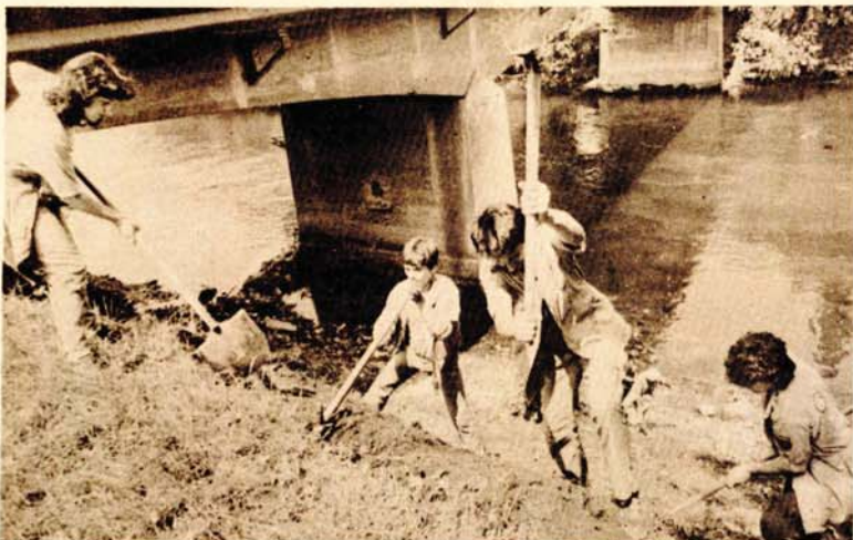
Juče na trasi: Novosađani već dobili pohvale

● Akcijaši SORA „Banjaluka 85“ nisu čekali svečanost, već taj zvanični početak dočekali radom ispunivši sve svoje zadatke ● Uređenje obala Vrbasa — prvi zadatak