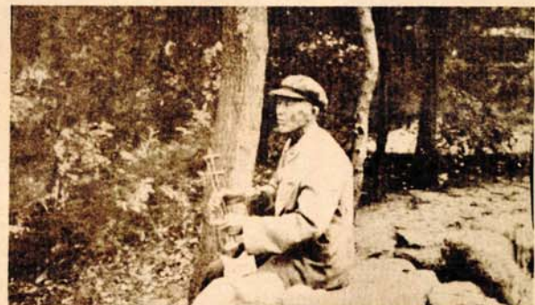
Svakodnevna zabava — sviranje na tradicionalnom žičanom instrumentu ermu u Kini

Analizirajući apsurdnu tezu o potrebi nastavljanja revolucije i zaoštavanju klasne borbe i pri već ostvarenoj diktaturi proletarijata, koja inače vuče korijene iz Staljinove ideološke radionice, časopis HONG DI implicitno govori o paronoji vremena „kulturne revolucije“ i njejoj opsjednutosti neprijateljima. Iz analize se može naslutiti ono što se van Kine već odavno zna — da je „kulturna revolucija“ bila prilično žestoka borba za vlast. Ponašajući tezu da je „kulturna revolucija“ odstupanje od marksizma, istorijski regres i greška u teoriji i praksi, KP Kine u prvi plan stavlja i naročito kritiku stav „kulturne revolucije“ da se svi problemi mogu riješiti političkim putem. Pravi put je, smatra vrh kineske komunističke partije, ekonomska reforma. To je žična tačka da-