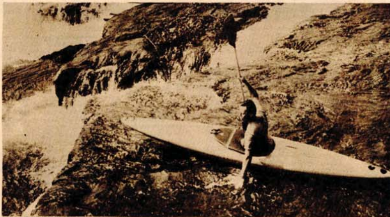
Samo najhrabriji su savladivali brzake i bukove Une

BOŠANSKI NOVI, 15. jula - Sinoćnjom, završnom priredbom i podjelom znamenja završena je ovogodišnja, dvadeset prva Unska regata. Minulih pet dana 128 kajakaša iz Italije, SR Njemačke, i Holandije, zatim iz jugoslovenskih klubova iz Novog Mesta, Ljubljane, Zagreba, Beograda, Sarajeva, Mostara, Kostajnice, Bihaća, Krškog i Bosanskog Novog, družili su se i uživali u svim izdašnostima prirodne ljepote Une i njenih obala. Ali, nažalost, nisu se družili i sa brojnijim ljubiteljima ove rijeke, kako iz zemlje, tako i iz inostranstva po čemu, očito, ni ovog puta ova sportsko-rekreativna, turistička i kulturno-zabavna manifestacija, nije u potpunosti ostvarila osnovnu svoju namjeru. Istina, bilo je mnoštvo ljudi na priredbama, startovima i ciljevima etapa regate od Martin Broda, preko Lapca, Ri-