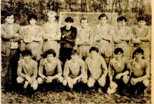
Fudbaleri Zupe iz Kriškovaca

Nakon jednogodišnje seobe u Opštinsku ligu Zupa se vraća u Grupnu ligu „Ljevče“ • Rijedak bilans: bez poraza uz samo jednu neriješenu igru, bez žutog i crvenog kartona