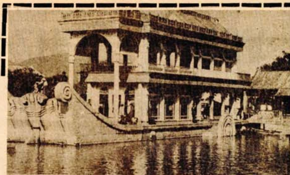
Kameni brod u ljetnoj palati kineskih careva u Bejdingu (Peking)

Kampanji se pridružio i teorijski časopis KP Kine HONG DI (CRVENA ZASTAVA). U septembru prošle godine su objavljeni podaci da je u toku „Kulturne revolucije“ sto miliona ljudi stradalo na neki način i da ekonomski mjerljivi gubici ovog perioda iznose oko 200 milijardi dolara. Karakteristična je bila i rečenica da je „kulturnu revoluciju“ pogrešno pokrenuo jedan rukovodilac i da su to iskoristili kontrarevolucionari. Očigledno je bilo da se misli na Mao Zedunga. Ako se tome doda da je krajem prošle godine u Bejdingu objavljen i podatak o deset miliona umrlih za vrijeme politike VELIKOG SKOKA (1957. — 1961) onda je jasno da su pozitivni aspekti Maovog djelovanja gurnuti dosta daleko u prošlost i da se njihov kraj otprilike poklapa sa krajem kineske oružane revolucije.