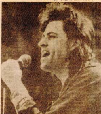
Bob Geldof, inicijator i organizator grandioznog rok-koncerta