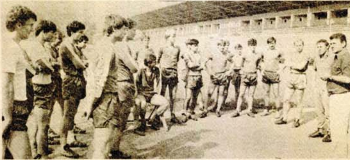
Sa jučerašnjeg prvog sastanka fudbalera Borca