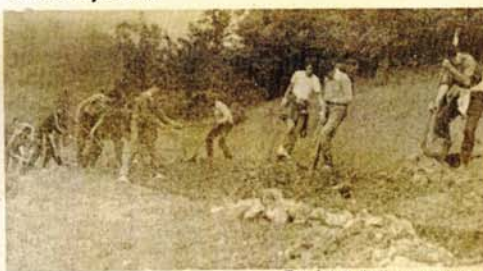
Završetak akcije u dolini Ugra

Tokom desetodnevne akcije na prvoj fazi izgradnje spomen-obilježja u kanjonu Ugra radila 493 borca, izdavača i mještana