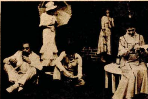
Nagrađivanje prema rezultatima: sa scjene Narodnog pozorišta Bosanske krajine

● Raspodjela sredstava je izvršena. Svi nisu zadovoljni, ali će morati da se naviknu na novi kriterij raspodjele - biće nagrađivani prema radu i rezultatima rada