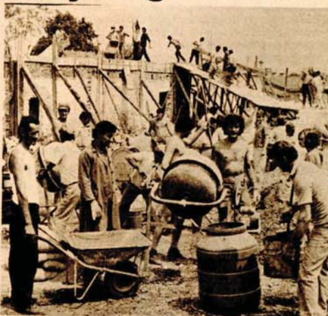
Za Krškovicima vrela julska nedjelja bila je udarnički dan: na akciji se okupilo 110 stanovnika