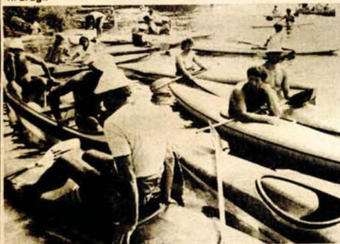
Na kraju puta u Bosanskom Novom, trenutak za odmor - uoči slavlja završnice regate