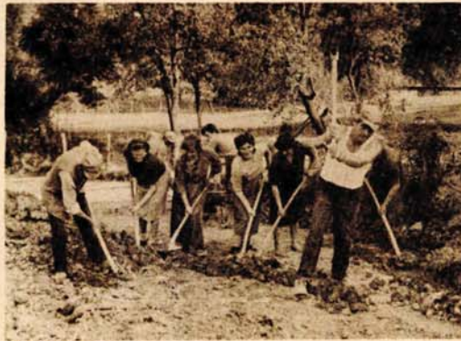
Od 16 do 22 sata svi su na gradilištu

Stanovnici ovog područja i stručna ekipa „Vodovoda i kanalizacije“ započeli su u četvrtak, 4. jula, sa kopanjem kanala, a sedam dana poslije toga bilo je već postavljeno dvije trećine cijevi. Rezultat je to poštovanja i građana i radnika „Vodovoda“, koji često ostaju i do 22 sata na gradilištu. Najviše je u posljednjim satima kada su skoro svi sa alatom u rukama nau-