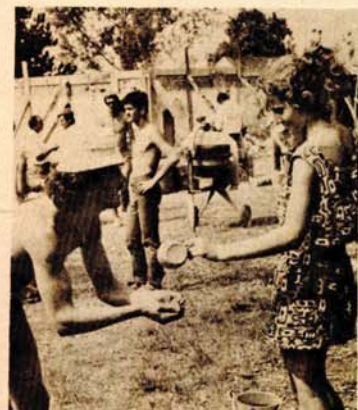
Za osvježanje akcijaša brinule se omladina i pioniri