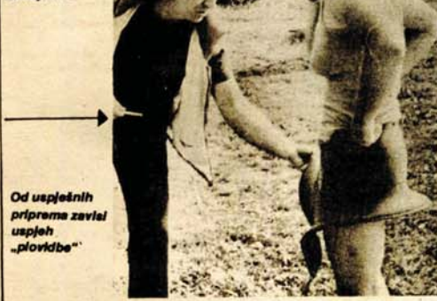
Od uspješnih priprema zavila uspjeh „plovitbe“