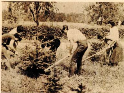
Omladinke su brinule o zelenilu