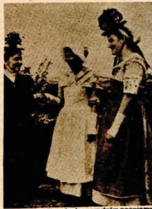
Plesačice u živopisnim narodnim nošnjama

● Članovi folklornog ansambla iz francuskog grada Turnu gostuju na poziv CKUD „Veselin Masleša“