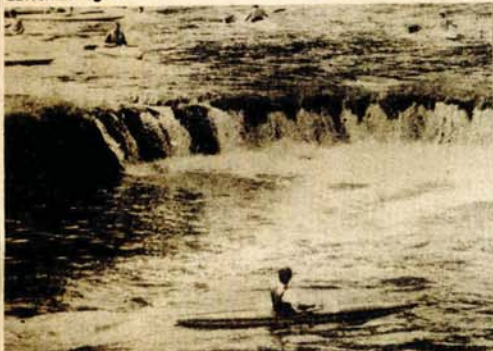
Bukovi kod Otoka - još jedno iskušenje za kajakaše