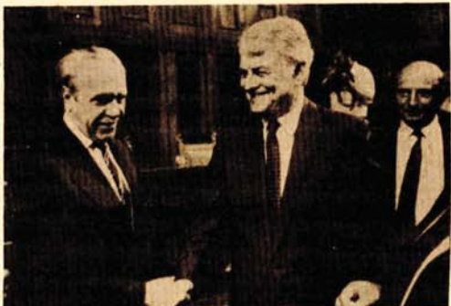
Predsjednik Skupštine Ilija Kurtić čestita Vidoju Žarkoviću

● Predsjednik Predsjedništva CK SKJ Vidoje Žarković proglašen za člana Predsjedništva SFRJ po funkciji ● Neophodno je ispuniti sve uslove da bi se u narednom srednjoročju društveni proizvod povećavao za četiri, a izvoz za 5,7 odsto godišnje