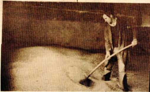
„Lopatanje“ - sušenje vlažne pšenice u otkupnim magazinima

Međutim, podaci kojim raspolaže „Žitokrajina“, i Regionalni koordinacioni odbor za praćenje radova u polju nisu usaglašeni. Prema podacima Regionalnog odbora do današnjeg dana otkupljeno je oko 15.000 tona žitarica, ali velike količine se nalaze u otkupnim magazinima na sušenju. U silose se prihvata pšenica sa 15 odsto vlage, a vlažnija pšenica se mora sušiti, što za dva dinara po kilogramu opterećuje proizvodnju cijene pšenice. Da bi se izbjegli ovi troškovi, osnovne zadruže organ-