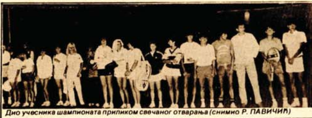
Дно учесника шампионата приликом свечаног отварања