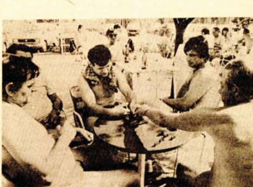
Poslije kupanja, pariija domina, da vrijeme brže prođe