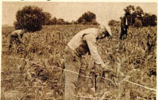
Za mladi kukuruz ima vremena da se oporavi