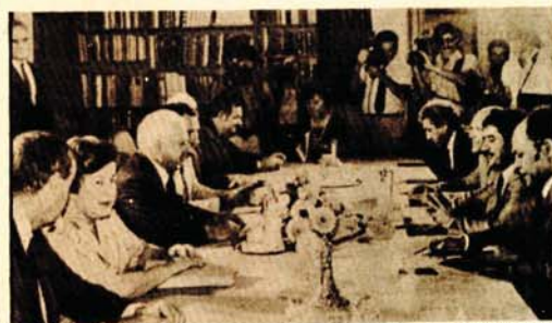
Priljet kod R. Vlačkovića

● Gosta iz Socijalističke Narodne Libijske Arapske Džamahirije primio i predsjednik Predsjedništva SFRJ Radovan Vlačković