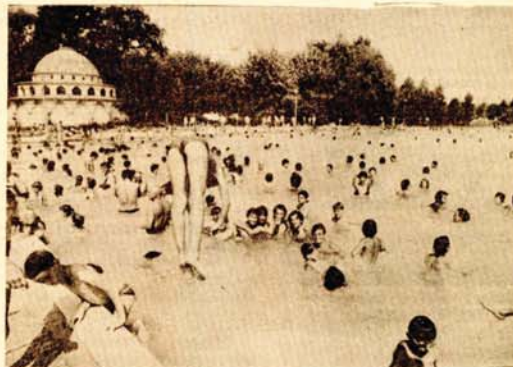
Na visokim temperaturama - najprijatnije je u bazenu