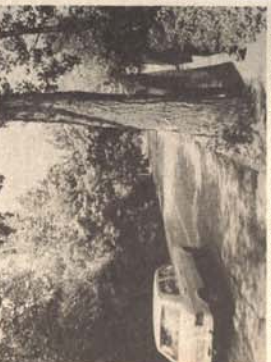
Na čitavim od samo dvije širine radnici iz "Standards" ovih dana u Banjaluci i u drugim gradovima rade na uskim trotoarima. Često su prisiljeni ići na cestu.

Na drugim mjestima u Omladinskoj ulici, u toku ovogodišnjeg programa izgradnje, radnici su prisiljeni ići na cestu. Često su prisiljeni ići na cestu. Često su prisiljeni ići na cestu.