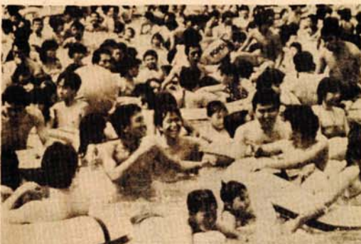
TOKIO, 22. jula — Velike vrućine vladaju i u Japanu, a Japanci — poznato je — imaju vrlo kratak godišnji odmor, parijetko odlaze izvan mjesta boravka. Stoga u točista traže u bazenima, nedaleko od svojih kuća. Međutim, za sve uvijek nema dovoljno mjesta. To potvrđuje i snimak načinjen ovih dana u jednom tokijskom bazenu, u koji je od ljetnih žega pobijeglo oko 30 hiljada žitelja glavnog japanskog grada. A to je, kao što se dobro vidi na fotografiji, zaista mnogo.