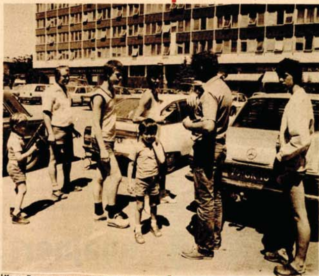
Хољанђани се све чешће заувлашљају, задовољни су и смјештајем и храном, али шта вриједи кад нема забаве и других садржаја