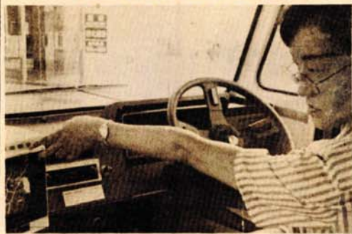
Ne ekranu ugrađenom u kola na mapi grada vidi se lista kupaca sa adresama i spisak naručene robe

TSUKUBA, 23. jula - U japanskoj naučnoj meki, gradu Tsukubi, poznatom po najvećoj svjetskoj izložbi naučnih dostignuća "Ekspo 85", koja je u toku i traje do kraja septembra, gotovo svakodnevno, van sajamskih hala, prikaze se neko novo tehničko dostignuće. Ovih dana posjetioci i menadžeri mogli su vidjeti kompjuterizovani catering - dostavu tražene robe na adresu potrošača, koji odnedavno koristi velika robna kuća Seibu.