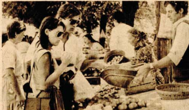
S banjalučke pijace: paznim danom dobra ponuda obara cijene povrća i voća

BANJALUKA, 23. jula — Sezona je godišnjih odmora, iz turističke privrede stižu dobre vijesti, sezona je žetve i s polja svakodnevno javljaju da su dobri prinosi, a sve to vidljivo je na zelenim pijacama. U Banjaluci danas na pazarni dan bila je dobra ponuda, a to se odmah vidi po cijenama koje su niže za koju desetinu dinara. Krompir je danas bio 40 dinara, paradajz po izboru 50 do 70, paprike 80 do 120 kupus 60, grašak u mahuni 100, luk crni 40 do 60, a od voća jabuke ranih sorti 80 do 100, lubenice 70, dinje 150, breskve 80 do 100, šljive 100 dinara kilogram.