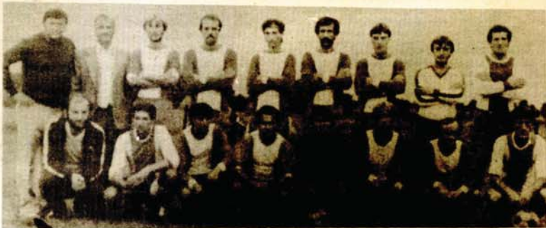
Fudbaleri Jedinstva iz Mjesne zajednice Žeravica

● Prvo mjesto proslavljeno od srca ● Cilj — opstanak u Ligi ● Stvarali bolje uslove za rad