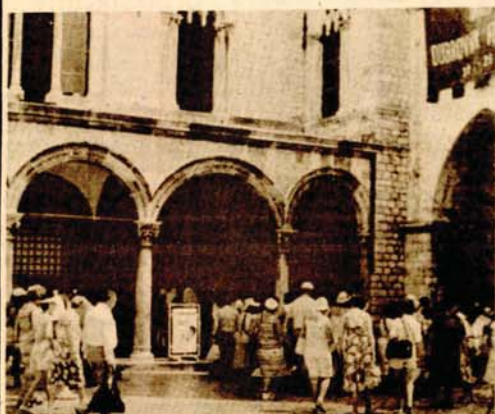
Uz goste na Stradunu i maskota univerziteta

● Po mišljenju uglednog dirigenta Antona Nanuta danas je Vladimir Krajnjević, sovjetski klavirist, jedan od najboljih interpretatora Šumanove muzike