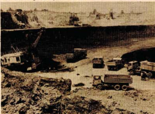
Novi kopovi na vidiku: detalji iz „Omarške“

narednog septembra i da će se do kraja godine ovdje proizvesti 400 hiljada tona robne rude. Startom rudnika „na dugme“, u čijem finan-