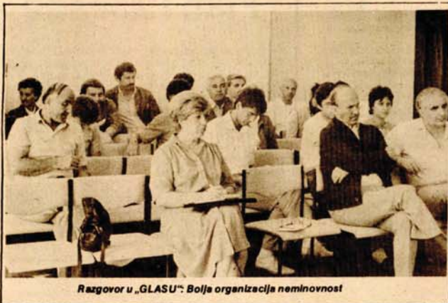
Razgovor u „GLASU“: Bolja organizacija neminovnost