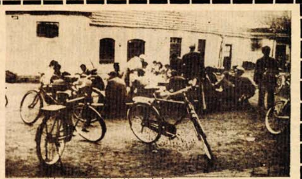
Obrok na ulici - česta slika u kineskim gradovima

Lokalne ličnosti obasipaju strane posjetioce podacima o uloženi miliona američkih dolara ili o tome da se već priprema izgradnja prvog kineskog pravog oblakodera, imaće 88 spratova. Na vrhu će biti rotirajući restoran a na krov će se spuštati helikopteri. Sve dosad nevideno u Kini. Pet finansijskih grupa iz Francuske, Kanade i Monaka uložile u njegovu izgradnju 450 miliona američkih dolara. To je samo jedan od desetina