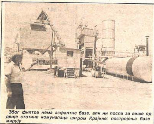
Због филтра нема асфалтне базе, али ни посла за више од двије стотине комуналаца широм Крајине: постројења базе мирују

Радни људи овог колектива су данас на сједници Радничког савјета разматрали могућности набавке филтра и његовог што скорије монтаже. Више појединости са овог састанка, те из којих ће изаора бити обезбјеђена средства, знаће се сутра. Тренутно је овом одлуком директно погођено шест радника који су производили асфалт. Они сада обављају помоћне послове. Индиректно је штета много већа. Јер, до обуставе производње је