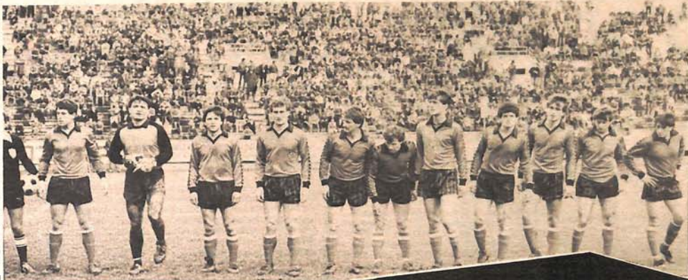
KAD JE U BORCU BILA BURA