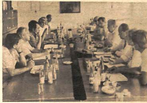
Sa sastanka u „Čajavecu“

izradi elemenata koji su predmet razmjene sa čehoslovačkim i poljskim proizvođačima, doprinijelo je da se polugodište završi sa akumulacijom od oko 80 miliona dinara. Radne organizacije