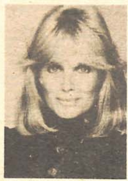
Linda Evans kao Kristi Karlington - zvijezda serije „Dinastija“

● U Holivudu je sada, maltene, panika i stalno iskrsavaju pretpostavke o tome „ko je sljedeći“, jer tamo „svako spava sa svakim“ - piše londonski list „Nju of d vorld“