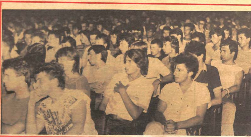
Juče u banjalučkom Domu JNA: svečani ispraćaj mladih regruta

MADA SU KOMBAJNERI ZAVRŠILI POSAO, OTKUP PŠENICE JOŠ U TOKU