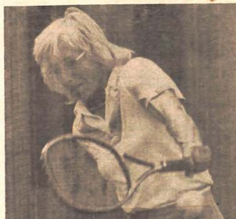
Izbor je pao na kanadskog hokejaša Vejna Gretski, a Navratilova se mora malo dotjerati, jer ovako nije baš ženstvena

izuzetno ženstveno i da nosi dosta skupocjenog nakita, što inače nije njen običaj.