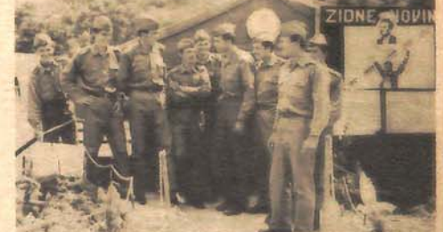
U dobroj organizaciji nema loših uslova života i rada: vojnici - sagovornici ispred logorskog šatora