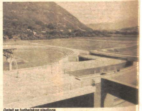
Detalj sa fudbalskog stadiona