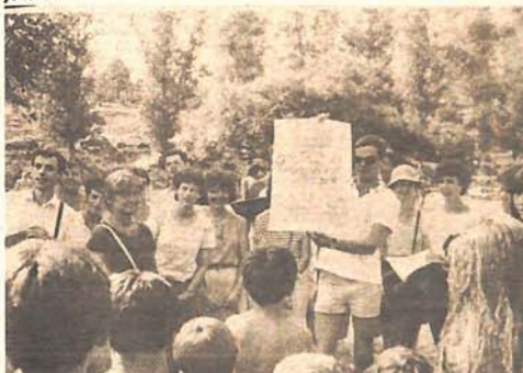
Dva dana hor mladiz iz belgijskog grada Lovajna je pod vedrim nebom i na plus 35 držao koncerte na plažama Plive.