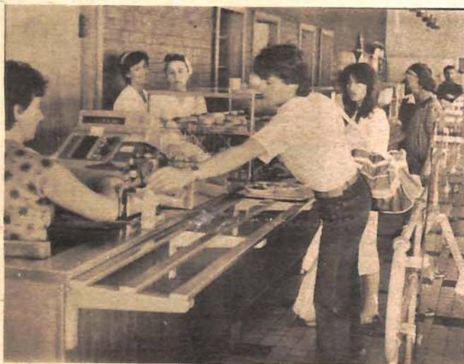
Јуче у експрес-ресторану „Бупевара“: гужве нема

у просјеку за 10 одсто. Тако је цијена пива од 100 динара до 150 динара, сокови од 80 до 100 динара. Кафа се сада продаје по цијени од 60 до 80 динара, а чај од 40 до 50 динара.