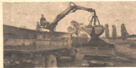
Potrebe iznad mogućnosti

● Potrebe građana su jedno, mogućnosti rudnika drugo ● Nakon 10. avgusta nove uplate