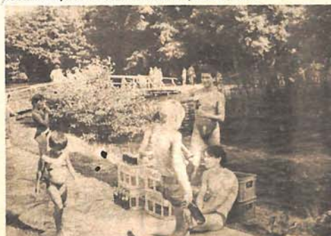
Nekoliko improvizovanih blea: hladno pivo i sokovi za sve one kojima je žega grlo osušila.

hladne vode Plive su svima prijale. Osim građana Jajca na Malom i Velikom jezeru mogli su se vidjeti i gosti iz inostranstva. Tri dana u gradu na dvije rijeke su boravili mladići i djevojke univerzitetskog hora iz Lovajna u Belgiji. Pozivajući Jajčane na koncert u Dom kulture, na plaži Malog jezera su praktično za dva dana održali nekoliko cjelovečernih koncerata. Pojava tamno-