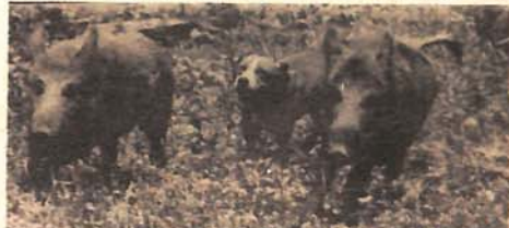
Kada uđu u trag divljim svinjama — lovački psi ne odustaju od plijena