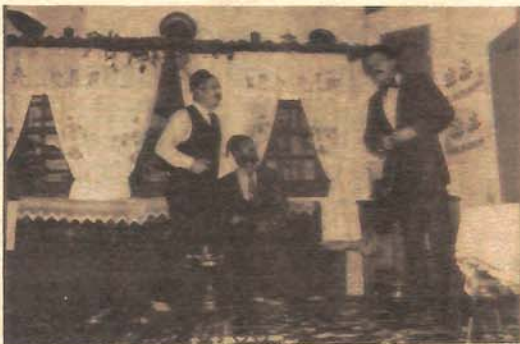
Predstava „Tri svijeta“ u izvođenju amatera KUD-a „Tono Horvat“ iz Velike Kladuše