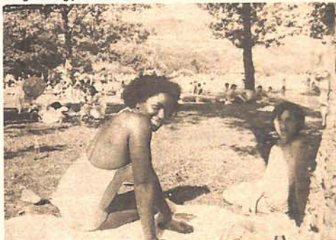
Engleskinja Šejla Grand hvall jajačko sunce i čiste vode Plivskih jezera