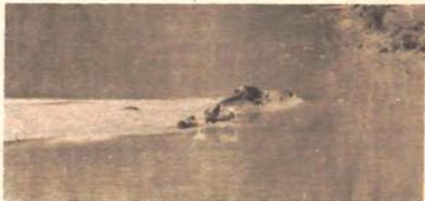
Ni voda nije prepreka za vepra ni lovačkog psa