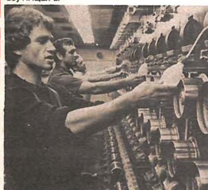
Бољим радом до позитивног пословања: из производних погона бањалучког ИНЦЕЛ-а

ПОРАСТ ЗАЛИХА ГОТОВИХ ПРОИЗВОДА УГРОЖАВА ПРОИЗВОДЊУ