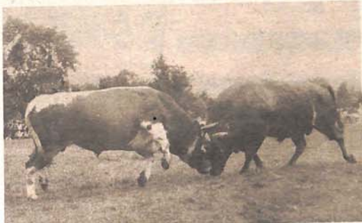
Borba tupih rogova

Ako je u moći i slobodi novinar da izrazi svoj utisak sa mnogoljudnog skupa koje se u jednom danu učini takvim da se ni razlozi ni povodi ne mogu suštinskije odgonetnuti, onda neka mi bude dopušteno da ovim kazivanjem „prepišem“ doživljaj jučešnje, 213. grmečke koride. Dakle, još u zorište, a netom u rane jutarnje sate jučešnjeg, dosta vjetrovitog i tmurnog, pa tako i prohladnog dana, makadamskim putevima i šumskim puteljima milite su kolone ljudi, automobila i autobusa već pomalo ogoljelim Grmečom ka Mededem brdu, tromeđi ključke, sanske i petrovačke opštine. Novoprizitale dočekivao je prizor pripreman dan-dva uoči glavnog događanja, znane koride: u šatorima improvizovane kafane i prodavnice svega i svačega, muzika niskog i onog malo višeg „renomea“ sa kafanskim pjevačima i pjevačima, vašaarska zabava poput čovjeka koju guta vatra, djevojke manje od novorođenčeta po život opasne vožnje motokicli-