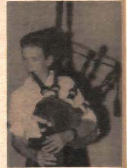
Bez gajdi, naravno, ništa

Kako su mladi Škotlandani ujedno članovi folklorne grupe „Ros-šair folk“ priredili su Banjalučanima u nedjelju u bašti