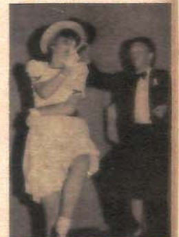
Simpatična igra udvaranja