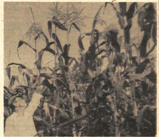
Kukuruz je dobro ponio, samo da dođe i spasnosna kiša

Traka na heligradu, aparatu koji registruje broj sunčanih sati, propžena je cijeli dan. Sunce žete neprekidno.