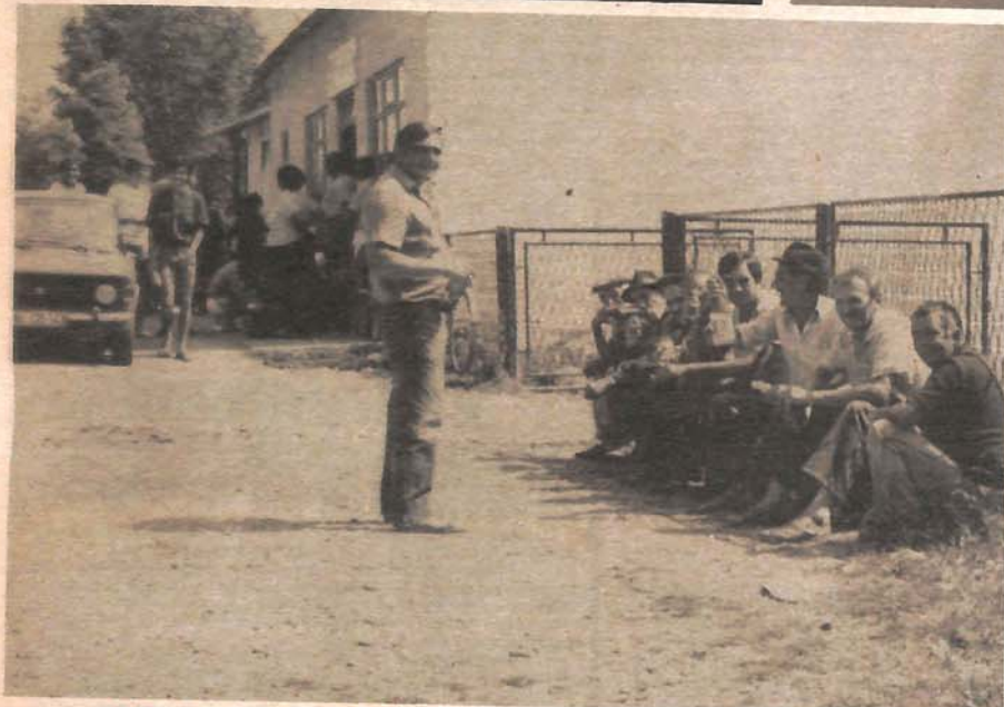
ПОСЉЕДЊА КИША ПАЛА ЈЕ У ЛИЈЕВЧУ 18. ЈУЛА

Тема дана међу ратарима је кукуруз и киша