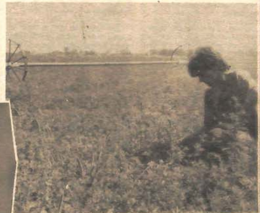
Lucerka će izdržati, ali uz pomoć vještačke kiše

Nadali su se seljaci da će kiša doći u subotu pa u nedjelju, ali nije zasad ima samo u meteorološkim prognozama.