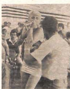
Neukus ima svoju cijenu i to paprenu

I, napokon, nigdje nijedne ljudske riječi o narodnom heroju i generalu, pokojnom Milančiću Miljeviću, čovjeku koji je u nastojanju