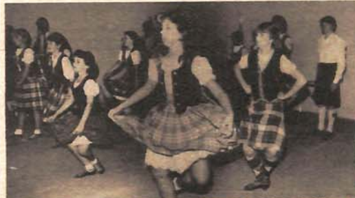
Mladi Škoti (prosjeck godina od 12 do 19) izveli su splet igara i pjesama svoje domovine, te jedan irski ples