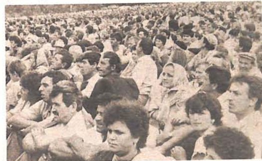
Više od stotinu hiljada gledalaca okupilo se na Mededem brdu

ma u glasovitom „zidu smrti“. Onda lubenice, na hiljade tona, pa voće, povrće; zatim mirisi pečene jagjnetine, pivo, prasetine i još kojekakvih brozospremajućih jela — sve nadohvat ruku ako podnosi džep. A sve to, kažemo, po šumarcima, njivicama, kopsištu šljunka, improvizovano do te mjere da pruža dosta mučnu sliku.