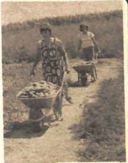
Kraslavci su propali, ubila ih žega, mogu se jedino koristiti za ishranu svinja

U zemlji, na dubini od 50 centimetara, nepogrešivi agrote-