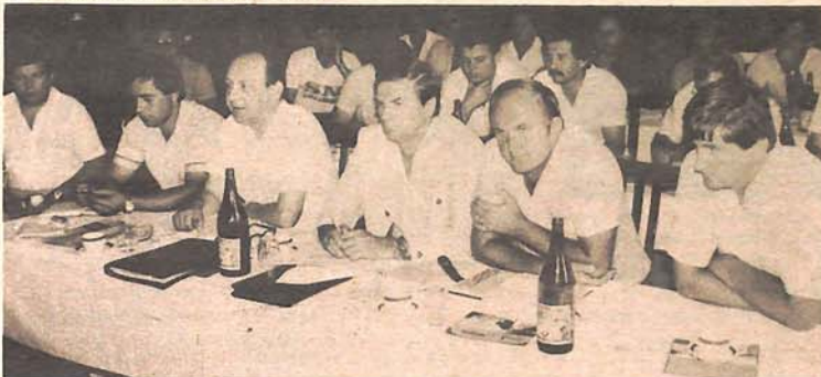
Nemoć — delegati Konferencije udruženja klubova Regionalne lige grupa „Zapad“