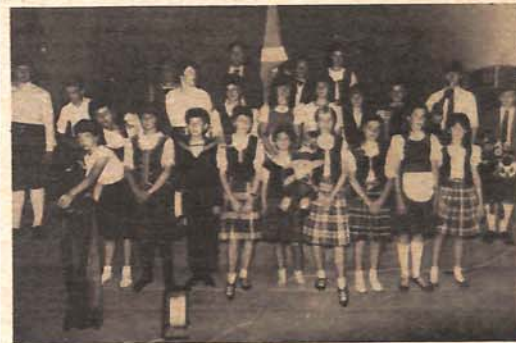
Gosti Banjalučana, grupa „Ros-šair folk“ iz škotskog grada Invernes