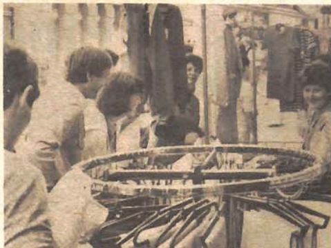
Konfeksionari spas traže u rasprodajama, istina, sezonskim za sada, ali nije daleko vrijeme kada će rasprodaja biti još više

Smanjena tražnja, ocjenjuju u ZIT-u, sada najviše djeluje na proizvodnju namještaja, metalopreradivačku djelatnost, mašingradnju i još neke dijelove privrede. Radi se o takozvanim fi-