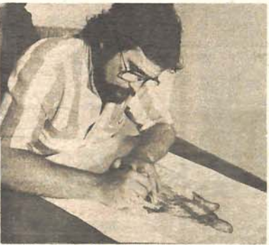
Opet uoči u Sanski Most, na Drugovanje

Čovjek je nesavršen. On je ponekad više ili manje licemjer, i budale kažu onda da se dobro ili rđavo vlada. Ja ne optužujem bogataše da bih pohvalio one koji nemaju ništa: čovjek je isti i na vrhu, i na dnu i u sredini. Na svaki milion te krupne stoke dolazi desetak šaljivčina koji sebe stavljaju iznad svega, čak i iznad zakona; ja sam jedan od njih. Vi, ako ste viši čovjek, idite pravo i uzidajte glave. Ali ćete imati da se borite protiv zavisti, klevete, osrednjosti, protiv cijeloga svijeta. onore de balzak