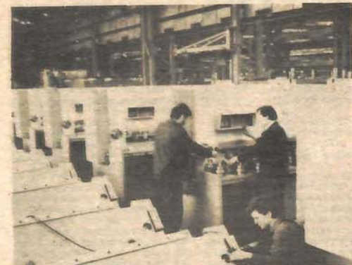
TAS najuspješniji: montaža i posljednja provjera alata i mašina

njaluci. Ilustracije radi, dovoljno je reći, uz pune fondove, prosječan mjesečni lični dohodak je ovdje 52 hiljade dinara.