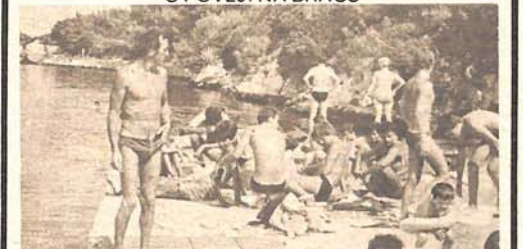
Čisto more i lijepo uređene plaže mame kupaće