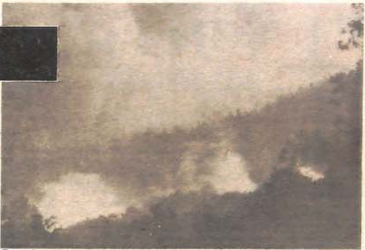
Borovi u vatrenom obruču

Gori još uvijek na sve strane. Sve što natrikuje, svom širinom Biokovo. Ipak vidi se da vatra više ne divlja i da je pod kontrolom. Kiša još pada. Dozvoljavaju mi izlazak na magistralu i na milicionarskom motoru milim prema Makarskoj. Zar u ovoj zemlji postoji toliko vatrogasnih vozila? Domaće vatrogasce i ovdnjašnje ljude nije potrebno ni pominjati. Tu su svi iz Omiša, Splita, Karđeljeva, Vrgarca, Imotskog, Posušja, Livna, Dubrava, Čapljine, Metkovića... Specijalna protupožarna jedinica ljudi izvozila JNA iz Sarajeva koje su sve do ovog požara gasila Korčulu. Za njih kažu da su stigli u umorni, ali da su u ovom požaru stigli bili kao bijesni kivi. Trgnali su u vatropne jezike. Mokra, jeziva trava tišinom obavija zgarista. Iz svakog bivšeg bora još tinja po mali plamačak. Kao svijetla za bivše, umrlo zelenilo. Smrad zgarista ulazi u