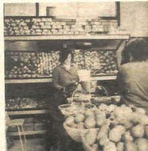
Za koji koncept trgovine se opredijelili

— Naš ovogodišnji plan u Banjaluci je 500 miliona dinara. Samo na jabukama trebalo bismo da napravimo prometa u vrijednosti 450 miliona dinara, odnosno da plasiramo 450 vagona. I nadamo se da neće biti problema. Interesantna je vaša akcija da se grad u obezbijedi kvalitetnije i jeftinije snabijevanje voćem i povrćem i ona treba dati određene rezultate. Prostora za udruženi rad ima dovoljno, a bez poljoprivrednika na pijaci nema ni kva-