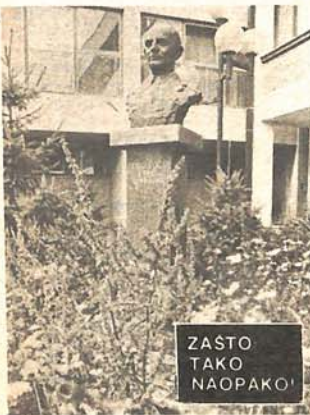
ZASTO TAKO NAOPAKO!