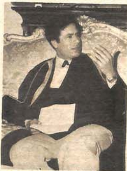
Moamer el Gadafi

Na aerodromu u Tripoliju predsjednik Vlaković je priredjen svečan doček. Predsjednika Vlakovića i članove jugoslovenske delegacije srdačno su pozdravili domaćin, vođa libijske revolucije pukovnik Moamer el Gadafi i druge visoke libijske ličnosti. Neposredno po dolasku u Tripoli, predsjednik Vlaković je u kratkoj izjavi za libijsku javnost rekao da „Jugoslaviju i Socijalističku Narodnu Libijsku Arapsku Džamahiriju