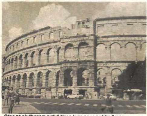
„Otac na službenom putu“ digao je na noge pulsku Arenu

Emir Kusturica nam ne donosi novu temu, ali u saradnji sa scenaristom Abdulahom Sidranom on nam je donosi na nov i svjež način, svima zanimljiv i razumljiv...“ I zaista, film „Otac na službenom putu“ je izvanredna demonstracija koja otkriva zdravlje u čovjeku, a to je smijeh. Ali, taj smijeh je daleko od onog što se poja-