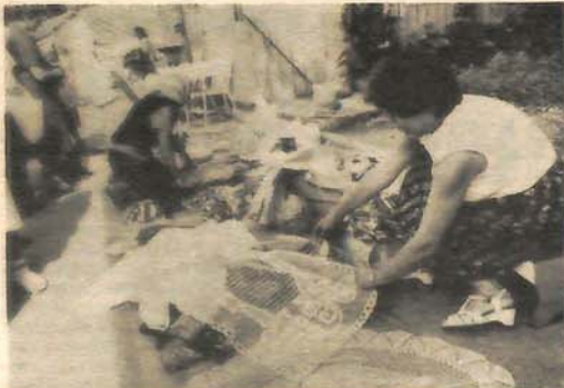
Među raznobojnim krpicama ima i lijepih ručnih radova. Od cjenkanje zavisi hoće li biti jeftini ili skupi