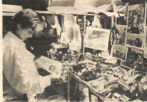
Sarenilo-nudi se i kupuje sve od „najk“ vrećica do dječijih igračaka

U SERVISIMA EI NIŠ I „GORENJE“ ORGA-NIZACIJOM U SUSRET GRAĐANIMA