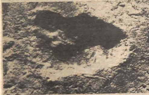
Dva otiska ljudskog stopala: (gore) u Tanzaniji, starog 3,6 miliona godina i (dolje) na Mjesecu, načinjenog 1969. godine

da čak i univerzitetski obrazovani ljudi u SAD brkaju kontinent kad je u pitanju gdje je smještena Jugoslavija?