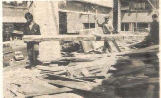
Posao rušenja povjeren radnicima Zanatske zadruge