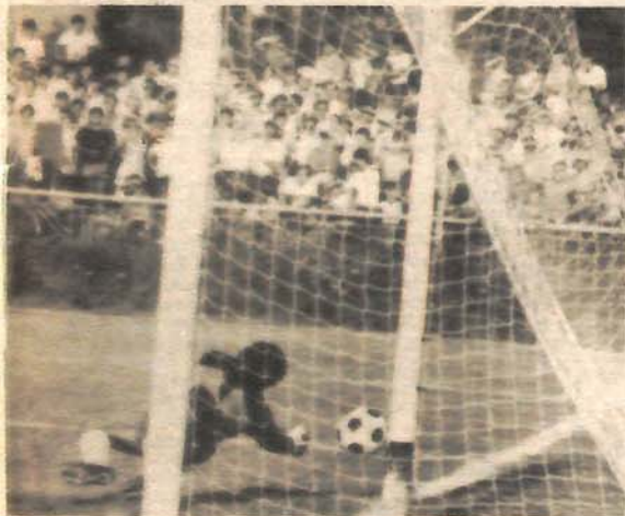
ODBRANA: Vratar Iskre Štaro opružio se „koliko je dug“ i zaštitio mrežu.