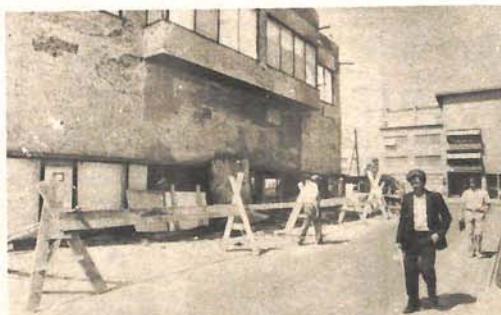
Objekt „NAME“ neće biti miniran, već će se rušiti dio po dio