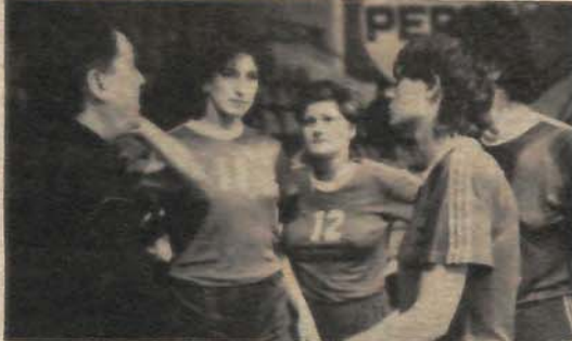
Trenera Jurića i u ovome prvenstvu očekuju iste brige