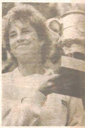
Prva na svjetskoj listi: Kris Evert-Lloyd

NJU DŽERSI - Jugoslovenska teniserka Sabrina Goleš uspjeshno je startovala na međunarodnom teniskom turniru u Nju Džersiju koji se igra za nagradni fond od 150 hiljada dolara. U prvom kolu Sabrina Goleš je pobijedila Amerikanku Džozan Raser sa 6:3, 3:6, 7:5.