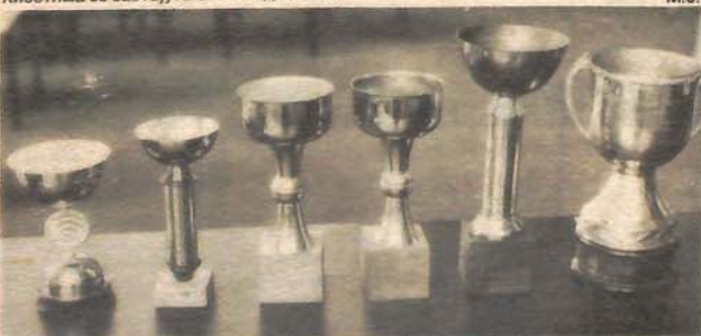
Трофеји „Лиге Гласа“

у Росујама: Ударник — Јелшинград, у Буваку: Омладинац — Лакташи и у Мејдану: Напријед — Жељезничар. Сви мечеви се играју од 17,30 сати.