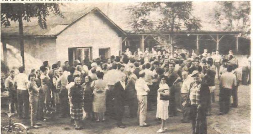
Gužva na uplatnom mjestu stovarišta uglja u Pilanskoj ulici

NA STOVARIŠTU „GRADE“ U PILANSKOJ ULICI POČELI PRIMATI UPLATE ZA UGALJ