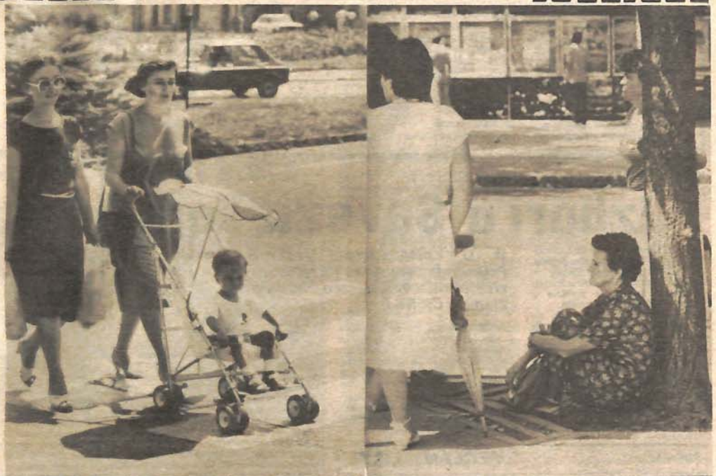
На температури вишој од 30 степени освјежења нема ни у хладу: Уобичајена слика ових дана на бањалучким улицама

Док је у граду тако, на житородним пољима кукуруз се бори да опстане. У бањалучком Центру за примјену науке