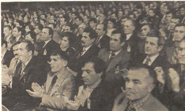
Za jedinstven Sindikat „palo“ je izjašnjenje na Devetom kongresu

No, i tada se mora voditi računa da radnici tih djelatnosti budu u mogućnosti da na organizovan način ispolje autentične interese u odgovarajućem sindikatu Jugoslavije. Obrazovanje po pravilu istog broja odbora Sindikata u republikama i pokrajinama kao i na nivou Federacije, treba da doprinese jačanju funkcionalne veze, efika-