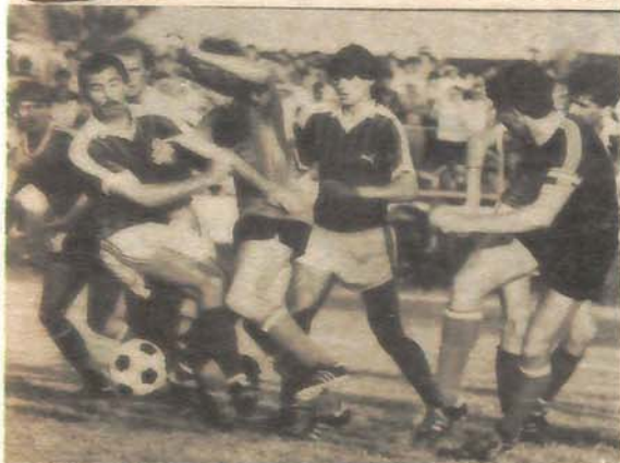
BORBA: Ova fotografija najbolje ilustruje dinamičnost susreta Rudar — Iskra, odigran pred 7000 gledalaca u Prijedoru, bez obzira što nije bilo golova.