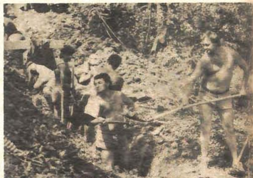
Akcijasi ORB „Heroj Srba“ iz Smedereva učestvuju u izgradnji infracrkture u Adi