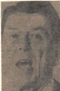
Ronald Regan i Mihail Gorbačov: „Hoće li stići zvanično pismo?“

Američki razlozi za odbacivanje sovjetskog prijedloga ne