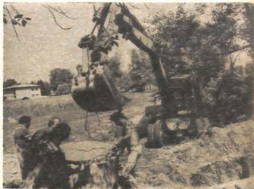
Na najtežim poslovima - pomaže i bager