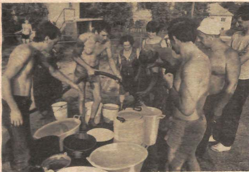
U bosanskopetrovačkom naselju Ploča: uvijek ostane i praznog posuda