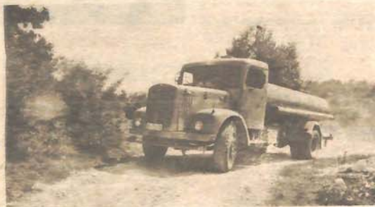
- Cisterna se penje prema Vranjici, selu nadomak Bosanske Krupa