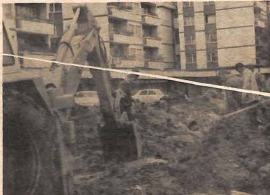
Uskoro ljepši izgled centra Srpsa