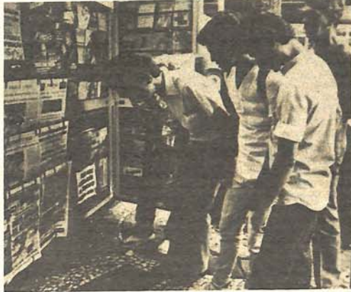
Veliko interesovanje za aferu oko kafe, šećera i turizma

Grlijsi Instituta, koji je pod direktnom kontrolom Ministarstva svišva su dugl za nabiranje. Ove koje navodimo više su folklorno zanimljivi, nego finansijski teški. Kao recimo ovaj: Insti-