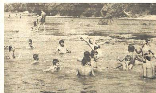
Igre u vodi uvijek su privlačile mlade