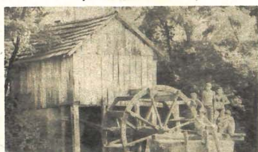
Vodanica na Sani - jedina koja odoljeva vremenu