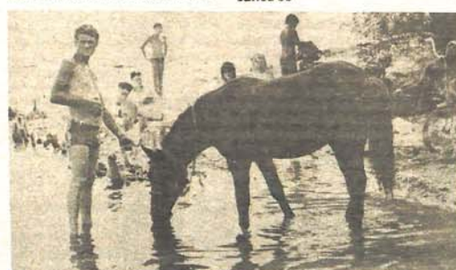
Kako kaže „gazda“: Doveo sam ga da se napije vode, a ja da se rashladim