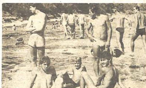
Obala je redovito prepuna kupaca