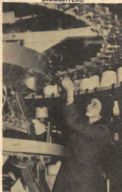
Извозни послови „Комбитексних“ ООУР-а су све већи - детаљ из хале „Новитета“ у Босанском Петровцу