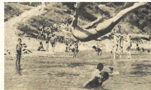
Jedno „direktno“ osvježenje