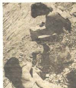
Ova vrijedna djevojka spojila je uzvodno s korisnim - veze goblen i sunča se