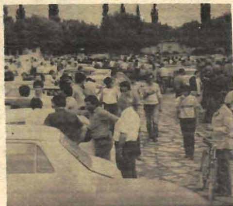
Detalj sa pijace automobila

● Protekle nedjelje „pazar“ na auto-pijaci je bio slab ● Tome su najviše kumovale previsoke cijene i mali broj stvarnih kupaca ● Pijaca-mjesto za „ubijanje“ dosade