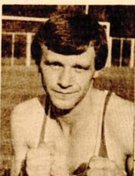
ću se u klub vratiti fizički potpuno spremni i da ću poslije dvadesetak dana moći i u ring. Uželio sam se boksa, mečeva, okružja i jedva čekam da se vratim i uđem u ring.

-Ostalo je još oko 90 dana i eto me ponovo u Slaviju, u ring. Sada sam na dužnosti referenta za sport u jedinici. Po čitav sam dan u dvorani ili na terenu. Stalno treniram, dižem legove, trčim. Ranije sam učestvovao na armijskim prvenstvima, u vojničkom višeborju i u krosu. Postizao sam dobre rezultate, pokazao sam se kao dobar vojnič i sada bešem plodove takvog odnosa prema vojničkim obavezama. Uvjeren sam da