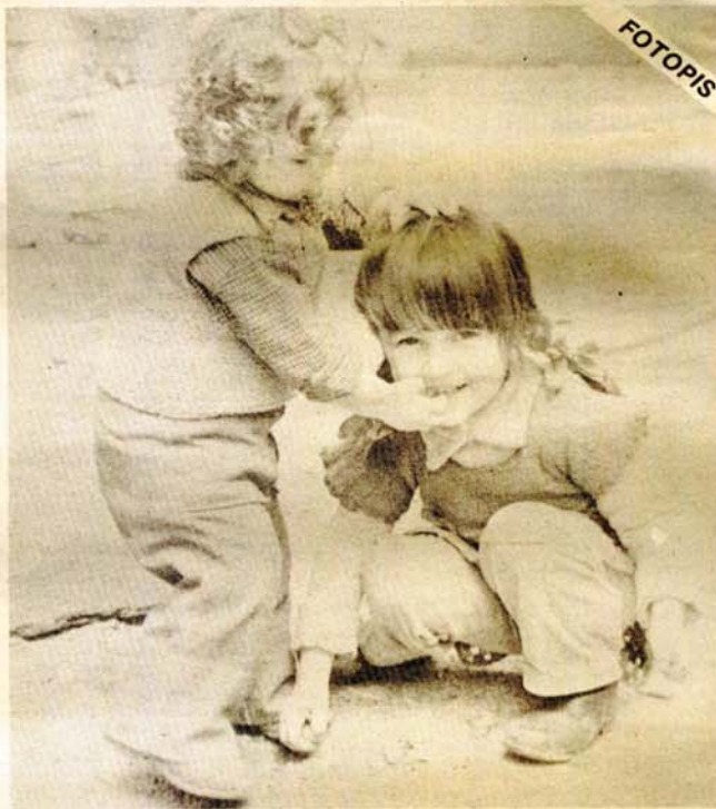
„Uzmi pola žvake“

Za liječenje ovog oboljenja potrebno je u prvom redu suzbijati infekciju respiratornog sistema, zatim nastojati tonizirati srce i otkloniti višak tekućine iz organizma. Postoji čitav niz preparata kojima se navedeni terapijski zahtjevi mogu uspješno sprovesti. Upotrebljavaju se antibiotici, preparati digitalisa ili drugi kardiotonici, te saldiuretici. Jasno, da je potrebno sprovesti i intenzivno liječenje postojeće oboljenja disajnih organa. Povećano je potrebno uz svu propisanu terapiju davati i kiseonik. Ishrana mora biti sastavljena pretežno od bijelčevina i ugljenih hidrata sa redukcijom soli. Pušenje treba potpuno zabraniti, a bolesnicima omogućiti što više odmora. Obično dobro čini i promjena boravka - klimatski faktor.