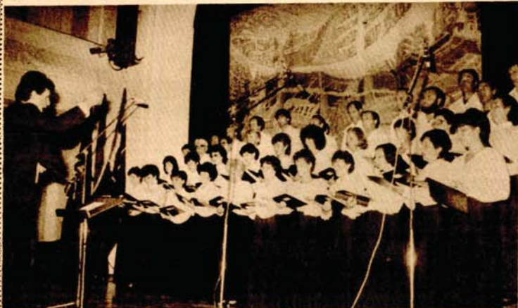
Muzika vezana za Krajinu i pjesničku riječ — Hor RTV Sarajevo na sceni

Kočičevog zbora, koja će imati bijenalni karakter