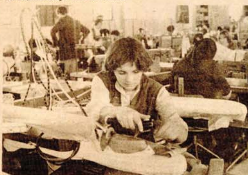
Udarnički tokom ljeta: iz pogona „Sane“ u Bosanskoj Kostajnici

● U julu i avgustu, i pored korištenja godišnjih odmora, produktivnost na nivou evropske ● Septembarska proizvodnja od 30.000 ženskih bluza za sezonu jesen-zima za zapadnonjemačko tržište