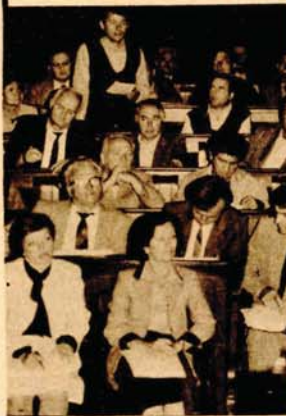
Делегати о привредним резултатима: Забрињава опадање производње и раст залиха

КАКО ТО РАДЕ У ОСНОВНОЈ ЗАДРУЖНОЈ ОРГАНИЗАЦИЈИ БРАВСКОГ КОД БОСАНСКОГ ПЕТРОВЦА