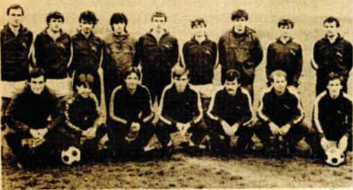
Derbi: Fudbalere Prijedor (na slici) očekuje veliko iskušenje u meču sa Berekom