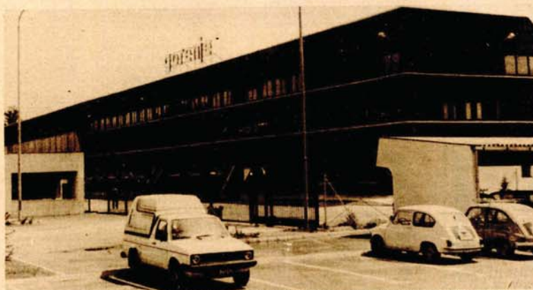
Нова творница „Горења“ у Бихаћу. Када буде радна пуним капацитетом запошљаваће 1.100 радника

хине БИРА ће производити 600 хиљада апарата годишње. Значајно је за ову творницу што се економски наслана на репродуциран босанскохерцеговачке привреде, с тим што ће се 90 одсто сировина обезбједити са домаћег, а само 10 одсто извозом. Производња у БИРИ је технолошки заокружена линија од ре-