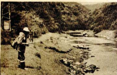
Ribarenje na Krušnici

BOSANSKA KRUPA — Ribarsko društvo u Bosanskoj Krupi ima registrovanih 800 članova. Društvo je organizovano po sekcijama što se pokazalo praktično. Mnogi od članova Društva u ulovu ribene poštuju kriterije i dogovore ribarenju. To se ogleda kažu u Društvu, u prekobrojnem ulovu, lovu na nedozvoljenom prostoru, lovu nedozvoljenim mamoom islično. Osim članova pojavljuju se na obalama Une, Krušnice, Japre, Vojkove i drugi krivolovci. Ribarisi preduze li niz aktivnosti u suzbijanju ovih nedozvoljenih pojava. Angažovana su tri čuvara a kontrolu vrše i članovi društvene kontrole po sekcijama. Rezultat takvih aktivnosti su pokazali da je kršenje određenih normi u ribarenju dosta prisutno i kod članova društva. U toku 7 mjeseci ove godine podneseno je oko 200 prijava sudiji za prekršaje. Pored toga, poduzet je i niz disciplinskih mjera protiv članova Društva koji su se po našali mimo pravila. Tako je 27 članova Društva izrečena disciplinska mjera zabrane lova od 2, 3, 4, 6 i više mjeseci. Bilo je i onih koji su dobili mjeru isključenja iz Društva. Više od 50 članova dobiti je opomenu. Teškaća ima da se suzbije krivolov i tu se čine napore da se u zajednici sa drugim nosiocima društvene samozaštite učini više zaštiti vodotoka na području opštine. — Naše je opredjeljenje da i dalje radimo na poboljšanju discipline kod naših članova, da