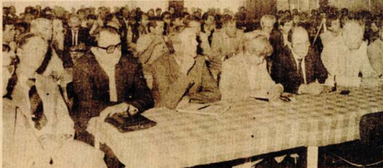
Niz otvorenih pitanja i argumentovanih odgovora

Podsjetio je Hamdija Pozderac i na decidne ocjene koje smo imali sedamdesetih godina, kada smo uz realnu ocjenu stanja u svijetu, prognozirali i ekonomsku krizu. Ni