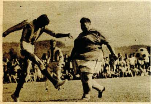
Kad Doko napada, treba biti oprezan. Jednu takvu akciju odbrambeni igrači mršavih „panično“ završava „što dalje od svog gola“

Mesud MUJIĆ Slavko GRAHOVAČ