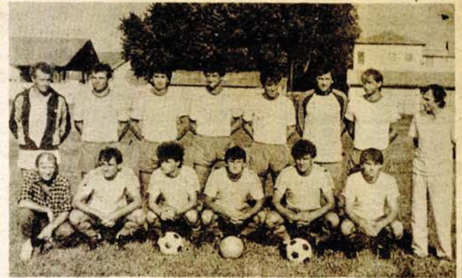
Bod kao kuća: fudbaleri Laktaša

JAJCE — Bratstvo je danas iznenadilo slabi tim Vrbasa, koji je u drugom