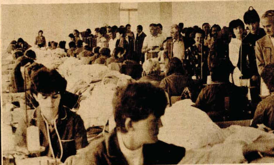
Zadržati mlade na selu: U novom pogonu posao je dobilo 120 mlh mlh radnika, uglavnom s područja Ruiške i okolnih sela

BOSANSKI NOVI, 15. septembra — U okviru septembarskih svečanosti, formiranja Prvog narodnooslobodilačkog odbora u podgrmečkom kraju i sjećanja na Sestu krajišku narodnooslobodilačku brigadu, u adaptiranom prostoru napuštene zgrade ovdajšnje osnovne škole u Ruiškoj, Tvornica trikotaže i konfekcije „Sana“ otvorila je pogon za proizvodnju ženske i dječije konfekcije. Novi „Sanin“ proizvodni kapacitet, u čiju je adaptaciju i opremu uloženo oko 88 miliona dinara, u prvo vrijeme će zapošljavati 120 radnika, uglavnom s područja ove mjesne zajednice, a koji će godišnje proizvoditi oko 170 hiljada komada raznih odjevnih predmeta. Nema sumnje da će „Sana“ i na taj način zaustaviti odlazak mladih sa sela.