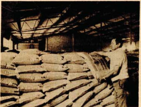
PRIPREME: Savo Nikolić, poslovođa megacina OZO Nova Topola uvjerava sve nerjerne Tome da će ovogodišnja sjeta biti spremno dočekana. Jer, na legeru se već nalazi pedeset tona sjemenske pšenice, a stičeće još 30, ima dovoljno NPK i KAN-a, UREA će stići, a ove godine otkupljuje sve što se penudli - krompr, luk, papriku, pasulj, pšenicu, kukuruz, ječam, zob... a poljoprivrednicima nudi mekinje, sve vrste koncentrata, sredstva za zaštitu. Ali, ipak, kaže da će najbolji posao napraviti kada se saznaju cijene sjemena kroz zamjenu.