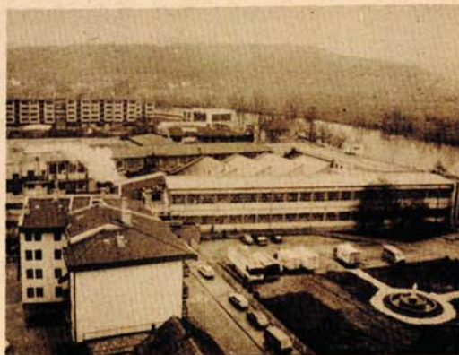
Za osavremenjavanje proizvodnje investirano je više od 700 miliona dinara

● Smanjen je uvoz sirovina, a povećan izvoz „Saninih“ proizvoda