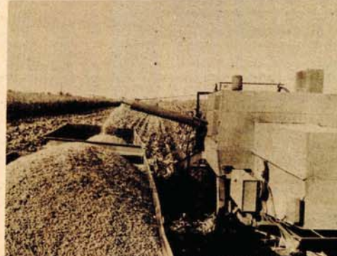
KUKURUZ: U Bosanskom Aleksandrovcu kukuruz je dozrio za berbu, pa su na parcelama u ovom selu i zabrujali prvi kombajni. Parcela je šarolika, ima zrelog i još zelenog kukuruza, a vlažnost se kreće i do četrdeset odsto.

LIJEVCE POLJE, 24. septembra - Lijevice polje je ponovo oživjelo. Sabiru se plodovi truda sa bogatih i prostranih polja. Kombajni su zabrujali i ušli u polja, počela je berba zlatno-žutog zrnja, koji na svjetskom tržištu važi kao naša moneta. Povrće je, kao nikada ranije, iskoristilo isušive toplo ljeto, za koje meteorolozi kažu da je ravno tropskom, i dobro se ponijelo - kako to vele poljoprivrednici. Pa, ipak, na tržištu mu cijena nije mala, nije jer su zemljoradnici svoj rad počeli da mjere sa radom u industriji, pa se kilogram paprika upoređuje sa kilogramom eksera, i da sve ne nabrajamo.