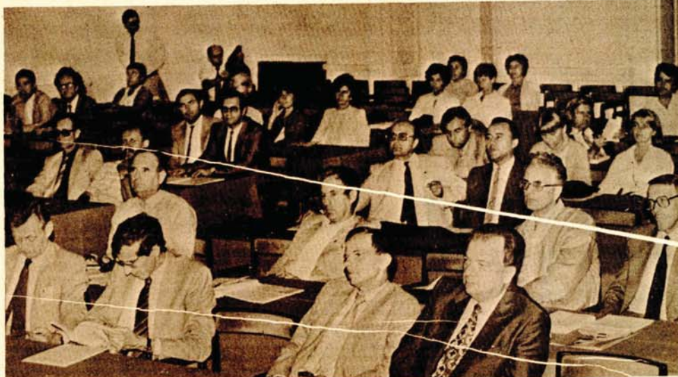
Током Симпозијума биће поднесено више од педесет стручних реферата