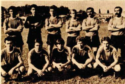
Fudbaleri Borca iz Bosanske Dublice BANJALUKA: BSK - BRATSTVO