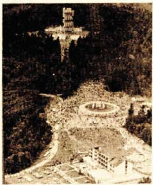
Uz spomen-obilježje i zaštitu prirode: Mrakovica

● Učlanjivanje utemeljivača i članova u jedinstven dobrovoljni Fond „Kozara“ trajan zadatak Skupštine SIZ za njegovanje tradicija NOB i zaštitu prirode na Kozari ● Primjer Bosanske Dubice u kojoj ima preko 3.000 članova Fonda