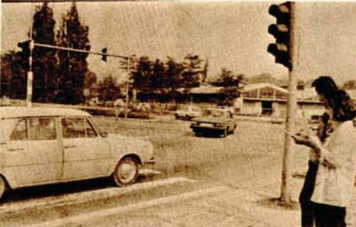
Srednjoškoci pomogli saobraćajcima