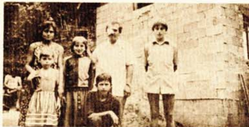
Porodica Delić pred novim domom