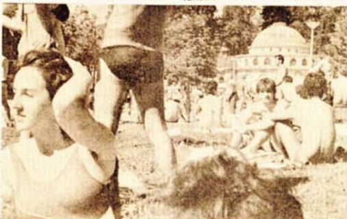
Detalj sa bazena u Laktašima

Od značajnijih novosti vezanih za poslovanje „Termala“ u narednom periodu, a pogotovo za rad hotela „San“, značajno je istaći da je izlazak na turističko tržište Belgije gotovo obezbijeđen. Poslovi se ugovaraju sa „Belga turistom“ iz Lježa, a dolazak grupe od oko 50 mladih sportista je ugovoren za juli 1986. godine. Oni bi u Laktašima boravili od 20 do 30 dana, ali je domaćin obavezan da im obezbijedi brojne sportske poligone i sportsku dvoranu. M. JOKSIMOVIĆ