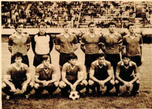
Fudbaleri Rudara zabilježili su pobjedu i izbili na 7. mjesto

STRIJELCI: Bihorac (77) i Grabo (90), Sudija: Mamić (Bjelovar) 7; Gledalaca: 4000. RUDAR: Radčić 7, Turunčič 7, Mešić 6, Bihorac 7, Bekvalac 7, Parhamov 7, Topić 7, Ostojić 6, Grabo 6, Stakić 6 (Pekija 7), V. Samarđžija 6, Kušljugić 6. ZADAR: Lazović 7, M. Čutuk 6, Grgić 6, Stegnjajić 5, V. Čutuk 7, Bukić 6, Halimić 6, Kvartuč 6, Goić 6, Kalopać 6 (Vulić 6), Marušić 6.