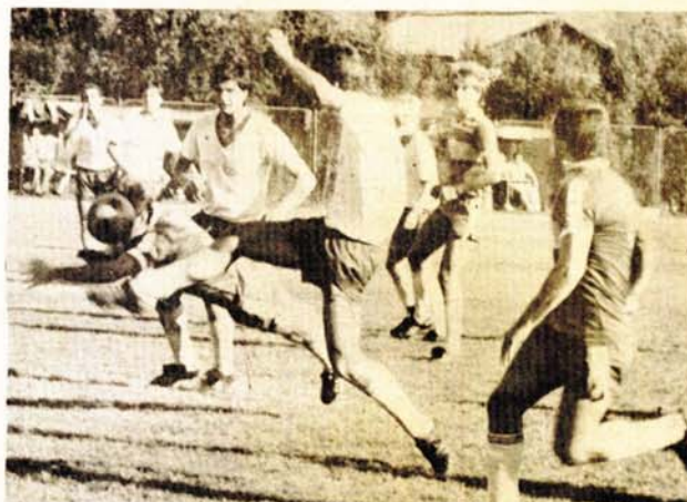
Oštro i beskompromisno: meč BSK — Bratstvo donio je igru punu dinamike Smlmo: R. OSTOJIĆ

STRIJELCI: Banjac, Makelić i Trkulja (auto-gol), sudija: Runić (Banjaluka) — 8, gledalaca: 600.