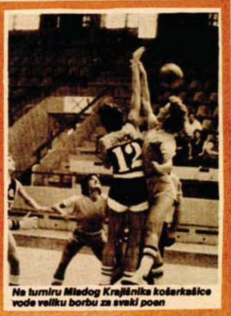
Na turniru Mladog Krajinika košarkašice vode veliku borbu za svaki poen