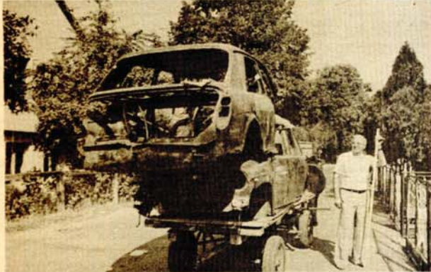
U Ulici braće Odića u Banjaluci - čudan teret