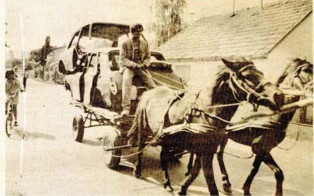
Poni, riđani i stare školjke