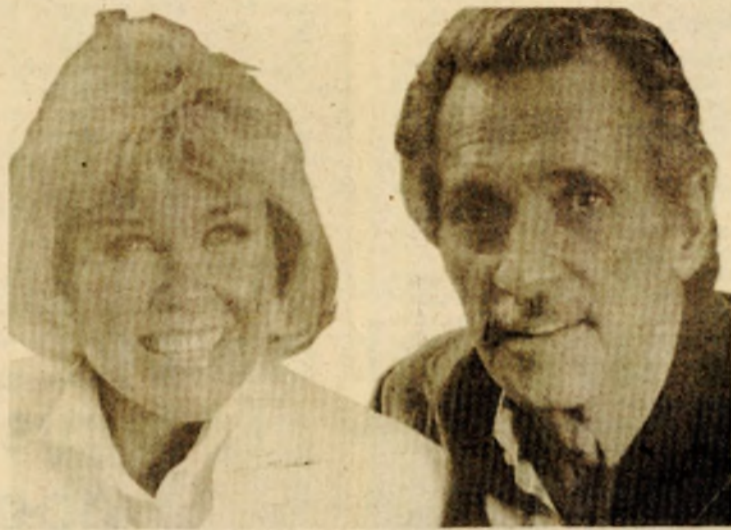
Doris Deej i Rok Hadson važili su za holivudski par snova (sreli su se nedavno, 20 godina nakon snimanja filma „Saputanje na jastuku“)