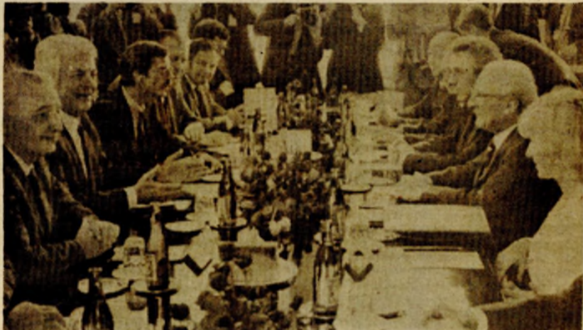
Za vrijeme zvaničnih razgovora Žarkovića i Honekera

● Razlike u stavovima o pojedinim pitanjima koje su rezultat specifičnog društvenog razvoja i različitog međunarodnog položaja, nisu prepreka razvoju prijateljskih odnosa i ravnopravne saradnje između dvije partije i zemlje, konstatovano je u jučerašnjim razgovorima