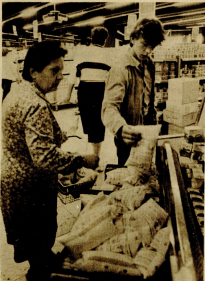
Juče u „Boskinoj“ samoposluzi Mljekari tvrde da će nove cijene obezbijediti dovoljno mlijeka i prerađevina na tržištu

OD JUČE ZBOG POVEĆANJA OSNOVNOG POREZA NA PROMET