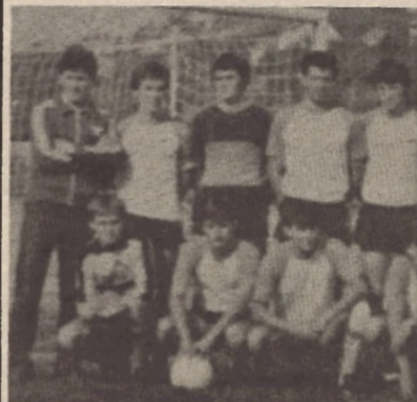
Fudbaleri Progres, članovi grupe lize „Vrbas“