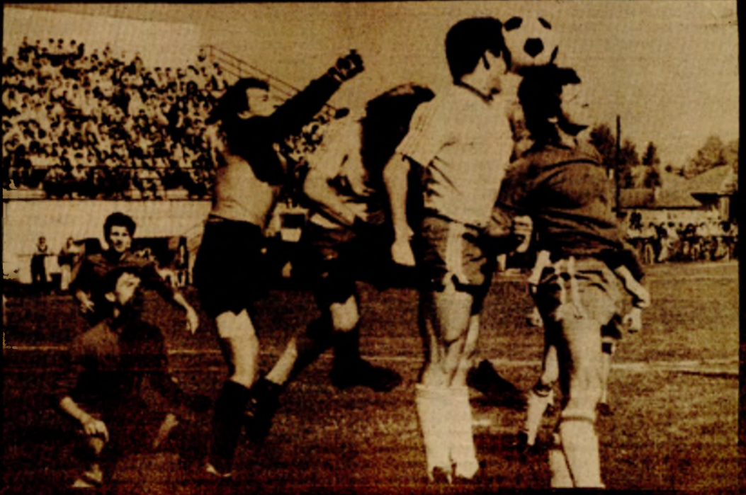
Голман БСК-а Чатлак интервенише на јучерашњем дербију Регионалне фудбалске лиге, одиграо у Приједору између БСК-а и Берекa 2:2