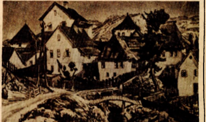
Tomislav Krizman: „Medreski brod“ (grafika) Banjaluka između dva rata

● Tekije su bile mjesta gdje su se susretali obrazovani ljudi. Građene su obično na lijepim i osamljenim mjestima pogodnim za kontemplaciju..