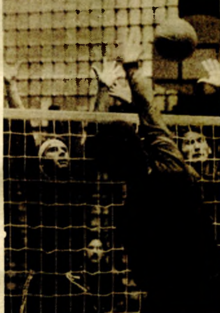
Detalj sa utakmice odbojkaša „13. maja“ i Famosa Korana