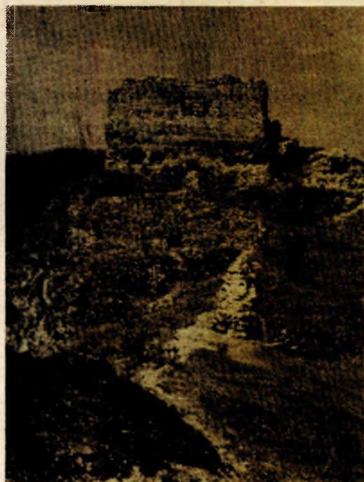
Stari grad Prusac (tvrđava) danas

Danas je to lijepo selo sa 400 kuća u kojima živi oko tri hiljade stanovnika. Privrednih objekata ovdje nema, ali su žitelji ovog kraja poznati nadaleko kao izvršni bačvari, čiji proizvod odlaze put Dalmacije, pa i dalje. Izgrađeno je mnogo lijepih kuća, infrastruktura također, asfaltni put vodi do Donjeg Vakufa i dalje u