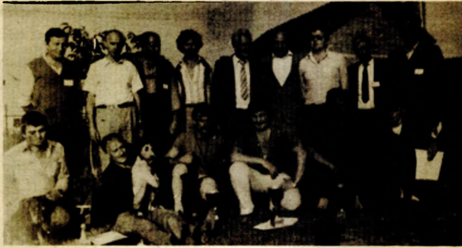
Dobitnici priznanja sa svojim ljubimcima (čuče) i sudije sa organizatorima (stoje)