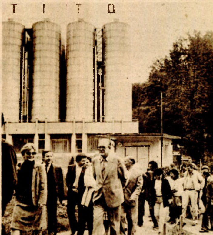
Домаћин новинарима градова пријатеља био је јуче АИПК „Босанска крајина“ снимљено у Бањалучкој пивари

ДЕЛЕГАЦИЈА ПРЕДСТАВНИКА СРЕДСТАВА ИНФОРМИСАЊА ГРАДОВА ПРИЈАТЕЉА У БАЊАЛУЦИ