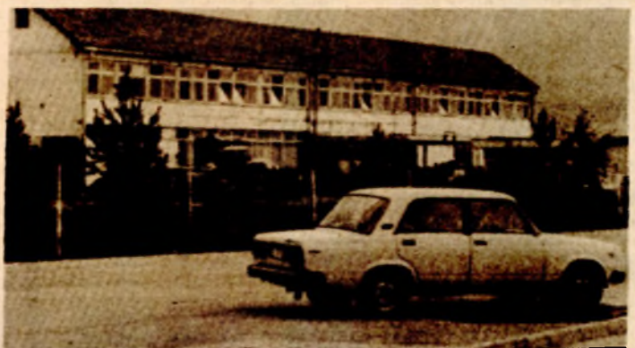
Samozaštita je u „Bosnaplastu“ i „Novitetu“ izvanredno položila ispit

Slične riječi, pune ogorčenja i osuđivanja mogle su dase čuju i u „Bosnaplastu“. A kako i ne bi. Svim je lako razumjeti ogorčenje zaposlenih. I ne samo njih, nego i uopšte mještana Bosanskog Petrovca. Mora se reći i to da je mještane ove bosanskokrajiške, komune i te kako neprijatno iznenadilo sve to što se dogodilo, jer se ovdje takvo nešto gotovo i ne pamti.