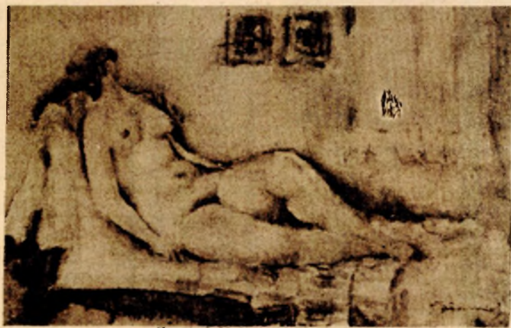
Krešimir Ižaković: „Model“