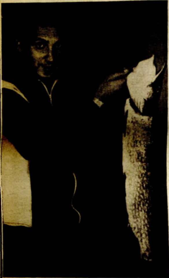
Upornost se isplatila

S dolaskom nove Džung dinastije na vlast u 12. i 13. vijeku, sve grobnice Džung dinastije su opljačkane.