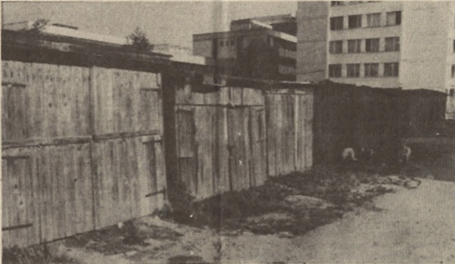
Drvne garaže — koje bi trebalo što prije srušiti