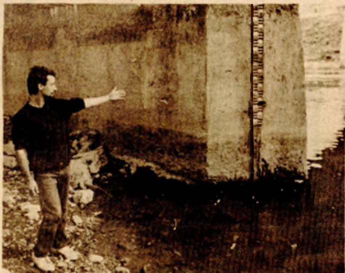
Не памти се овако низак водостај Врбаса одавно: Јуче код Градског моста у Бањалуци

Због тога је и производња струје у хидроелектранама „Бочац“, „Јаце 1 и 2“ сведена на минимум. Дневно се произведе око милион киловат-сати енергије. Више од овога забрањива вријеме које долази. Ако киша ускоро не падне, производња струје ће се нагло смањити.