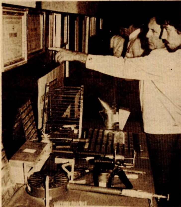
Veliko zanimanje za izložene predmete