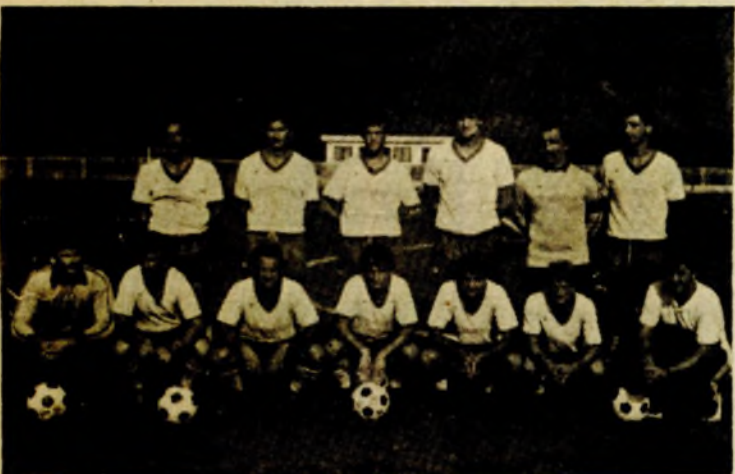
Ekipe BRATSTVA (Bosanska KRUPA) želi da se što prije uključi u borbu za prvo mjesto