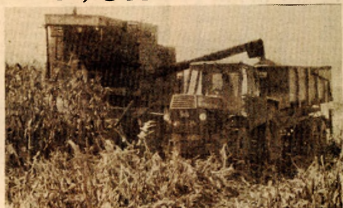
Berba kukuruza u Futogu

Preuzimanje kukuruza, kakose očekuje, biće znatno ubrzano narednih dana kada berba bude u punom jeku. Računa se da se iz ovogodišnje berbe u Vojvodini može otkupiti oko milion tona kukuruznog zrna.