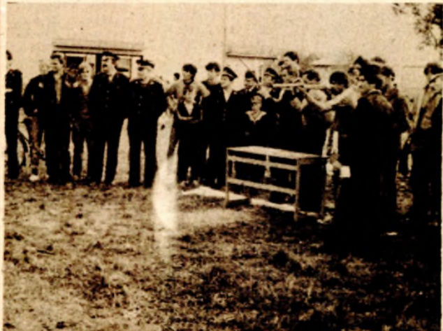
U gađanju vazdušnom puškom najuspješniji su bili vatrogasci iz Kotor-Varoša

TREĆI SUSRET VATROGASNIH DRUŠTAVA KOTOR—VAROŠA, ČELINCA, SKENDER—VAKUFA I VRBANJE