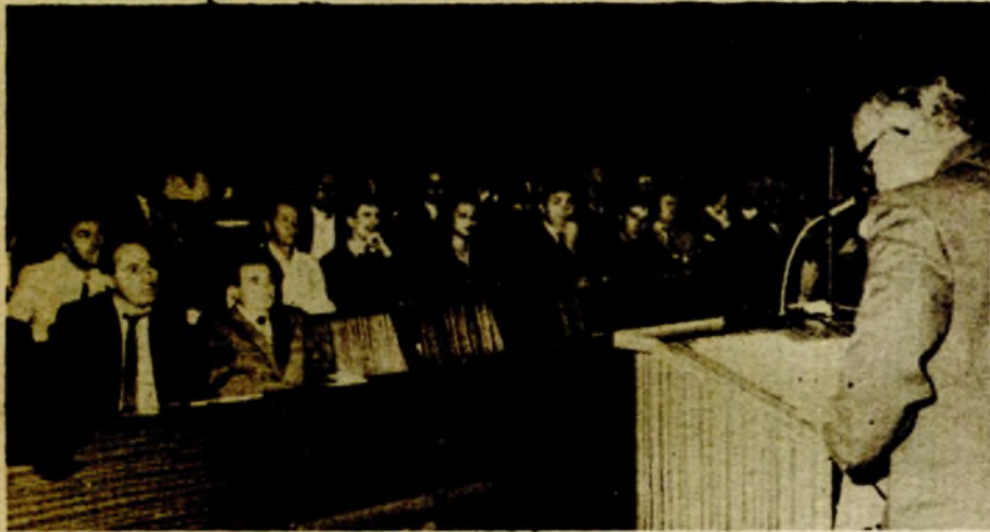
КАРДИОЛОЗИ НА ПАПРИКОВЦУ

БАЊАЛУКА, 13. октобра - Стручни састанак Кардиолошке секције Босне и Херцеговине, овог пута одржан у Бањалуци, био је посвећен најновијим знањима кардиолога наше републике у дијагностици и терапији срчаних обољења.