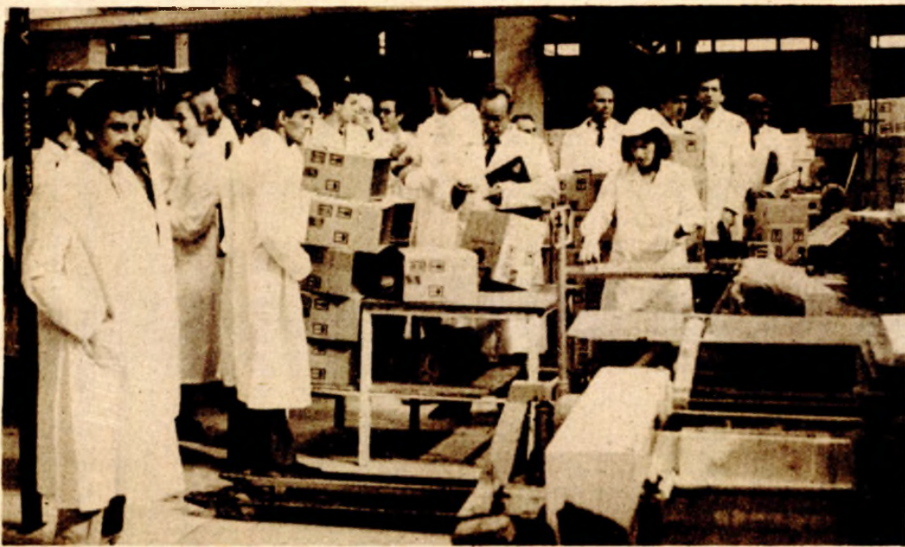
Delegati u posjeti Tvornici keksa i valta „Mira Cikota“

U Prijedoru su se, u okviru programa susreta, prvi put sastali najistaknutiji privrednici, predsjednici osnovnih privrednih komora, predsjednici međuopštinskih i opštinskih vijeća Saveza sindikata i drugi rukovodeći ljudi Bele Krajine, Korduna, Banije, Like i Bosanske krajine. Tom prilikom su razmijenili iskustva o dosadašnjoj saradnji i raspravljali o mogućnostima bržeg privrednog razvoja ovih krajeva. Uče-