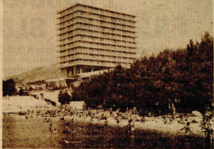
Markarska: Potiskuje li strani domaćeg turistu?