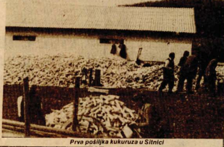
Prva pošiljka kukuruza u Sitnici

TVORNICI OBUČE U MRKONJIĆ-GRADU U ZAVRŠNOJ FAZI