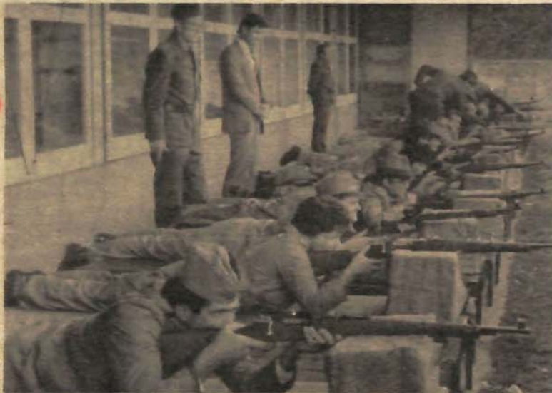
Rezultati gađanja veoma dobri na „vatrenoj liniji“ radnici Filijale „Jugobanke“

POSLIJE JUČERAŠNJEG IZLASKA REPUBLIKANACA IZ VLADAJUĆE KOALICIJE