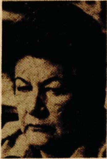
Predsjednica SIV-a Milka Planinc

U tome prioritetan zadatak je preduzimanje konkretnih mjera uz primjenu sankcija predviđenih Poveljom Ujedinjenih nacija za obuzdavanje agresivne politike režima aparthejda u Južnoafričkoj Republici i za okončanje ilegalne okupacije Namibije kako bi njen narod konačno ostvario slobodu i nezavisnost na osnovu već usvojenih odluka svjetske organizacije.