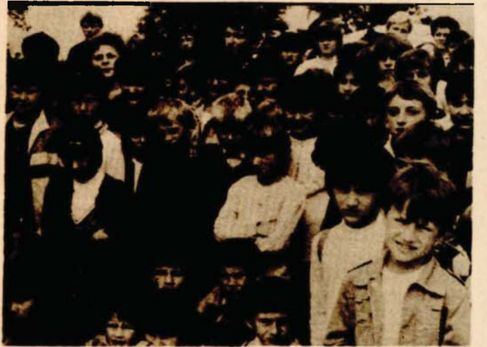
Djeca Bosanske Krupi umiju slušati pjesnika

Posljednjih godina, zvanično i nezvanično, na odgovornim i manje odgovornim mjestima, razgovara se o broju i svrsi književnih susreta kojih, da podsjetimo, u Bosanskoj krajini ima trenutno sedam - slične koncepcije i sličnog sadržaja. Organizacija svih ovih manifestacija uglavnom je stereotipna tako da su one vremenom okoštale u institucije. Postoje želje da se nešto izmijeni, da bude manje susreta, te da različitije budu koncipirani. No, trenutno, to su samo želje.