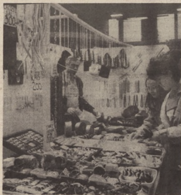
Sitnice koje će obradovati najmlađe