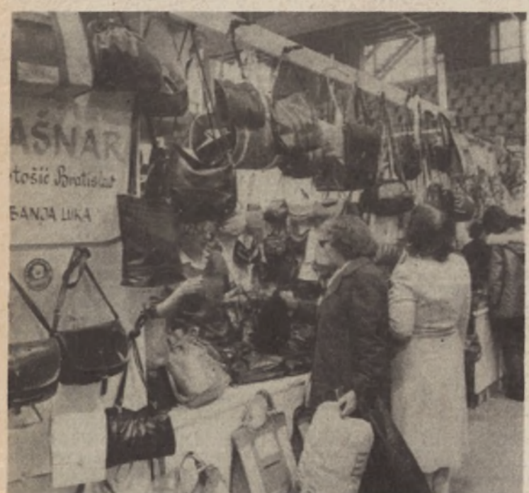
I tašne po povoljnim cijenama su među traženijom robom