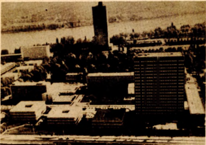
Bon: Sve više turista iz SR Njemačke želi u Jugoslaviju

●Minhenski ADAC, najmasovniji i najmoćniji auto-klub Evrope, dobijao je čak 46,5 odsto zahtjeva za informacije o Jugoslaviji više nego prošle godine. Slično je bilo i s drugim ustanovama vezanim za turizam.