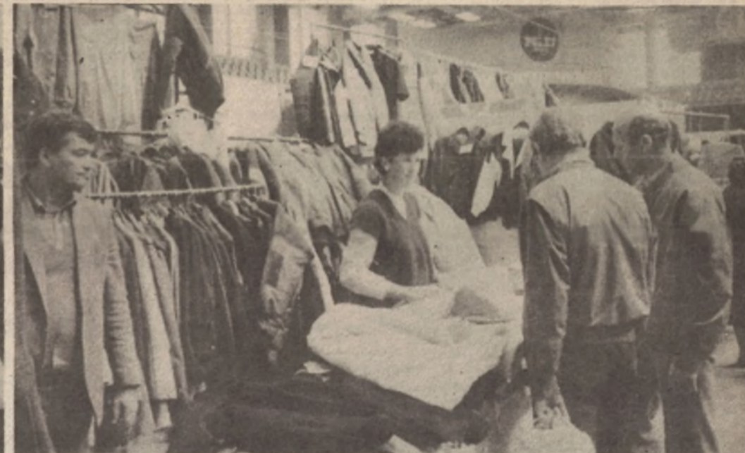
U ponudi „Blik-a“ iz Banjaluke dominirala je sezonska roba. Posebno su tražene tople zimske jakne