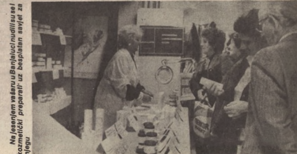
Na jesenjem vašaru u Banjaluci nudili su se i kozmetički preparati - uz besplatan savjet za njegu