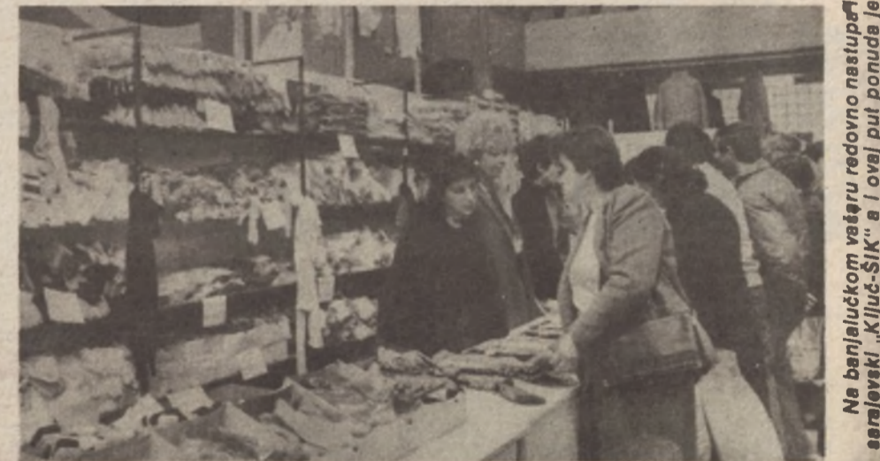
Na banjalučkom vašaru redovno nastupaju srazmjerni „Ključ-Sik“ a i ovaj put ponuda je veoma raznovrsna