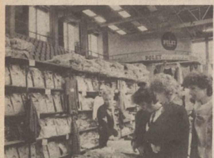
Popularne cijene muških košulja privukle su dosta kupaca i na štand „Sloge“ iz Beograda