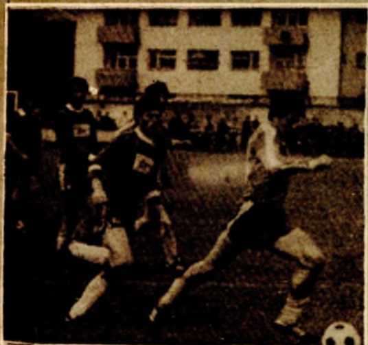
„Sa derbija u Sanskom Mostu: Podrgmeč je savladao Bratstvo sa 2:0, a najbolji pojedinac meča bio je Veselić (na snimku u prodoru)“