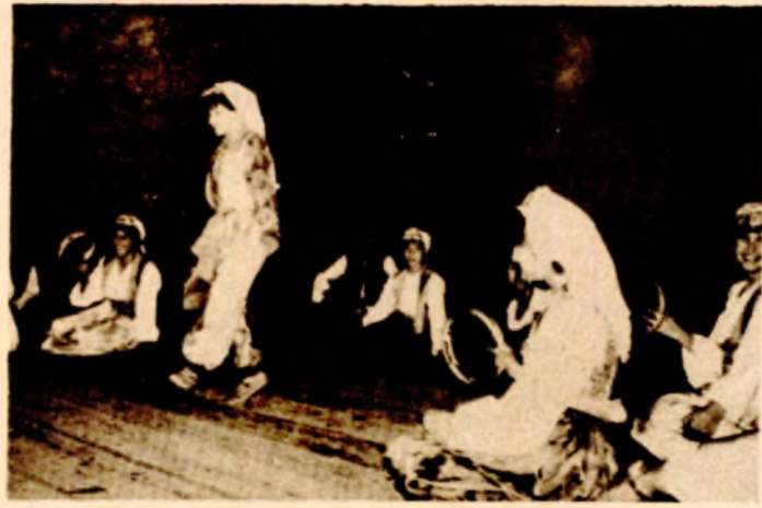
KUD — „Veseli brijeg“ iz Banjaluke

Raspravljajući o Smotri, predstavnici društava su na okruglom stolu govorili i o organizaciji, koja nije bila na zavidnom nivou. Priredbu su pratili problemi koji se većim angažovanjem prnjavorskih kulturnih poslenika si-