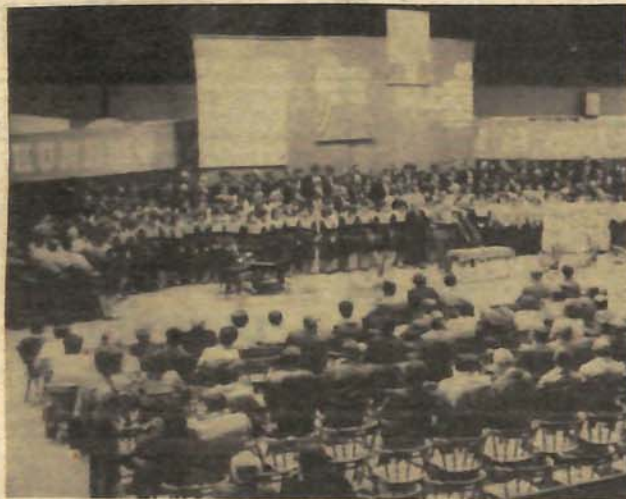
U 14 horova hiljadu izvođača: Učesnicima govorio Hamdija Pozderac, član Predsjedništva CK SKJ