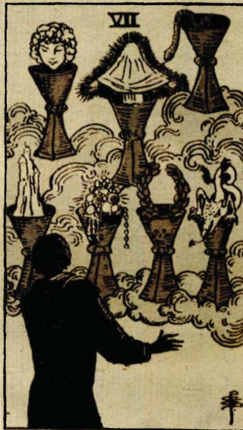
Prividan - uspjeh

Potencijal sedam (mnogostranost) i frekvencija Venere (produktivnost) čine osobe rođene u ovoj posljednjoj dekadi Škorprije, ljudima često zauzima sa mnogo poslova koje ne mogu završiti, a osnovna osobina Škorprije jest završiti sve započeto. I, upravo tu dolazi do konflikta - između pozitivnog stvaralačkog nagona (koji se rasipa) i želje za lijenošću i užicima. I dok je kod Škorprije šest osnovna težnja „biti mnogoputa na istom mjestu“ dotle Škorprije sedam jednostavno kažu „biti uvijek na drugom mjestu“