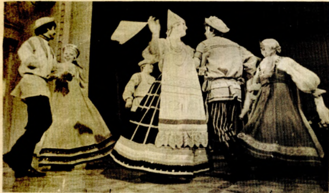
Po narodnom običaju - igra