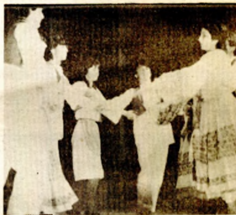
Amateri iz Humića — selo prihvatilo manifestaciju

Nedavno je opštinski Koordinacioni odbor manifestacije „Kultura u akciji na selu“ sumirao rezultate i ocijenio da su oni prevazišli očekivanja organizatora. U predtakmičenjima i u polufinalnim natjecanjima učestvovali takmičari iz 38 ključkih sela. Za to vrijeme održane su 22 izložbe predmeta kućne radinosti, likovnih i tehničkih radova učenika osnovnih škola, rasnih grla stoke, ovačkih pasa i sl. U kulturno—umjetničkom programu manifestacije učestvovali su 33 izvorne grupe, 22 sekcije, oko