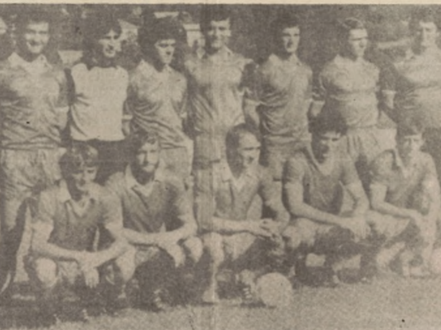
Odlučna igra u Banjaluci: Fudbaleri Borka iz Titovog Dvora

● Za titulu prvaka jeseni konkurencije pola Lige ● Bratstvo zasjelo na vrh, ali Berek je najprijetnije iznenađenje ● BSK zapao i krizu