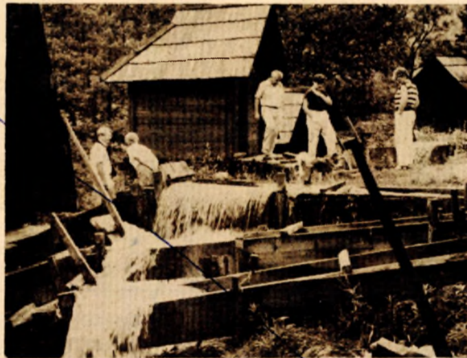
Prirodne ljepote, ali i turistička poslovnost: Jajčke vodone

U Jajcu, dakle, imaju sve preduslove za razvoj modernog turizma. Mogu praktično ponuditi sve za ugodan odmor i rasonodu gostiju. Zato i turistički radnici ovaj grad nazivaju kontinentalni Dubrovnik.