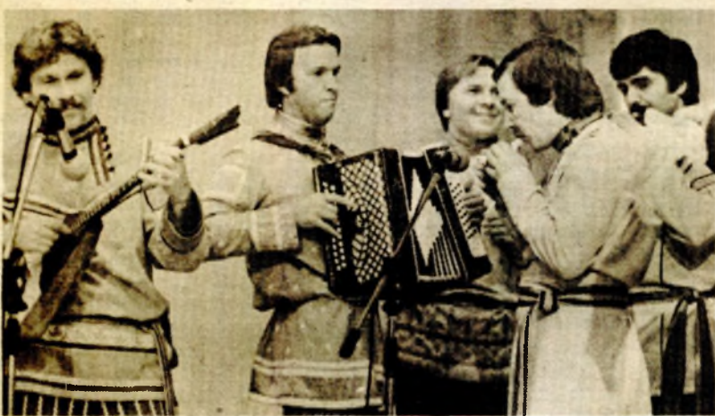
Bogatstvo instrumenata i zvukova

VENUS je, porimskoj mitologiji, bila boginja ljubavi i ljupkosti. Venus je bila žena Vulkanova, a mati Kupidonova. U njenu slavu stvarana su monumentalna umjetnička djela. Miloska Venera, veličanstveni mramorni kip, izrađen je u drugom vijeku prije nove ere, a otkopan je na ostrvu Milosu 1820. godine. Danas se čuva u pariskom Luvru. Medičije-va Venera najljepši je prikaz boginje Venere, jedno od najvećih vajarskih djela starog vijeka. Na-