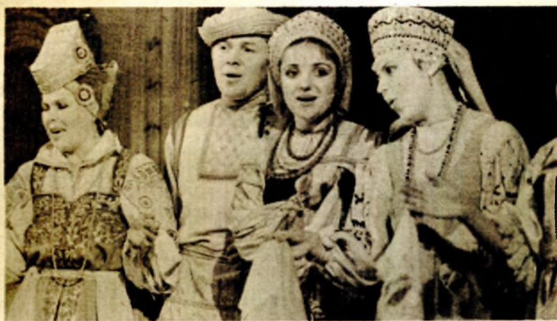
Pjesma naroda južne Rusije

Pred prepunim gledalištem velike sale banjalučkog Doma kulture u subotu je nastupio moskovski folklorni ansambl „Karagod“. Ovo uspješno narodno pjesništvo, igrana i instrumentalna kompozicija sjeverne i južne Rusije.