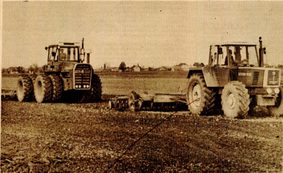
U Liječvu polju mehanizacija se bori sa suhom zemljom

BANJALUKA, 29. oktobra — Sjetva ozimih kultura u Bosanskoj krajini ušla je u drugi agrotehnički rok, ali još napreduje puževim korakom. Zasijano je samo 14.923 hektara pšenicom, što predstavlja 31,6 odsto od planiranih površina. Razlog sporosti sjetve je dobro poznat — suho vrijeme doprinijelo je da se zemlja stvrđne, pa mehanizacija nemože da obavi svoj dio posla.