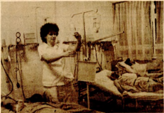
Детаљ са хирургије у Бањалуци: У првој републичкој клиници највише постеља за ову грану медицине

● Новим самодоприносом Сарајлије ће поред средстава за запошљавање издвојити и дио новца за стручне кадрове и опрему клиничког центра, првог у СР БиХ ● Укупна средства неопходна за овај пројекат износе око 11 милијарди и 700 милиона динара, а трећину би требало да обезбиједи Сарајлије самодоприносом ● Нови клинички центар уштедио би одлив средстава за лијечење у другим клиникама Југославије и Европе