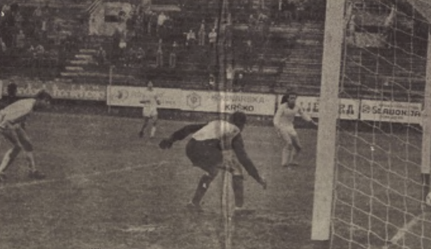
AUTOGOL — Pobjednika nedjeljnog dujia Borca i OFK Kikinde odlučio je centarhal gostiju Cvijan, koji je nesretno reagovao i loptu poslao u vlastitu mrežu. Na snimku - momenat kada Igrači Kikinde nemoćno posmatraju put lopte u mrežu