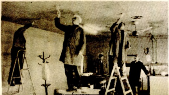
Penzioneri u akciji: uređenje prostorije mjesne zajednice

Aktivisti MZ Bulevar revolucije, zajedničkom akcijom počeli su uređivati objekat u kojem se nalaze prostorije, kao i okolni prostor mjesne zajednice.