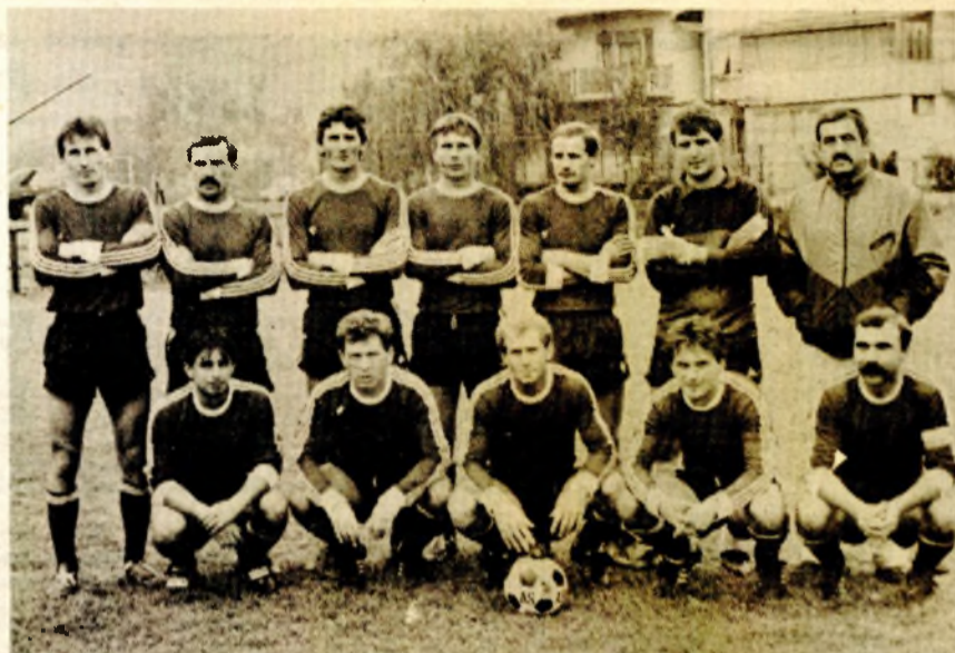
EKIPA BORCA (Bosanska Dubica): Vrjedna pobjeda na vrućem terenu u Sanskom Mostu

U drugom poluvremenu uz nekoliko izglednih prilika, stativu Bašića i šanse