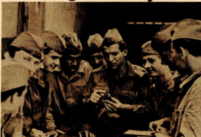
Na planu unutrašnjeg reda i discipline vojnici komunisti daju svoj puni doprinos

BANJALUKA, 3. novembra - Na sastanku Osnovne organizacije Saveza komunista u jedinici Ivana Kristića raspravljalo se o doprinosu članova SK i njihovom angažovanju na jačanju unutrašnjeg reda i discipline, te o nekim aspektima bezbjednosti i samozastite u jedinici.