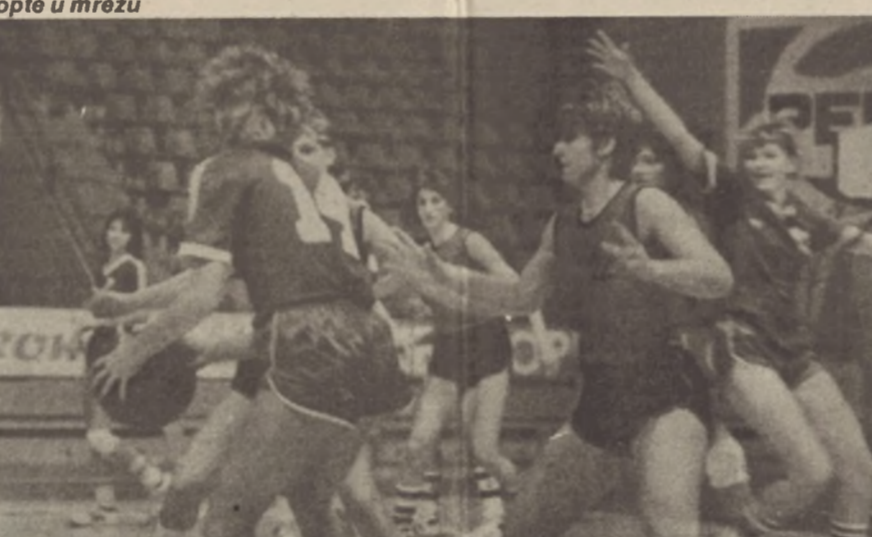
PODVIG — U izvanrednoj igri košarkašice Mladog Krajišnika savladale su renomiranog protivnika, tim Voždovac iz Beograda.

DERBI — Veliku pažnju ljubitelja fudbala u Banjaluci pobudio je MFL Banjaluka Napredak - Omarska koji je nakon odlične predstave zasluženo pripao domaćinu (4:3).