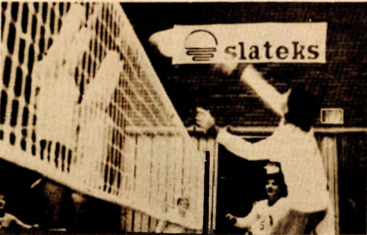
Odbojkašice Gimnazijalaca igraju sve bolje

GIMNAZIJALAC — MAJEVICA (Zabrada) 3:0 (15:3, 15:0, 15:6)