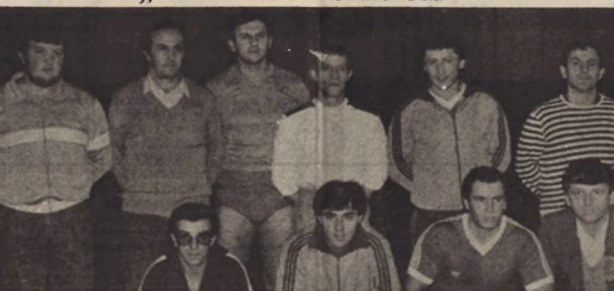
OPSTANAK - I pored poraza u susretu sa Herkulesom iz Bača dizači tegova banjalučanog Partizana uspjeli su sačuvati status prvligaša