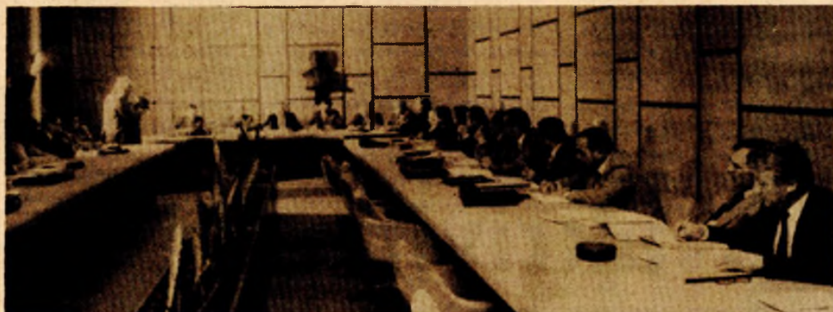
Na juče-rašnjeg sastanka

Ovo su samo neki od osnovnih akcenata sa da-