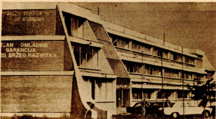
Zgrada Više tehničke škole

vezani za obrazovanje, nauku, kulturu i fizičku kulturu.