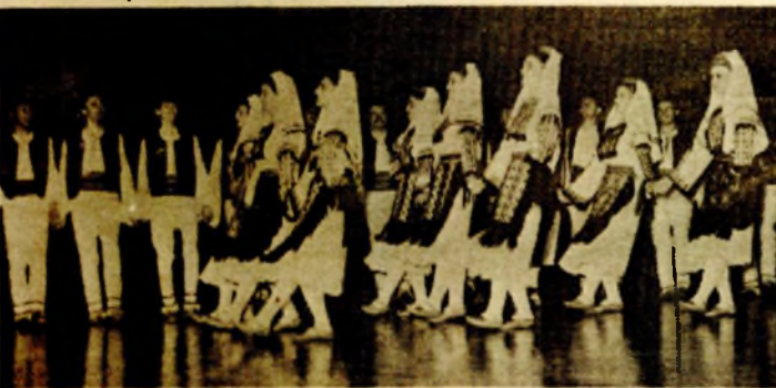
„Grmečke igre“ u izvođenju studentskog ansambala