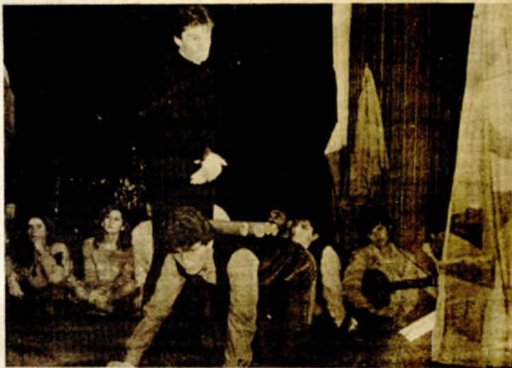
Sa predstave „Šumski car“ Studentskog pozorišta