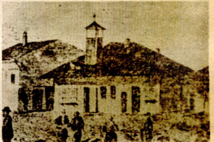
Osnovna škola u Jagodini koju je pohađao Sv. Marković

U osnovi srodan Černiševskom i ostalim ruskim revolucionarnim demokratama (Dobroljubovu, Pisarevu i dr.) bio je i poznati ruski intelektualac Hecren. Kao i Černiševski i Hecren je smatrao da feudalnu odnosno buržoasku državu treba ukinuti i uspostaviti federaciju samoupravnih opština. On je, takođe, propagirao agrarni socijalizam, posebno naglašavajući značaj prosvještavanja naroda.