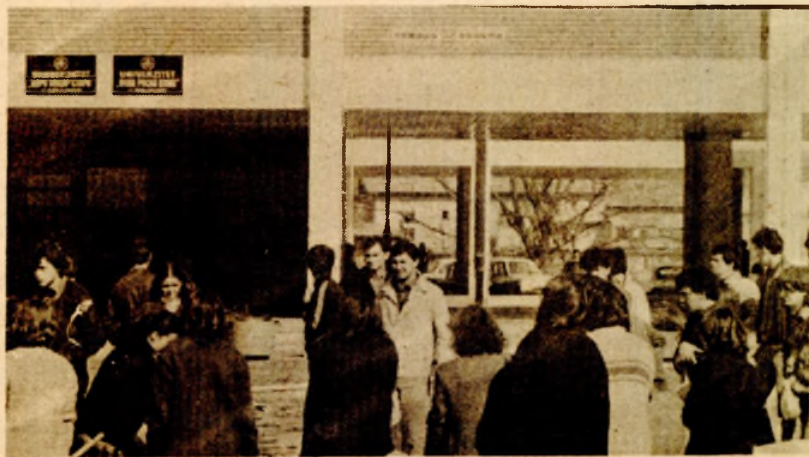
Iz Studentskog centra