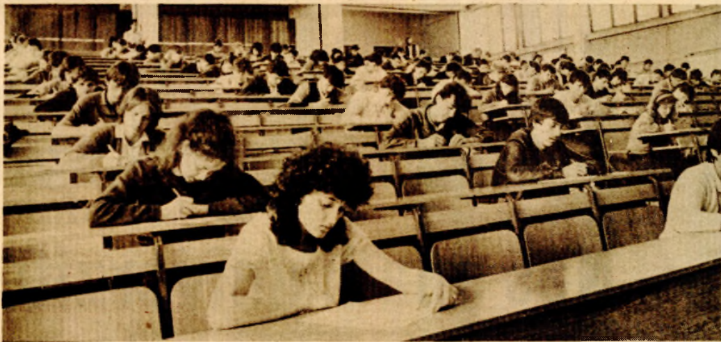
Pravni fakultet: sa prijemnog ispita

KAKO SU PROTEKLI UPISI U PRVU GODINU STUDIJA