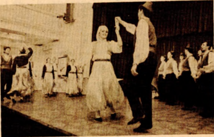
Sa otvaranja smotre - ansambl „Pelagić“

● U prvom programu ovogodišnje Smotre kulturno-umjetničkog stvaralaštva, pored Tamburaškog orkestra, učestvovali Mješoviti hor „Pelagić“ i folklorni ansambl ● Ni Društvo „Pelagić“, a ni festival banjalučkih amatera, u kojem će učestvovati oko hiljadu članova, ne zaslužuje malobrojnu publiku koja ne umije da cijeni osnovne zadatke amaterskog rada i kulturnog ponašanja