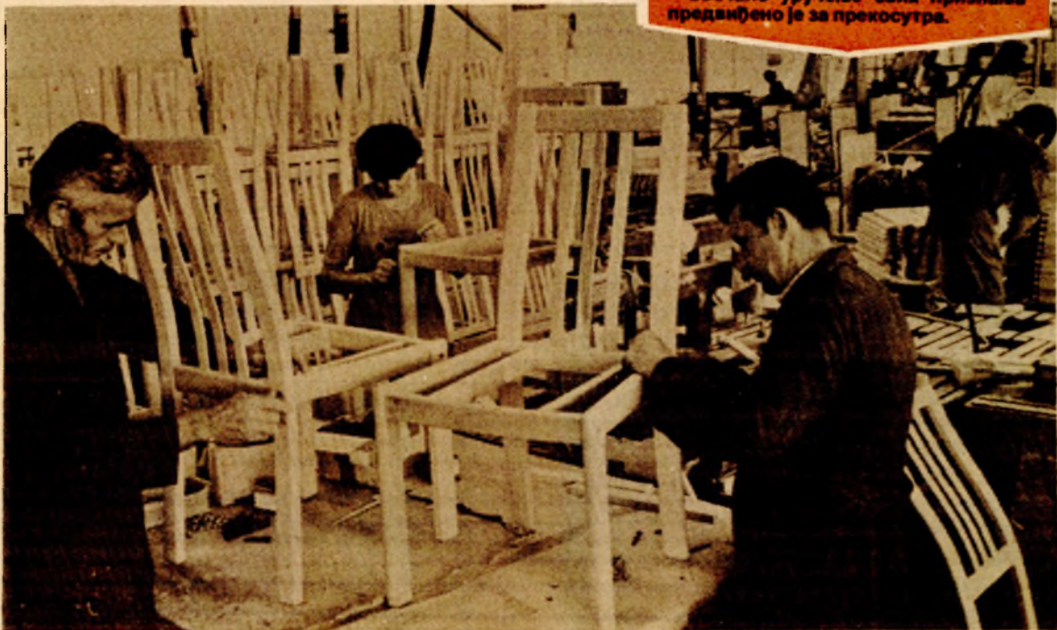
Већ традиционално међу најбољим: детаљ из „Врбасове“ производње намјештаја

Од планираних 175 милијарди динара за инвестиције у индустрији, највећи дио улагања биће усмјерен у електропривреду, производњу угља, црну металургију и метални комплекс.