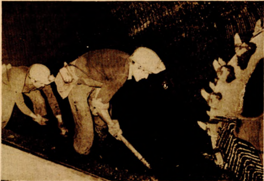
Рудари „Каменграда“ поставили нови босанскохерцеговачки рекорд у производњи угља

САНСКИ МОСТ, 13. новембра - Готово је сигурно да ће ове године рудари Рудника Црног угља „Каменград“ код Санског Моста произвести 420 хиљада тона све тражењег „црног злата“ и тиме остварити највећу производњу у више од 60 година дугој историји овог јединог крајњског рудника са јамском експлоатацијом. На ово наводи и чињеница да су гарави комарати у протеклим десет мјесеци произвели 343.923 тоне угља, што је 60 одсто више од плана. Они су само у октобру произвели 60.931 тону угља и план надмашили чак за 53 одсто, чиме су поставили нови босанскохерцеговачки рекорд у једномјесечној производњи угља.