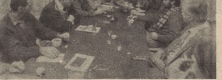
FK „BORAC“ u „GLASU“

U gotovo dvocislovnim razgovoru izmjenjena su mišljenja i iskustva o današnjoj saradnji i jednoglasno je zaključeno da ona i ubuduće neće izostati.