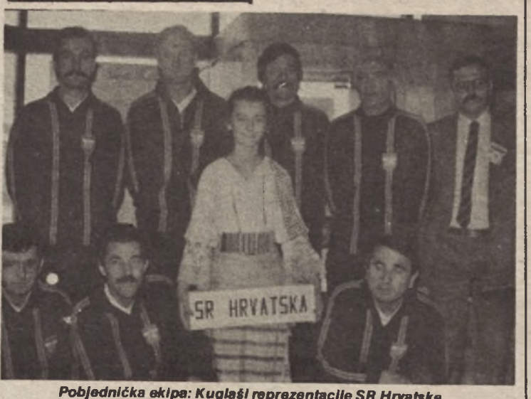
Pobjednička ekipa: Kuglaši reprezentacije SR Hrvatske