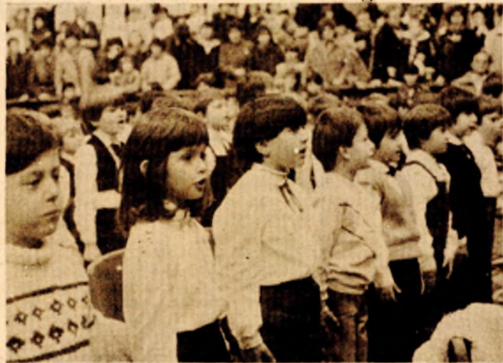
Ozbljni i ponosni: „Danas, kada postajem pionir...“

Djevojčice iz vrtića banjalučkog Centra za predškolsko vaspitanje i obrazovanje su ritmičkom vježbom „Djeca su ukras svijeta“ čestitala prvacima koji su postali pioniri