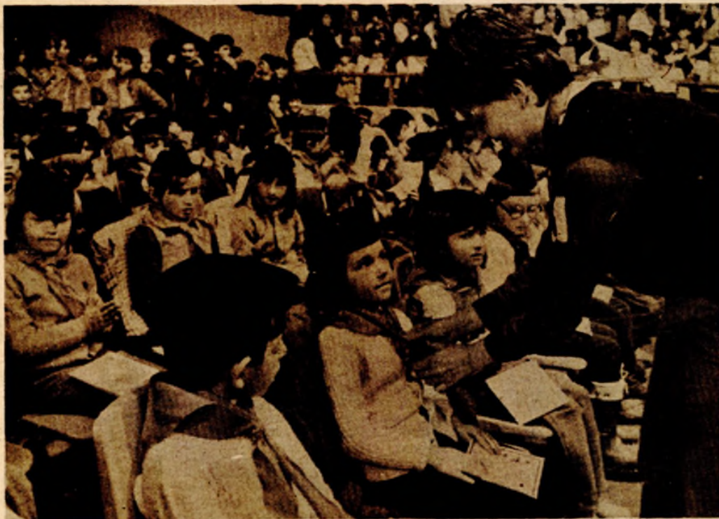
Crvenu maramu dobilo je 2.900 banjalučkih prvacića