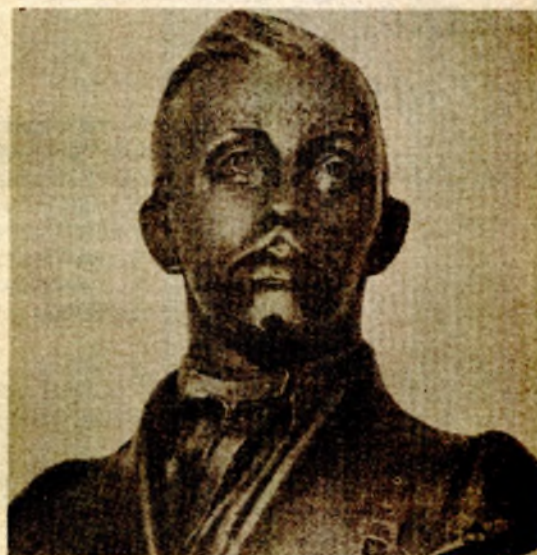
Svetozar Marković, rad vajara Nebojše Mitrića (Istorijski muzej Srbije)

● Marković je do kraja razgolito političke i etičke poglede liberala ● Najviše povjerenje Marković je, cjelovito uzevši, imao u omladinu