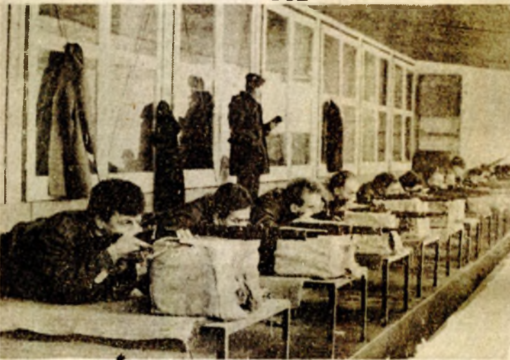
Juče su se u vještini gadanja okušale rezervna vojna starješina