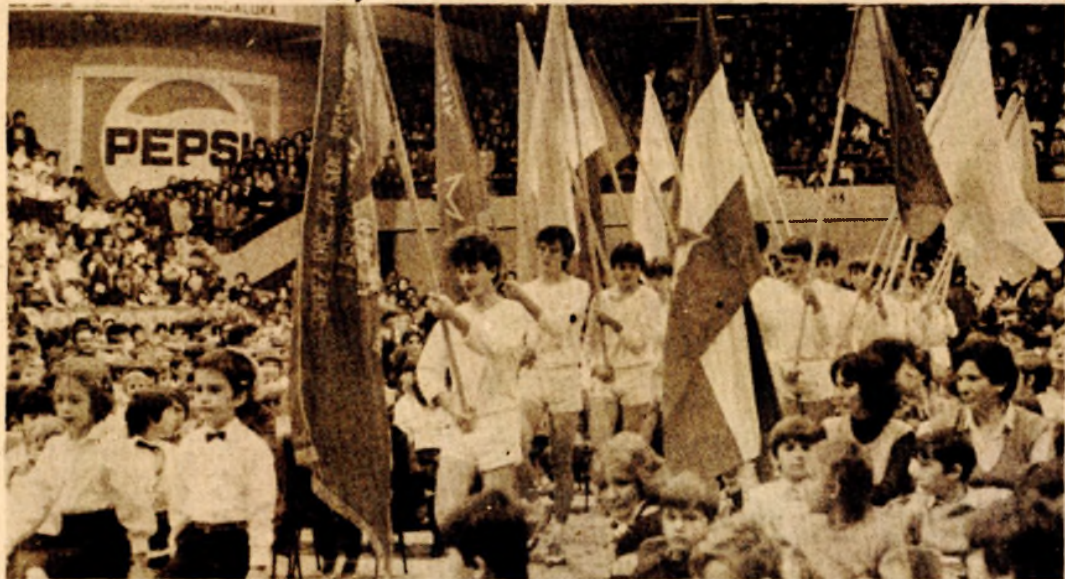
Zastave pred kojima su se novi pioniri zakleli, časno su nosili učenici Osnovne škole „Jvan Goran Kovačić“