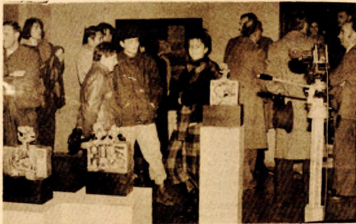
Stotinu eksponata, i još više pitanja: gdje su granice umjetnosti

gosti iz cijele zemlje vidjeli — zanimljiv događaj koji prati stotinu pitanja. Odgovore će dati likovna kritika, a svako za sebe, onaj koji oku i uhu najviše godi. Sljedeći mjesec dana pred publikom je izložba koja lako