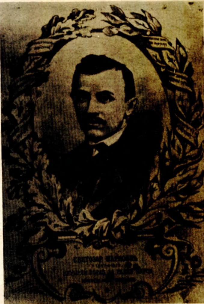
Naslovna strana publikacije posvećeni uspomeni Svetozara Markovića

Snažan uticaj ruskih revolucionarnih demokrata na Markovića dolazio je iz dopisa u dopis do sve jačeg izražaja. U pismu pod naslovom Literaturni večer on se već zalaže za književnost koja će široko i snažno zahvatiti narod i samim tim odbaciti trulu romantiku, plitku satiru i sl. „Nju samu (takvu književnost, A. N.) - kaže on misleći na romantizam i plitku satiru - već su ismijali i namenili ljudi mlade ruske partije, kao Dobroljubav, Černiševski, i dr. jer je ona suviše majušna i šeptrljanska, pa udara na zlopotrebe pojedinih klasa, na iskvarenost pojedinih klasa, a nema hrabrosti da učari na sa-