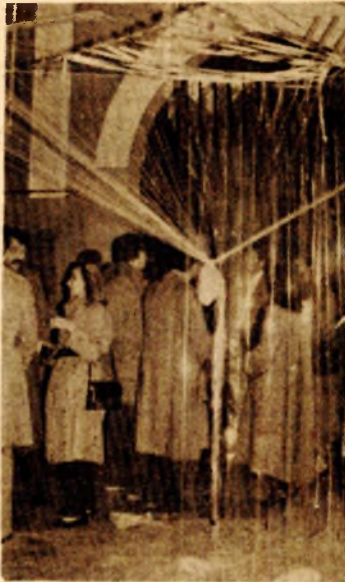
Na ulazu u Galeriju - baldahin od selotejpa

nije naodmet osjetiti. Sve u svemu - sam čin otvaranja, obogaćen onim što su Banjalučani i