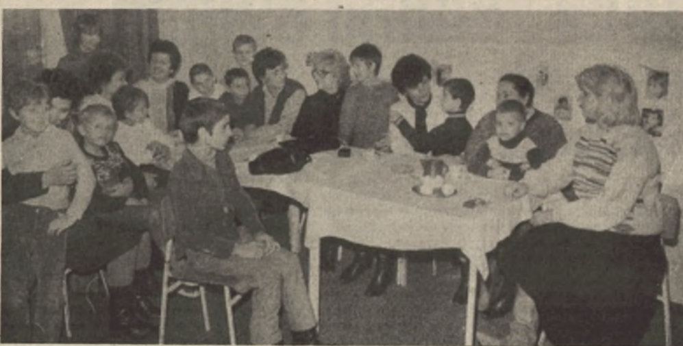
Draga srećanja: Uskoro će mališani biti gosti porodica u Budžaku