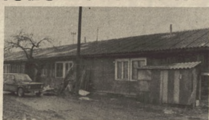
Iz neuslovnih baraka u nove stanove: Kada?

● Odlučnije će se raditi na rješavanju stambenih problema porodica u privremenoj smještaju ● Svi legalni korisnici dobice stanove u dogledno vrijeme