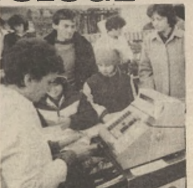
Iz „Konzumove“ samoposługe br. 15

Juče su u naselju Karlo Rojca otvorene dvije nove samoposługe. „Konzumova“ prodavnica broj 15 ima 100 kvadratnih metara poslovnog prostora, a u njoj sada radi 5 trgovaca. Ovo je treća samoposługa koju je OOUR „Konzum“ otvorio ove godine, a na svečanosti je istaknuto da je u 1985. godini ovaj kolektiv zaposlio 137 novih radnika.