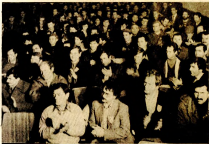
Sa svečane sjednice Zbora radnika

Od nekoliko rekonstrukcija i proširenja, najznačajnije je ono iz 1973. godine kada je Tvornica poljoprivrednih strojeva ušla u veliku porodicu rudara, metalurga i metaloprerađivača, u Rudarsko-metalurški kombinat Zenica. Izgrađena je nova hala, kotlovnica i