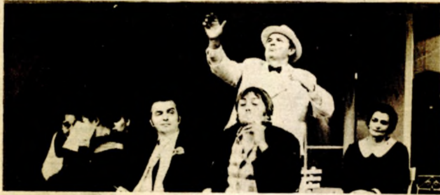
Сцена из Чеховљевог „Галеба“

СИНОФ У НАРОДНОМ ПОЗОРИШТУ БОСАНСКЕ КРАЈИНЕ У БАЊАЛУЦИ