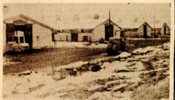
U štalama se nalazi već 600 junadi

Izgradnja farme za dvije hiljade grla u turnusu na principima zajedničkog ulaganja i zajedničkog nošenja cjelokupne proizvodnje, s efektom 50:50 s Gavrilovićem za bosanskonovsku komunu znači dalji veliki korak u razvoju organizovane stočarske, a i ratarske proizvodnje. Uz farmu za tov junadi obrazovaće se i ratarske farme, gdje će se uz 158 hektara zadrugnog zemljišta i tridesetak u kooperaciji pripremiti silaža. Tim će se povećati poljoprivredna proizvodnja, ali i smanjiti broj nezaposlenih u bosanskonovskoj komunici. Na farmi će raditi 14 radnika, a planiran je ukupan godišnji prihod od čak 921 milion dinara. Pored toga, značajno je napomenuti da će farmu teladima