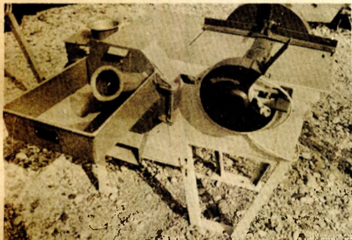
Iz raznovrsnog proizvodnog programa: univerzalni mlin čekićar koji ima devet operacija