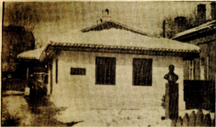
Kuća u kojoj je jedno vrijeme stanovao Svetozar Marković (danas Muzej Svetozara Markovića)