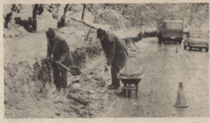
Usamljeni komunalci čine što mogu: Ulicom Danka Mitrova vozači opreznije

● Obrušavanjem terena došlo bi do potpunog prekida teretnog saobraćaja ● Inspekcija nemoćna da prisili SIZ magistralnih puteva da preuzme svoje obaveze