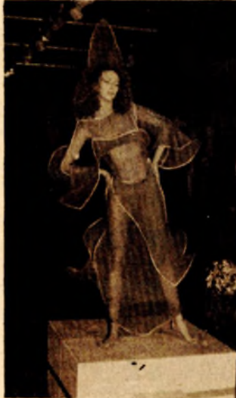
Anti-moda preskače decenije

nije naodmet osjetiti. Sve u svemu - sam čin otvaranja, obogaćen onim što su Banjalučani i