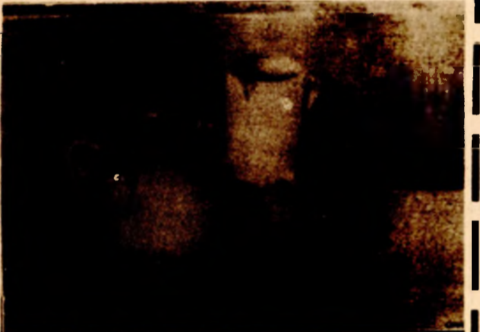
Sulejman Čufurović, mrtva priroda