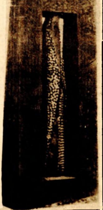
Dušan Ožamonja: Skulptura VIII. drvo, metal