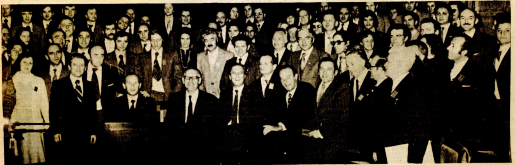
Na konstituirajuće sjednici Skupštine Univerziteta u Banjaluci, 7. novembra 1975. godine

Ili, kako je to još prije 35 godina vizionarski govorio Đuro Pucar Stari bliski Titov saborac, narodni heroj i junak socijalističkog rada, čovjek čije ime s ponosom nosi naš univerzitet već šest godina (13. decembra 1979. godine Univerzitet u Banjaluci je dobio ime „Đuro Pucar Stari“), ističući izuzetnu ulogu nauke kao oružja radničke klase u ovladavanju prirodnim bogatstvima i društvenim odnosima.