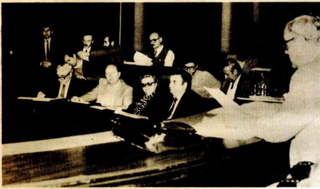
Sa sjednice Skupštine Univerziteta