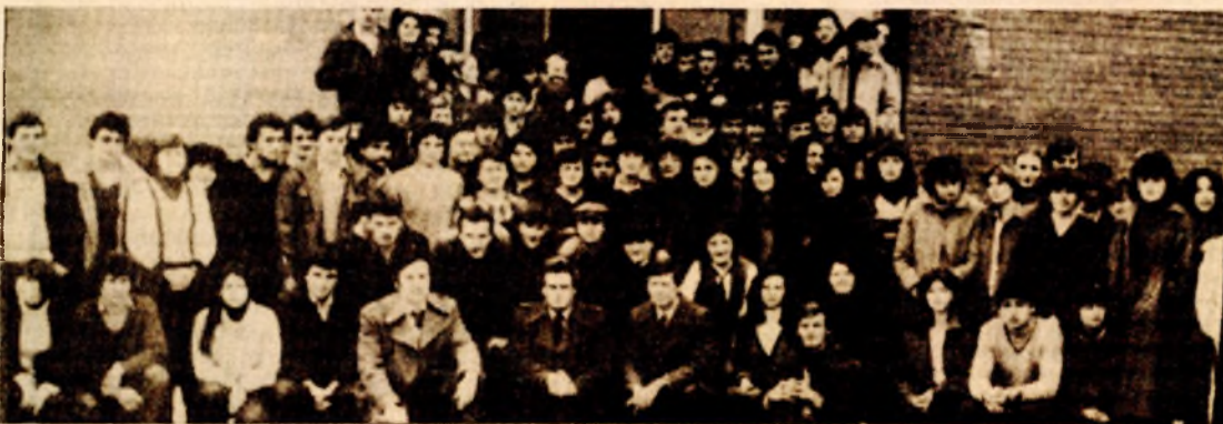
Prva generacija Više ekonomske škole

Na Višoj ekonomskoj školi u Bihacu, koja postoji već šest godina, u toku je transformacija ove visokoškolske organizacije, kako bi već od naredne školske godine počela da djeluje kao škola za osposobljavanje kadrova finansijsko-računovodstvenog smjera, jedne više škole tog tipa u Republici