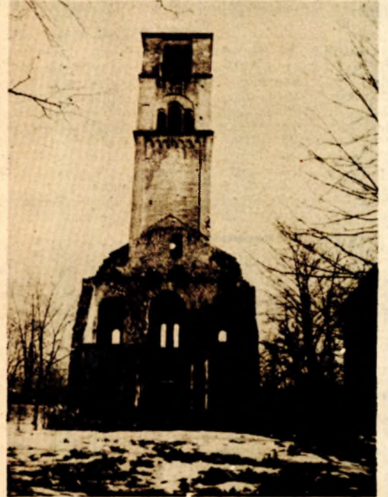
Kapetanova kula - izložbeni prostor Muzeja „Pounje“

Već tradicionalni susret arhivskih radnika regionalnih arhiva iz Tuzle, Doboja i Banjaluke počinju danas u Tuzli, a banjalučki arhivari učestvuju na ovom susretu. J. P.