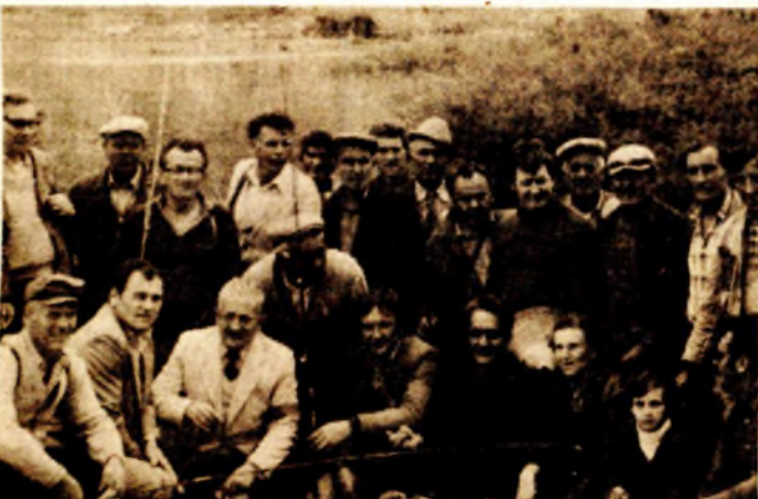
Članovi USR „UNA“ Bihac