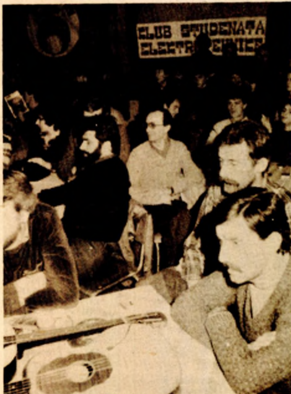
Iz Kluba studenata elektrotehnike