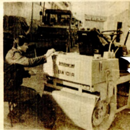
„Jelšingrad“: „Hala“ i na otvorenom

Nema sumnje, dakle, da je Univerzitet opravdao svoje postojanje, a da pred njim sada stoji jači korak ka udruženom radu. Dosadašnja iskustva sa ad hoc saradnjom nisu loša, ali je sigurno da samo neka druga rješenja (poput samoupravnih sporazuma) mogu dovesti do trajnih rezultata i dići saradnju na nivo kolektiva, a ne pojedinca, kao što je to bilo do sada.