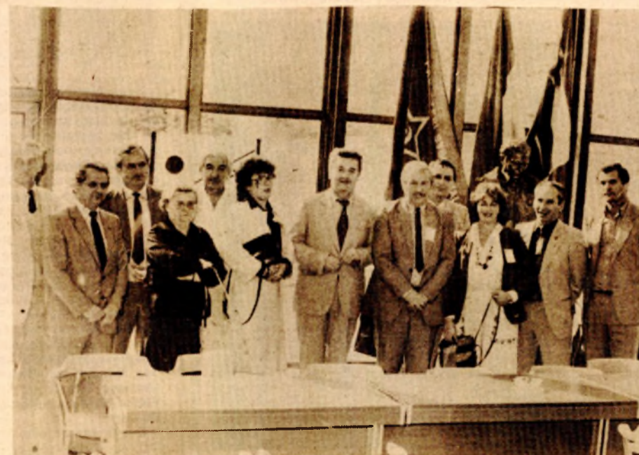
Na svečanosti otvaranja Univerzitetske biblioteke „Petar Kočić“

kalno i hitno mijenjati odnose u slobodnoj razmjeni rada u ovoj oblasti. Nužno će biti napustiti linearnu restriktivnu ekonomsku politiku u zajedničkoj i opštoj potrošnji, jer se njome ne može postići dalji razvoj nauke i obrazovanja. Nauci i obrazovanju morase dati i u ovim otežanim uslovima drugačiji tretman i učiniti ih odgovornim za rezultate rada