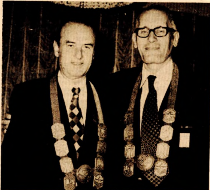
Dr Dragomir Malčić, prvi rektor Univerziteta u Banjaluci (desno) u društvu s dr J. Besarevićem, tadašnjim rektorom Sarajevskog univerziteta

Ova i druga pitanja trebalo bi što prije riješiti. Preduslov toga je kompletno i pravilno sagledavanje potrebe Univerziteta i njegovih članica, te adekvatno finansiranje njihovog rada. Upravo kada se radi o ovom posljednjem nismo do sada imali najstrebijarješnja, pa jeto sigurno jedan od prioritarnih zadataka. Vjerujemo da ćemo uz pomoć šire zajednice, riješiti ove probleme i tako stvoriti uslove za dalji, još uspješniji rad.