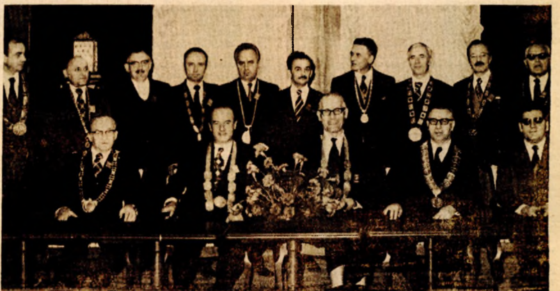
Rektori Jugoslovenskih univerziteta na svečanosti u Banjaluci 7. novembra 1975. povodom osnivanja krajiškog Univerziteta

(Na svečanoj sjednici Skupštine Univerziteta povodom usvajanja odluke o davanju imena Univerziteta „Duro Pucar Stari“ u Banjaluci)