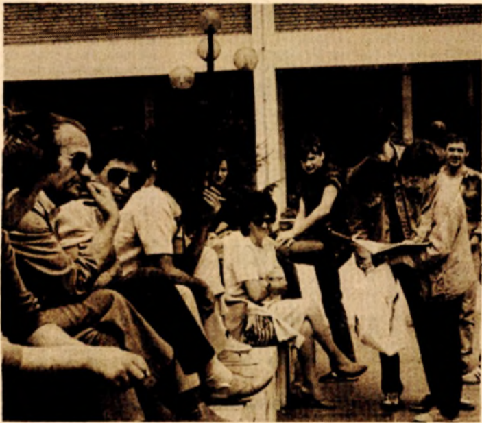
UNIVERZITETSKI CENTAR: U trenutku predaha

Uz puno razumijevanje nastavnika i studenata Medicinskog fakulteta za sve ekonomske teškoće u društvu, smatramo da ni na Univerzitetu ni u organima društvenopolitičke zajednice nije posvećeno dovoljno pažnje rješavanju smještaja prve dvije godine studija, što direktno indirektno usporava i kadrovske