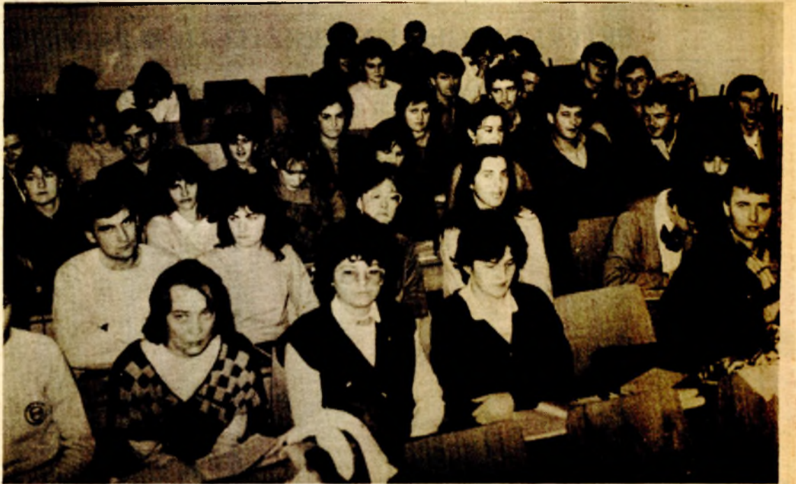
Studenti Pravnog fakulteta na nastavi

— Otvaranje Medicinskog fakulteta u Banjaluci prije šest godina svakako da ima svoje opravdanje. Doprinijelo je to značajnijem jačanju Univerziteta, a Banjaluci i okolini, u kojima se do tada osjećao nedostatak ljekara, omogućilo rješavanje ovog velikog problema. Studenti medicine, za razliku od kolega sa Ekonomskog i Pravnog fakulteta, sretni su što će, kad završe fakultet, imati priliku da se brzo zaposle. Mislim da bi značajnije korake trebalo poduzeti na drugim fakultetima koji školuju kadar za koji se zaposlenje teško nalazi. U tom smislu bi Univerzitet u budućnosti trebalo nešto da izmijeni.