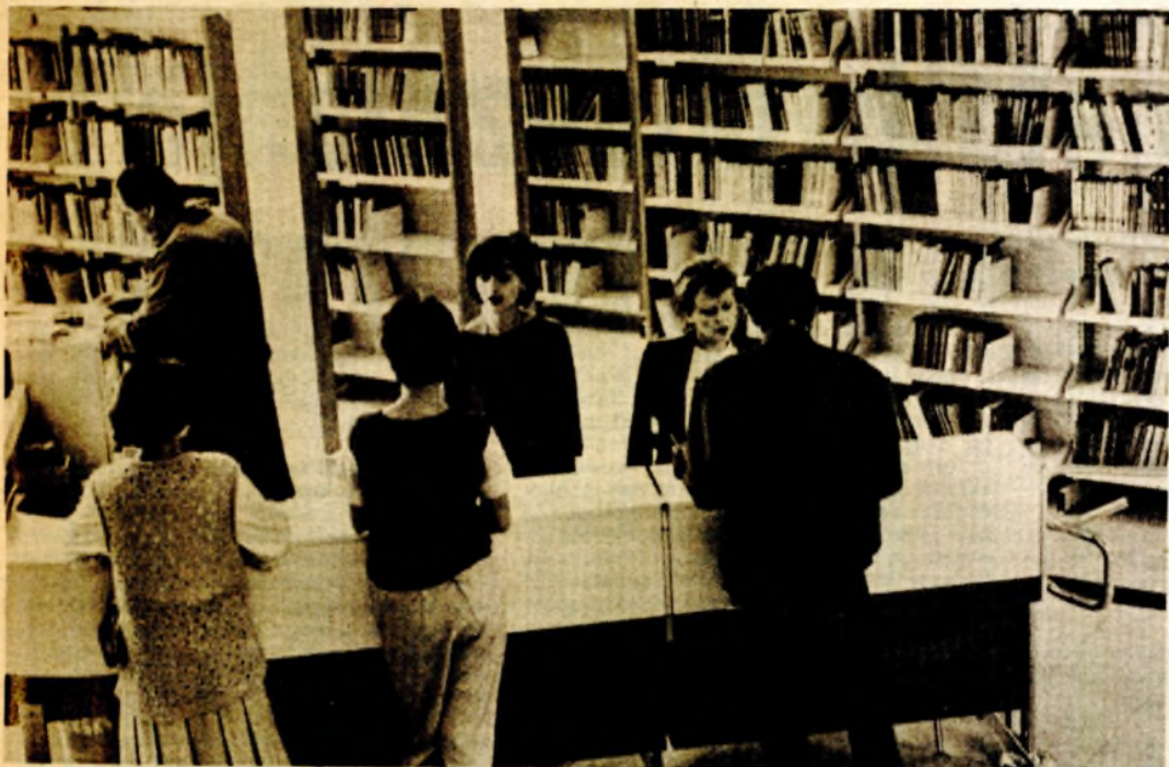
Sve više stručnih publikacija: Iz narodne i univerzitetske biblioteke „Petar Kočić“