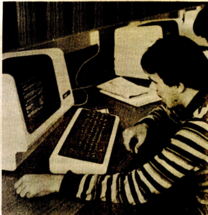
Elektrotehnički fakultet: praktičan rad sa kompjuterima