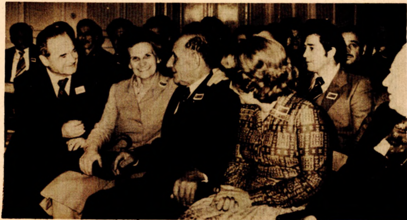
Duro Pucar Stari na svečanosti otvaranja Univerziteta u Banjaluci