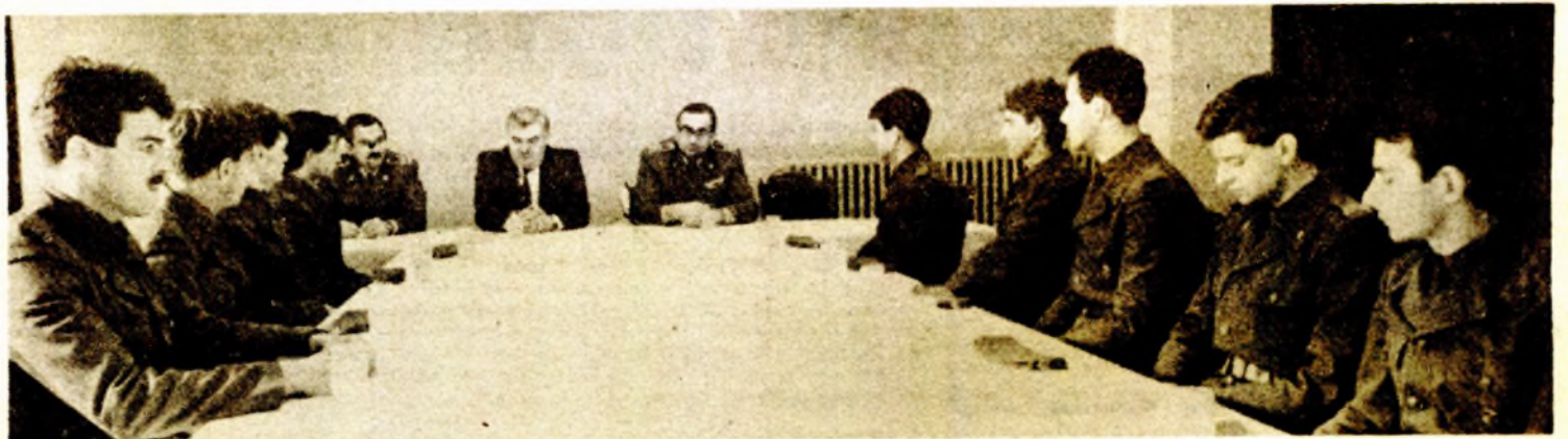
Značka za postignute rezultate u radu i ponašanju