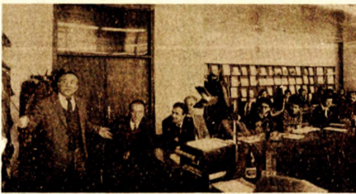
Da li rad treba tretirati kao troškove - sa savjetovanja

dualne raspodjele. U našim radnim procesima situacija u pogledu stvaralaštva na radu je bitno lošija nego u Japanu (koji je potome prvi u svijetu), a u Evropi se možemo porediti jedino sa Albanijom i Portugalijom. Posljednji smo po broju pronalazaka, što pokazuje obim stvaralaštva u radu, a posljednji po broju inovacija u radnim procesima. Kao dobar primjer, ali i izuzetak, je mariborski TAM sa 36 prijedloga na sto radnika godišnje. Zašto i kod drugih nije tako, vjerovatno su uzrokom prepreke koje navodi i prof. Jurančić - opšta društvena klima, nepogodna za podsticanje stvaralaštva, kao i nedovoljan interes za inoviranje radnih procesa u organizacijama udruženog rada.