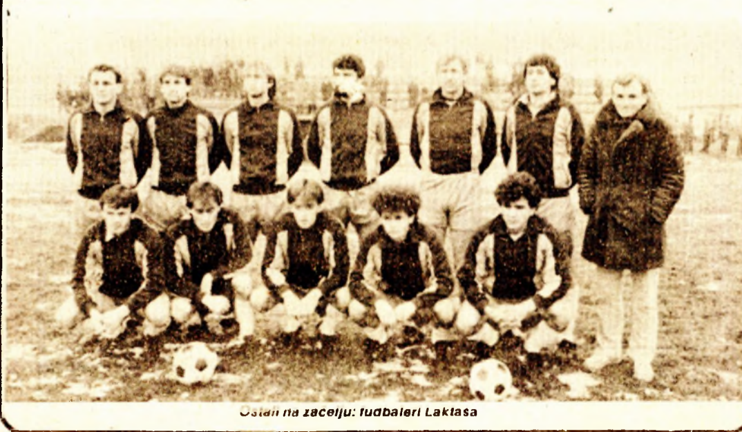
Ustan na zeciju: fudbaleri Laktaša