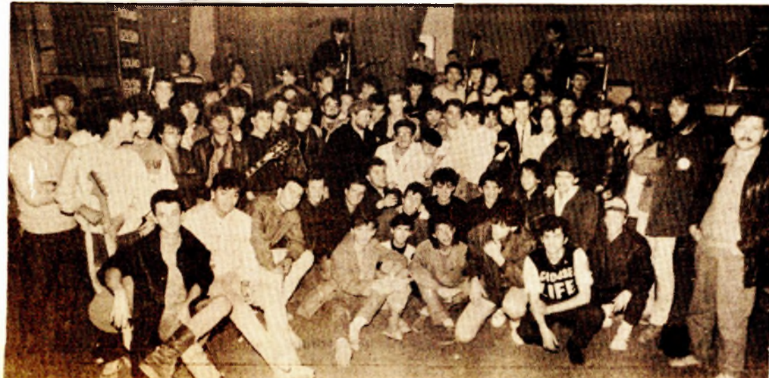
Nastupilo je 26 grupa - više od stotinu rokera sviralo je u „Mejdanu“

Specijalna nagrada lista „Glas“ za najbolji ukupan dojam pripala je mariborskoj grupi „Enola gay“, a banjalučki „Javni poziv“ je po ocjeni žirija imao najbolji scenski nastup na SMOTRI. Nastupilo je 26 grupa iz cijele Jugoslavije. D. R.