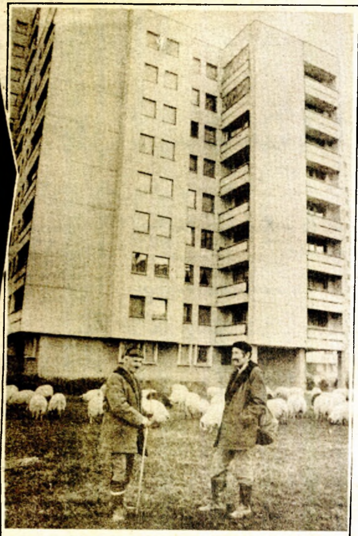
NA SOVJETSKOJ FARMI