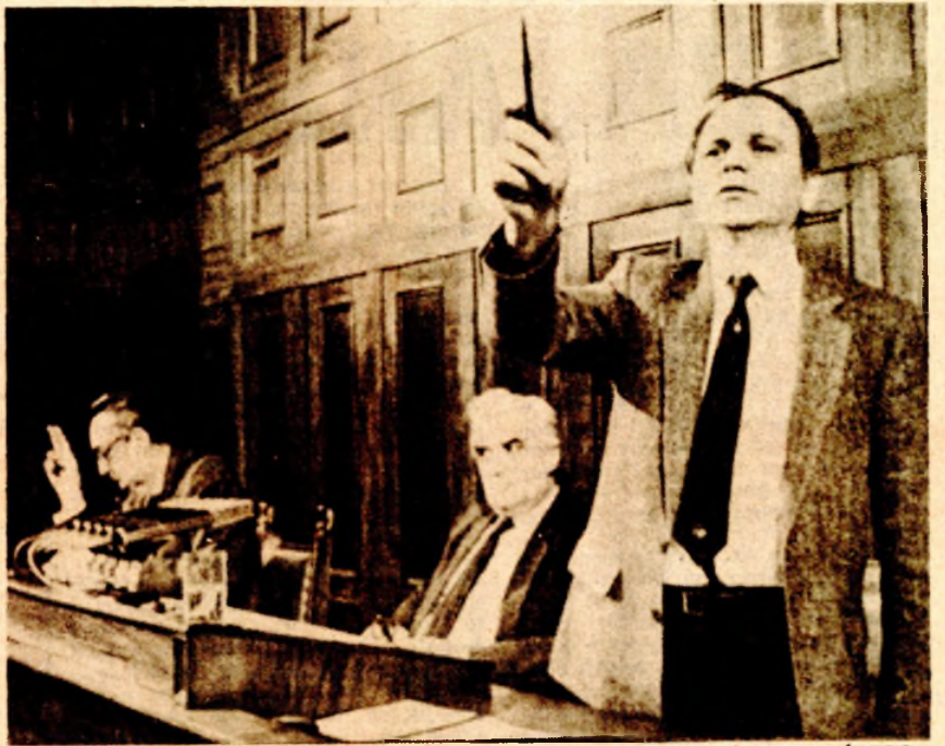
Sekretar Saveznog vijeća prebrojava glasove delegata za vrijeme usvajanja novog zakona o osnovama bankarskog i kreditnog sistema

BANJALUKA, četvrtak, 19. decembra 1985. Broj 4588, Godina XLII, Cijena 40 dinara