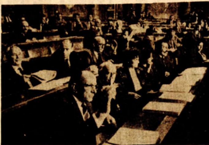
Delegati Saveznog vijeća Skupštine SFRJ

Sve radne organizacije s gubicima ili koje nisu blagovremeno otplatile uzete investicione zajmove, neće moći da podižu kredite za nova ulaganja. To im onemogućava danas usvojeni Zakon o posebnim uslovima za davanje i korišćenje kredita i garancija za investicije.