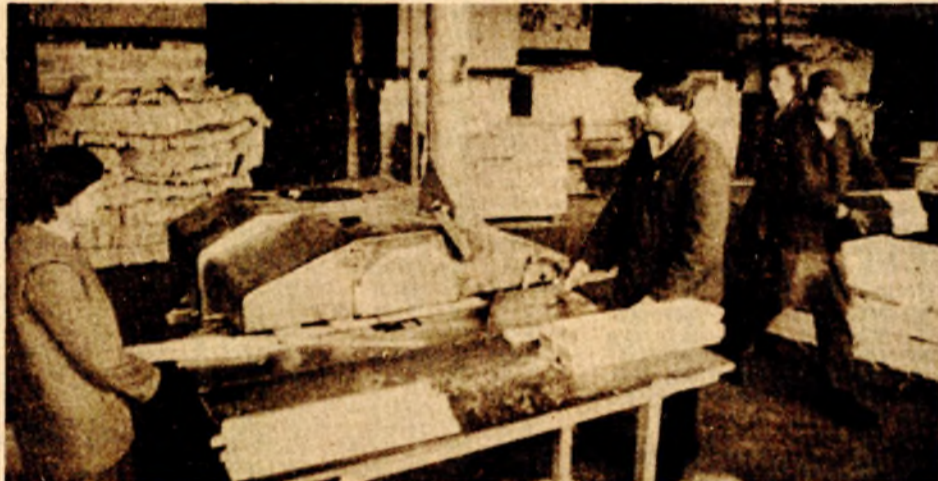
Od deset zaradenih dolara samo jedan za potrebe uvoza: iz pogona „Vrbasa“

- U razvoju ekonomskih odnosa s inostranstvom nužno se moralo pristupiti određenim izmjenama, upravo ovakvim, koje prolaze iz novog deviznog zakona. „Vrbasa“ je najvećim dijelom proizvođač finalnih proizvoda i u mogućnosti je da svoju produkciju u potpunosti usmjeri ka svjetskom tržištu. S obzirom na to da će novi zakon direktno pod-