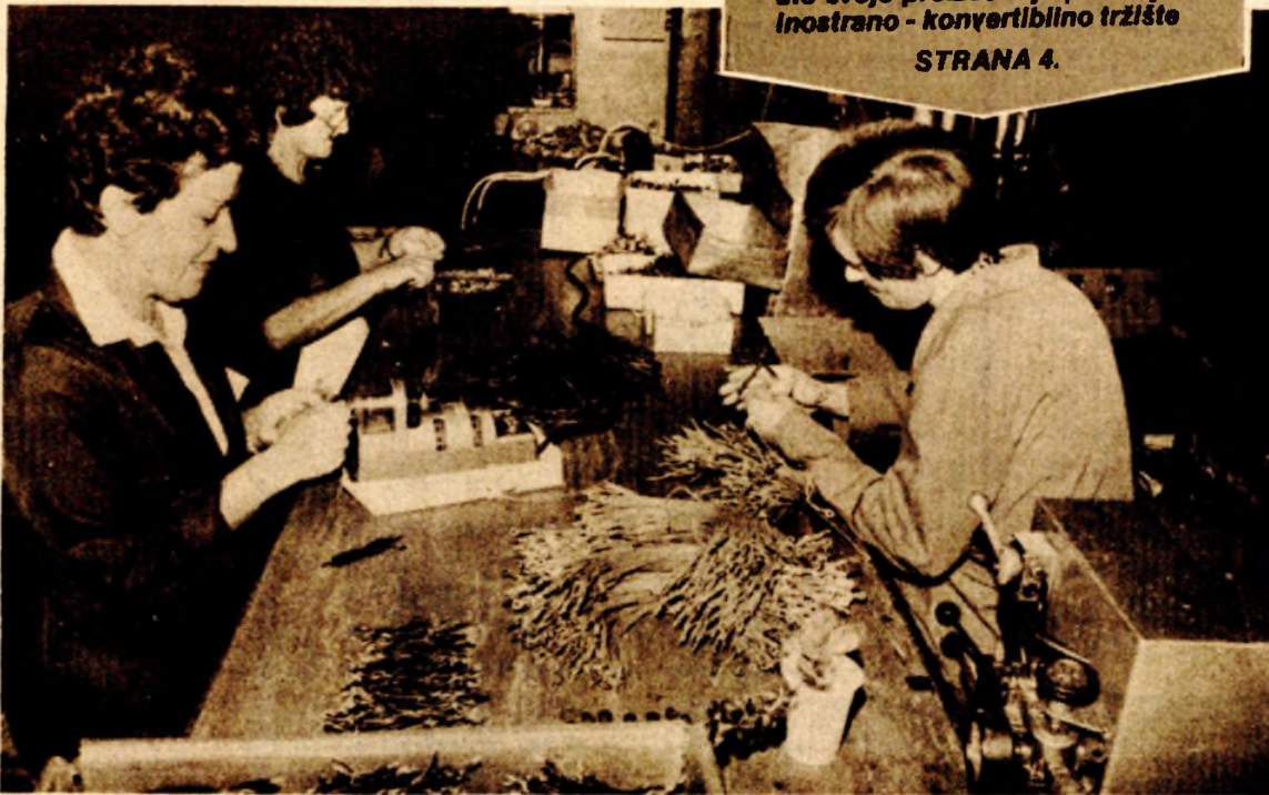
Dio proizvoda „Čajavčeve“ „Elektromehanike“ takođe ide na inostrano tržište