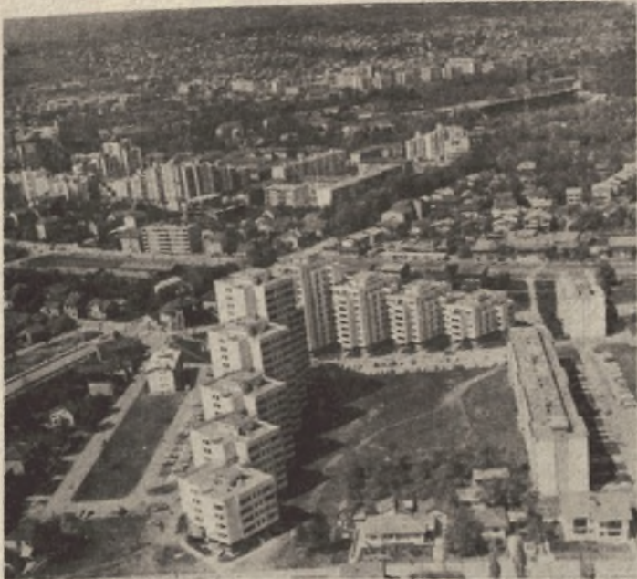
U stambenim banjalučkim naseljima krije se mnogo neiskorištenog prostora

Zajedničke prostorije daju se OOUR-ima koji imaju više od 20 odsto radnika sa neriješenim stambenim pitanjem u odnosu na ukupan broj zaposlenih, te koje su ostvarile niži prosječan lični dohodak po radniku od prosječnog osiavrenog ličnog dohotka u privrednoj opštini Banjaluka za prethodnu godinu. Ispunjavajući ove kriterije, po posebnom sistemu bodovanja, ustanovile se li-