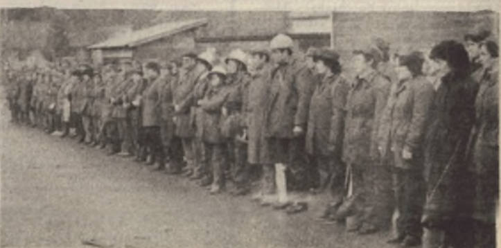
Pripadnici civilne zaštite u stroju