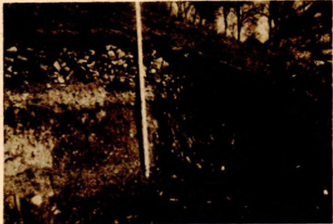
Dalja istraživanja traže zajedničku akciju

prostor sjeverozapadne Bosne smatralo se da nije „teren“ neolitske civilizacije.