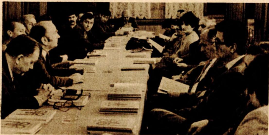
Sa današnje sjednice Savjeta „Puteva“: nastaviti izuzetnu tradiciju