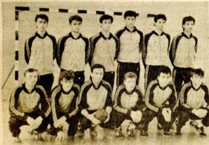
Teška grupa, malo koncentracije - ekipa „Rade Ličina“

Rješenje prošlog zadatka: 1. T b8 Kb8 2. De5 i crni je predao, jer nakon 2... fe5 slijedi 3. T f8 sa matom.