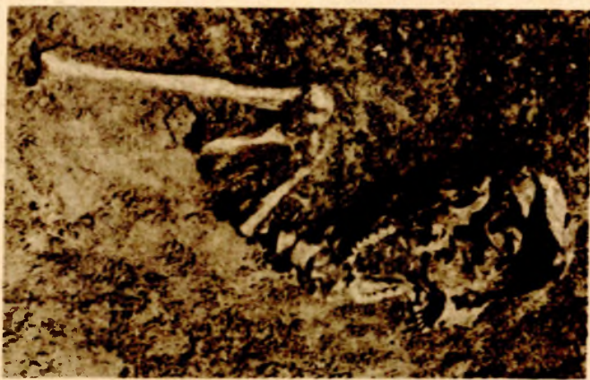
Tragovi neolitske civilizacije - ljudski kostur

Da bi se dala potpuna slika ovog, bez sumnje, senzacionalnog lokaliteta, potrebno je izvršiti sistematsko iskopavanje, a za to je neophodna podrška društvene zajednice. Za ovaj