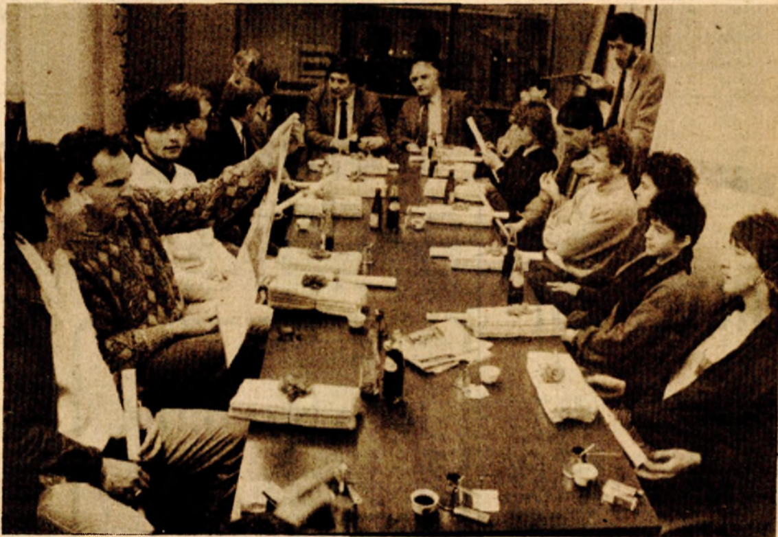
Prijem za najbolje sportiste