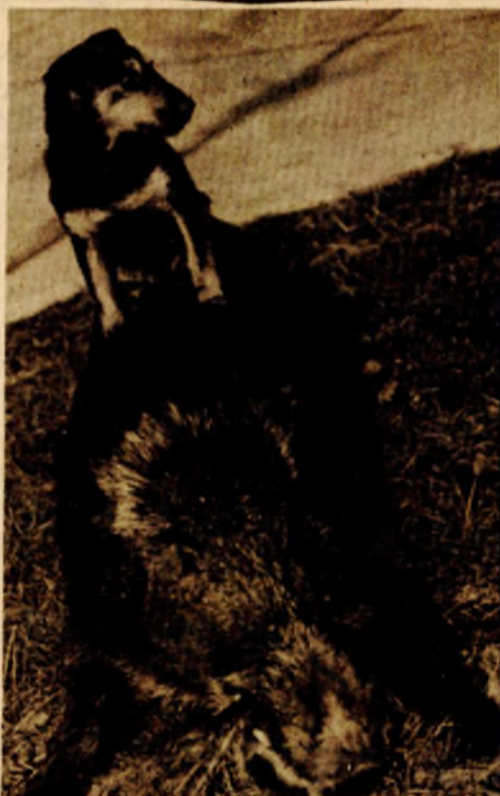
„POBJEDNIK I POBIJEĐENI“