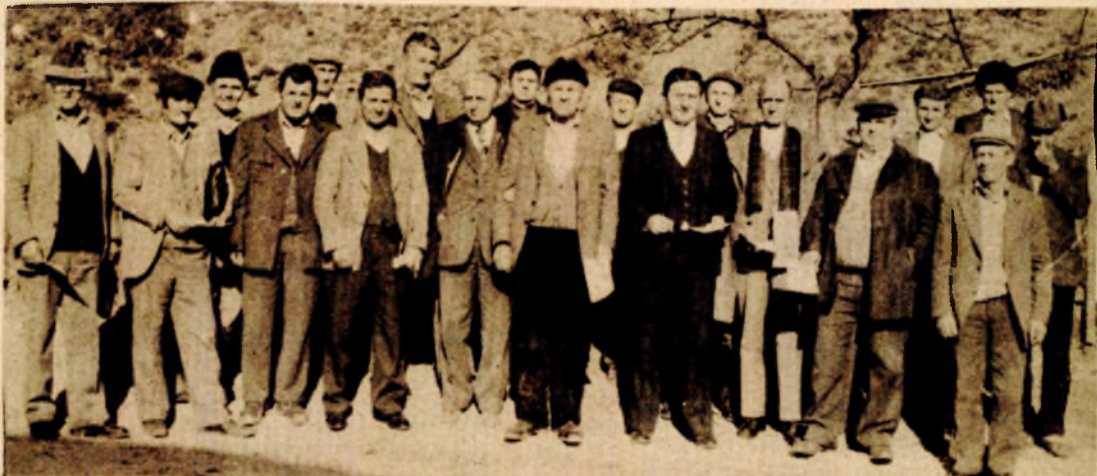
Masovno u Maslovarama: penzioneri

Osim toga, radiće se i na osvajanju proizvodnje ostalih okova za namještaj za koje je posebno zainteresovan „Metalov“ poslovni partner iz Kanade. M. M.