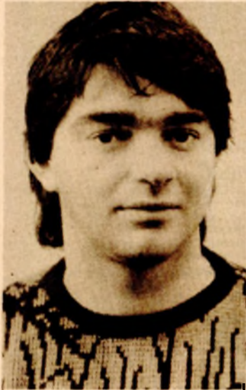
1 ZLATAN ARNAUTOVIĆ Rukometaš Borca iz Banjaluke

Tek u 1985. godini sportska sreća osmjehnula se i vrsnom čuvaru mreže Rukometnog kluba Borca iz Banjaluke. Naime, Arnautović je do sada čak četiri puta bio na listi najboljih, a drži rekord vicešampionske titule, koju je osvajao tri puta. As među asovima napokon je stigao i do najviše pozicije. Trenutno Arnautović spada među najbolje rukometne golmane u svijetu. U prošloj sezoni nadmašio je i takvog sportistu kao što je Mirko Bašić. Na Balkanijadi, gdje su „plavi“ osvojili zlato, Zlatan je proglašen za najboljeg golmana. Podsjetimo, Zlatan Arnautović je vlasnik zlatne olimpijske medalje, te više kolajni sa prvenstava Evrope, Mediteranskih igara i Balkanijada, s Borcem je osvajao Kupa Jugoslavije i prvenstva države. Njegove odbrane, pogotovo u 1985. godini, zadivile su gledaoce širom svijeta. Jednostavno, kad Zlatan stane na gol, mreža je začarana, a protivnik nemoguć. Takav je Zlatan Arnautović, kako kažu njegovi saigrači, golman sa hiljadu ruku.