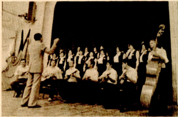
Hor žena MZ „Borik“