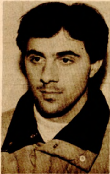
2 SAVO BLAGOJEVIĆ Dizač tegova Partizana iz Banjaluke

Tek u 1985. godini sportska sreća osmjehnula se i vrsnom čuvaru mreže Rukometnog kluba Borca iz Banjaluke. Naime, Arnautović je do sada čak četiri puta bio na listi najboljih, a drži rekord vicešampionske titule, koju je osvajao tri puta. As među asovima napokon je stigao i do najviše pozicije. Trenutno Arnautović spada među najbolje rukometne golmane u svijetu. U prošloj sezoni nadmašio je i takvog sportistu kao što je Mirko Bašić. Na Balkanijadi, gdje su „plavi“ osvojili zlato, Zlatan je proglašen za najboljeg golmana. Podsjetimo, Zlatan Arnautović je vlasnik zlatne olimpijske medalje, te više kolajni sa prvenstava Evrope, Mediteranskih igara i Balkanijada, s Borcem je osvajao Kupa Jugoslavije i prvenstva države. Njegove odbrane, pogotovo u 1985. godini, zadivile su gledaoce širom svijeta. Jednostavno, kad Zlatan stane na gol, mreža je začarana, a protivnik nemoguć. Takav je Zlatan Arnautović, kako kažu njegovi saigrači, golman sa hiljadu ruku.