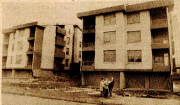
Useljavanje počelo juče

ZAVRŠENO 28 STANOVA U ULICI MIŠE STUPARA U BANJALUCI