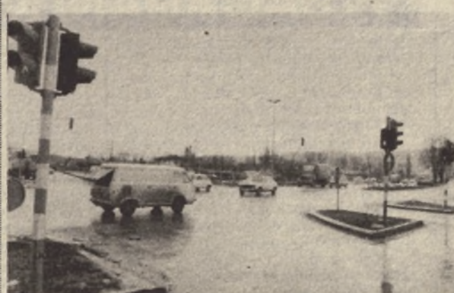
Semafori na Maliti i kod „Boske“ potrebni i na pravom mjestu

● Ukoliko se radni ljudi i građani izjasne da se sadašnja stopa doprinosa iz ličnih dohodaka od 0,8 odsto poveća na 1,2 ili 1,5 odsto za potrebe komunalne djelatnosti i zajedničke potrošnje značće to i više sredstava za banjalučke saobraćajnice i novih 14 kilometara asfalta