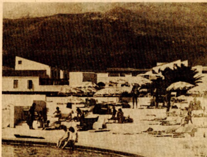
Najuspješnijoj turističkoj sezoni doprinijelo je i otvaranje kompleksa hotela na Slovenskoj plaži u Budvi

U razvoju automobilske industrije 31. juli 1985. ostaće zapisan krupnim slovima: tog dana iz barske luke upućena je prva pošiljka od 512 - jugo-amerika“ u SAD. Taj čin koji je označio početak velikog posla, predstavljao je kraj dvogodišnjih priprema o kojima se malo znalo. Jedna od najvećih jugoslovenskih spolnortgovinskih organizacija „Generaleksport“ sa velikim timom eksperata za više od 24 mjeseca