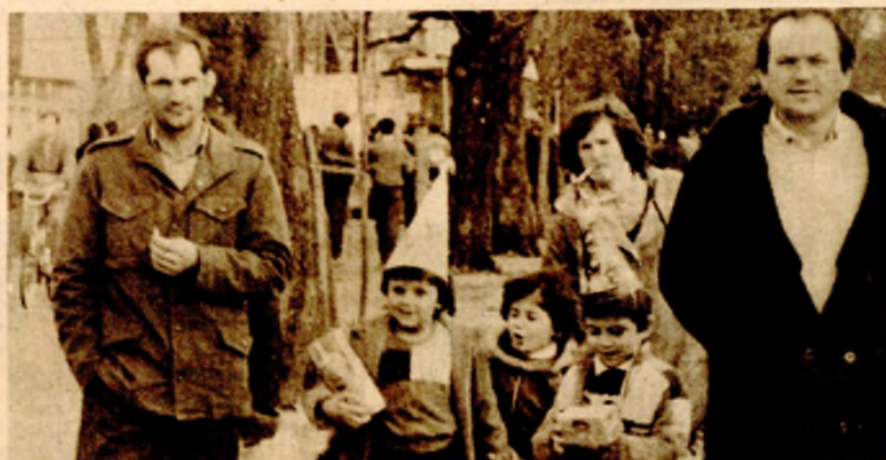
Radost zbog paketića, ali i jedinstvena pritička da se u ova kokuzna i užurbana vremena prošeta s roditeljima