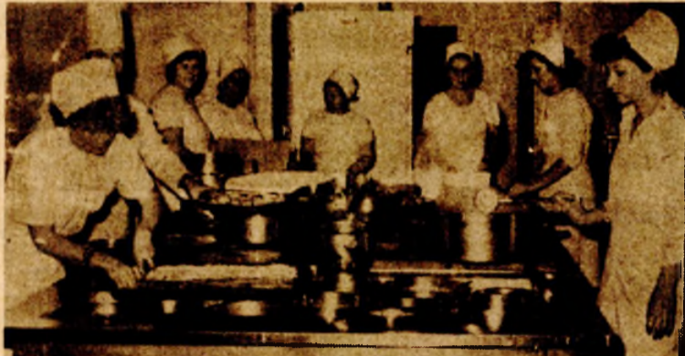
Kuhari pripremaju više nacionalnih specijaliteta

● Stogodišnjicu postojanja u hotelu „Bosna“ obilježili mnogobrojnim manifestacijama radno takmičarskog i kulturno-zabavnog karaktera ● Na početku drugog stoljeća dalje im je opredjeljenje za obogaćivanje ponude novim sadržajima jer jedino tako mogu pobuditi interes još većeg broja gostiju