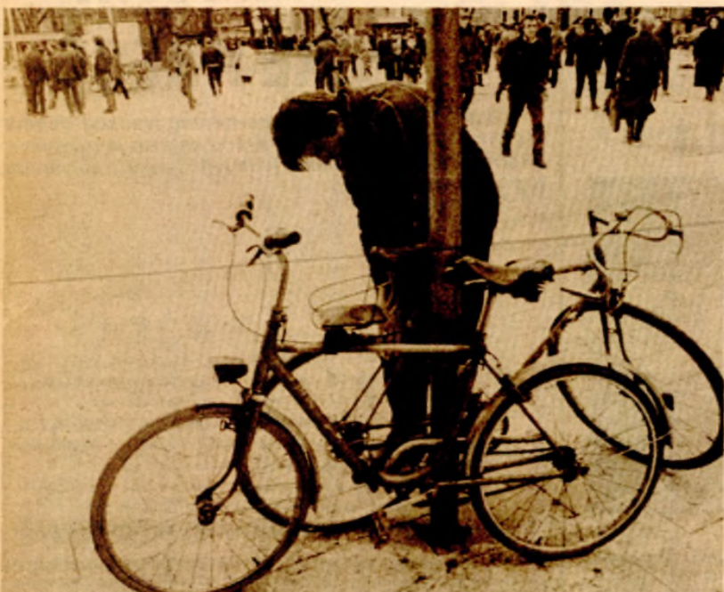
U novu godinu mnogi će na biciklu