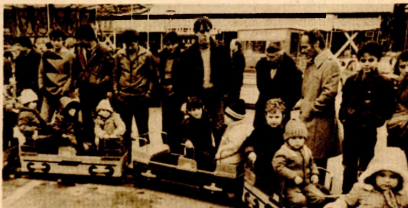
Ove godine na željeznici nema popusta ni za njih