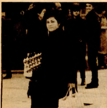
Sad tek treba prionuti na posao