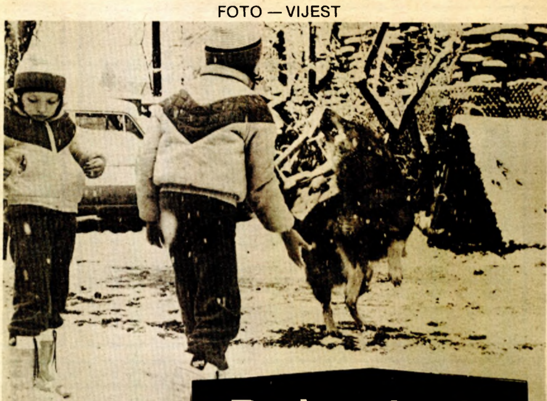
U Bihacu redovna akcija cijepljenja pasa protiv bjesnila

Da bi se boja ekonomično iskoristila, mama se prethodno propisno drogirala parom od istog spreja, poslije čega je vjerovatno dobila originalnu ideju.