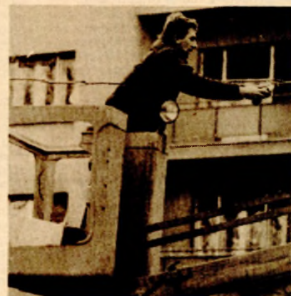
Posljednje pripreme - šarene sljalice daju poseban ugođaj