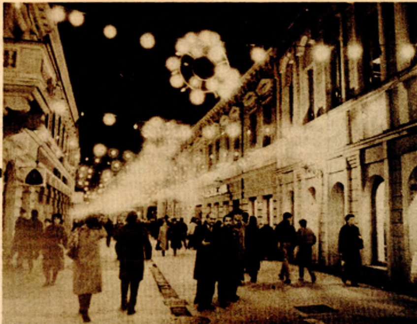
Banjaluka noću k'o usred Pariza

Ništa se posebno i naročito ne dešava na banjalučkim ulicama. Ipak, po užurbanosti, opštoj nervoznosti, nedostatku parking-prostora, redovima u trgovinama - jasno je Nova godina sigurno stiže. Biće, kažu, bolja od ove još trajuće. A u ovoj staroj, trgovci i proizvođači su zajednički naučili (a možda samo obnovili praktično teoretska znanja) da je trgovina ipak samo psihologija. Jer, kako inače drugkije objasniti, primjera radi, porast cijena bijele tehnike samo zato da bi ubrzo potrošačima mogao biti ponuđen popust. Preširoko je o tome sada govoriti ali veće potrošači i oni će ubuduće bolje proučavati „psihologiju“. Istina sada za to nema vremena. Valja običi sve prodavnice i kupiti štošta za proslavu dočeka Nove godine, valja kupiti poklone, pa i poneki šporetić, Iriziderčić.