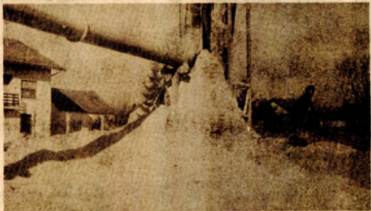
Otvorena deponija za piljevinu odmah pored stambenog naselja

- Najkasnije do prve polovine januara naredne godine mi ćemo ovaj problem riješiti i takovoše neće dolaziti do bilo kakvih sporova sa građanima koji stanuju u blizini pilane. D. ČOLIĆ