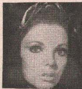
Џоан Колинс у филму „Ивица и Марица“