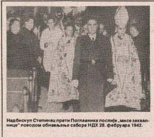
Надбискуп Степинац прети Поглавника послјије „мисе захвалнице“ поводом обнављања сабора НДХ 28. фебруара 1942.

... Препоручите вођама народа да буду кршћани, не