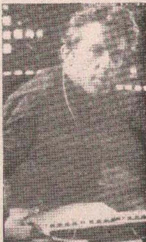
ПОНОВО У ПОНОМ ПРОГРАМУ: Гери Кол као Џек Клијан