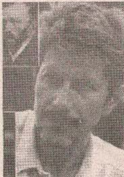
Жик ДИТРОН као ВАН ГОГ у истоименом филму М. ПИЈАЛА