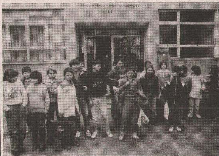
Ponovo u svojoj školi: Učenici pred osnovnom školom u Okučanima

OKUČANI, 20. februara - Nakon više od šest mjeseci u Okučanima je zazvonilo školsko zvono. U školskim klupama u Osnovnoj školi „Nada Dragosavljević“ trenutno je oko 400 učenika, koji pohađaju od 1. do 8. razreda.