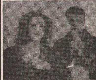
Јунаци серије „Хоботница“

Ти весели момци из прашњаве новосадске улице на прољеће улазе у студио да сниме нови албум са којим ће их онај стари или неки нови скепелија ко зна дје икако одвести. А ако је истина да љубав своје људе прати, чува и поштује, онда су пред њима нове радости, успјеси и још љепши дани.