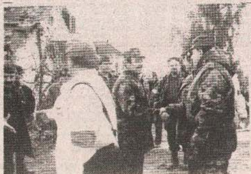
Na dijelu zapadnoslovenskog fronta kod Novske između predstavnika JNA i hrvatske vojske nastavljaju se razgovori