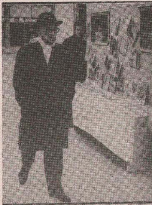
Samoću poslije suprugine smrti pisac je olakšavao odlazeći kod prijatelja, pojavljujući se u javnosti, na kulturnim manifestacijama

U „Njegovoj pesmi“, nastaloj 1921. godine, a neobjavljenoj za života, pisac skromno konstatuje da „nije živio bez ljubavi“. Ali, Andrić je i te kako znao za sve delikatnosti i umio je intimne događaje da dokraja drži u punoj diskreciji. On je uvijek isticao, kada bi ga pisci, kritičari, novinari, ljubitelji lične književnosti ili radoznalci upitali da objasni svoje preokupacije, motive i modele, jednostavno ponavljao: „Sve je u delu“.