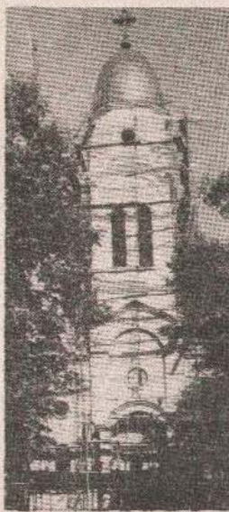
Нова црква у Босанској Крупи