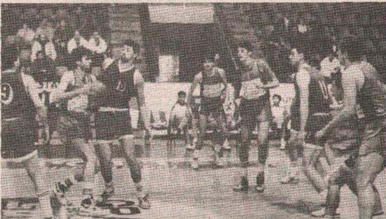
НАСТАВА А СЕ БОРБА: Кошаркаши Борац (свијетли дресови) фаворити су у сусрету са имењаким из Чачка

• У суботу од 17 сати Крајинауто МК домаћин Босни, а до 19 сати Борац дочекује имењака из Чачка • Очекује се игра и побједи које ће учинити пријатно суботње вече за све оне који се упуते у „Борик“