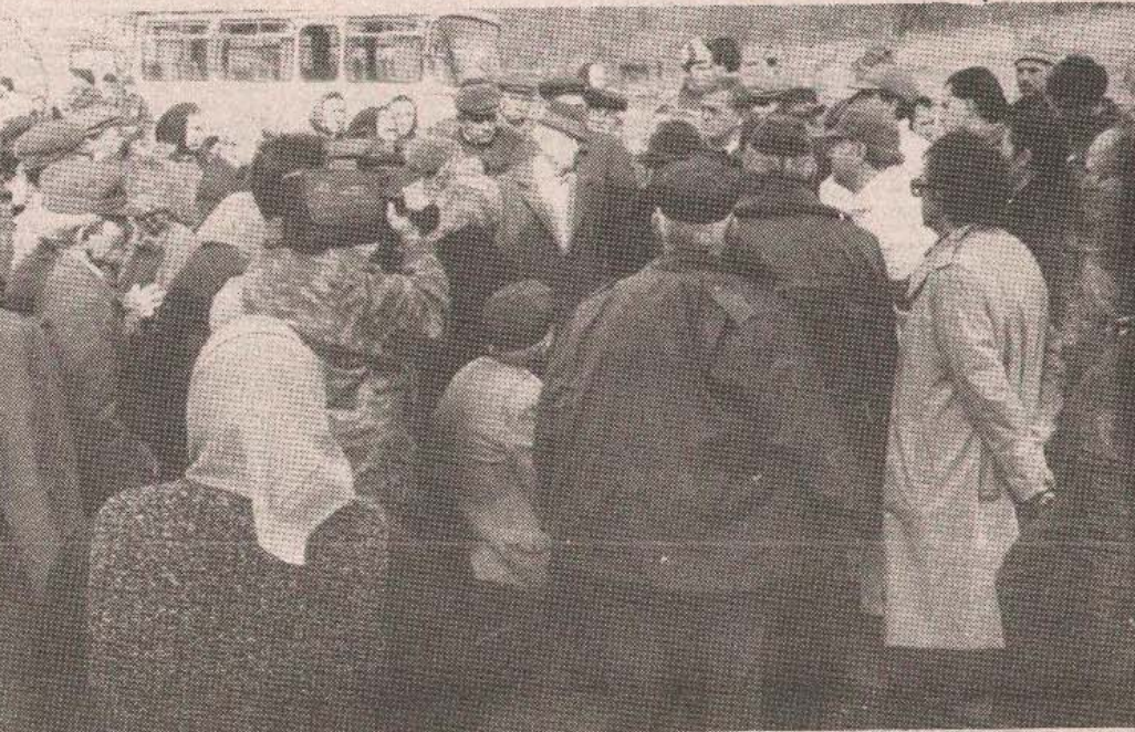
Представници Црвеног крижа Новске и посматрачке мисије ЕЗ приликом разговора са мјештанима