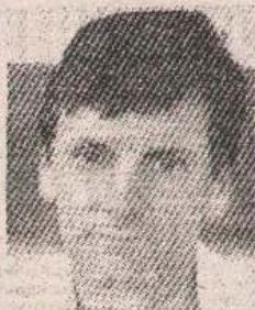
U POSLJEDNJI ČAS: Endi ROKSBURG, selektor Škotske