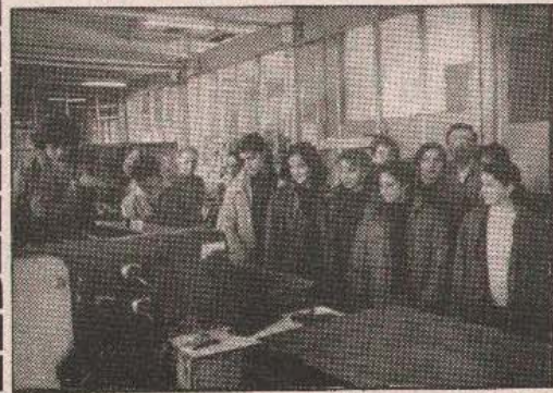
Чланови редакције „Лептира“, листа Основне школе „Браћа Павлић“ у посјети „Гласу“