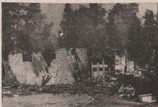
Зграда поште у Медарима — најжешће окршаје пребродила” с мањим оштећењима, а изгорјела до темеља од провокације

Питање је остало без адекватног одговора. Хрватска страна све до потписивања „сарајевског примирја” зна тачно да су из Прашника дјеловале њене диверзантске групе, чиме чак доказује своје „посједовање” Прашника, а након потписивања једноставно нема појма, ко је десетак пута одатле митраљирао цивилна и војна возила, подметнуо експлозив на ауто-пут (тада је погинуо