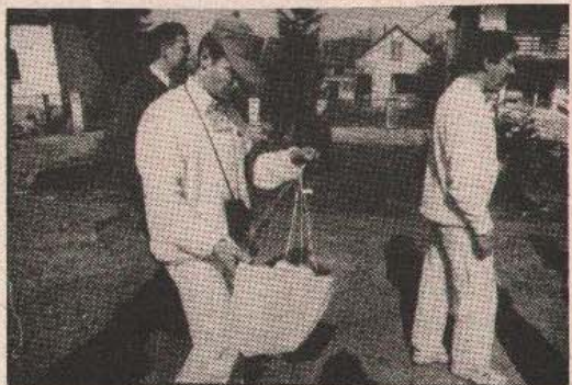
Један од доказа у рукама „мировљака” — падобран хрватске свијетлеће мине (запаљиве)

резервиста) и чији су то диверзанти имали окршаје с патролама Југословенске народне армије?!