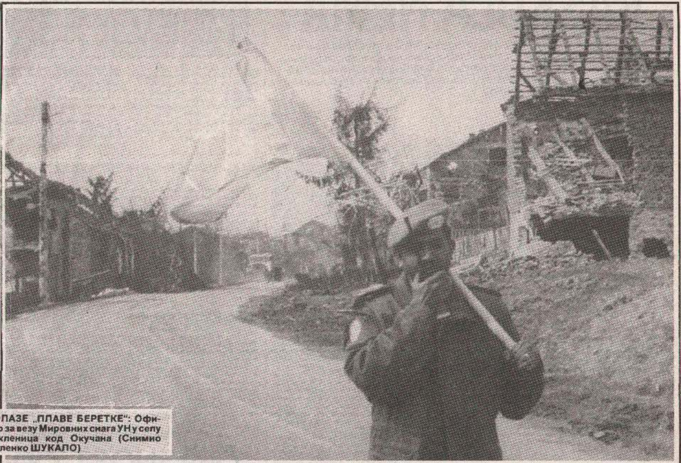
ДОПАЗЕ „ПЛАВЕ БЕРЕТКЕ“: Официр за везу Мировних снага УН у селу Пакленица код Окучана