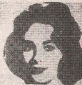
Jedan od portreta Endija Vorhola koji danas pripadaju slikarskoj klasici: ELIZABET TEJLOR.

nekoliko stranica posvetilo manekenkama odjevenim u danas već mitске modne predmete šezdesetih godina. Omiljena Vorholova crna „rolka“ osnovni je odjevni predmet tog vremena, nadopunjena crnim uskim hlačama, ili crnom suknjom od kože. Naki je metalan i upadljiv, a noćne vorholovski okrugle. Lice je označeno snažnom šminkom, a dominantnu svaku činilica na očima izvučena crnim tušem. Sve ovo je polazišna osnova i današnje mode.