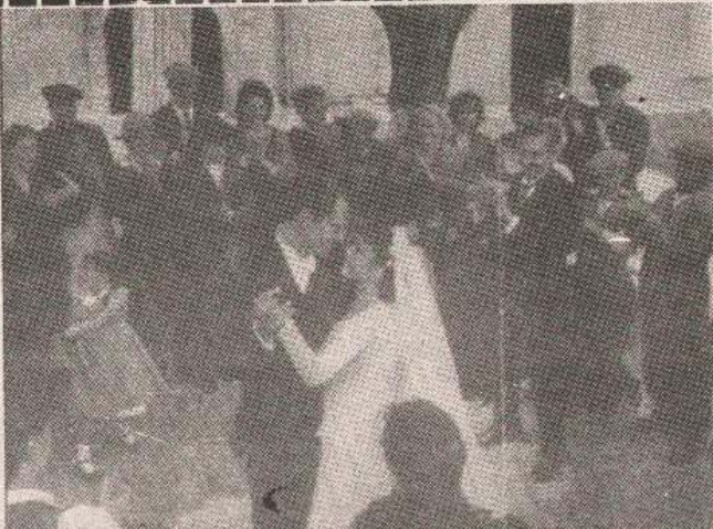
Nikada prevaziđeno — mlada u bijelom, mladoženja u svečanom odijelu. Na licima ljubavi i sreće.

Crkveno vjenčanje u pravoslavnoj crkvi zahtijeva od mladenaca strogo određenu toaletu priličnu ambijentu. Mlada je u bijelom, mladoženja u odijelu s cvijetom. Svatovi su okićeni, a mladi par tokom ceremonije nosi kru-