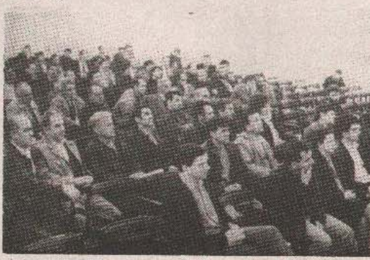
Jedinstveno rješenje srpskog pitanja - sa prve skupštine SDS Banje Luke

Govoreći kratko u uvodnom izlaganju o radu stranke u dosadašnjem, gotovo dvogodišnjem periodu, predsjednik Opštinskog odbora