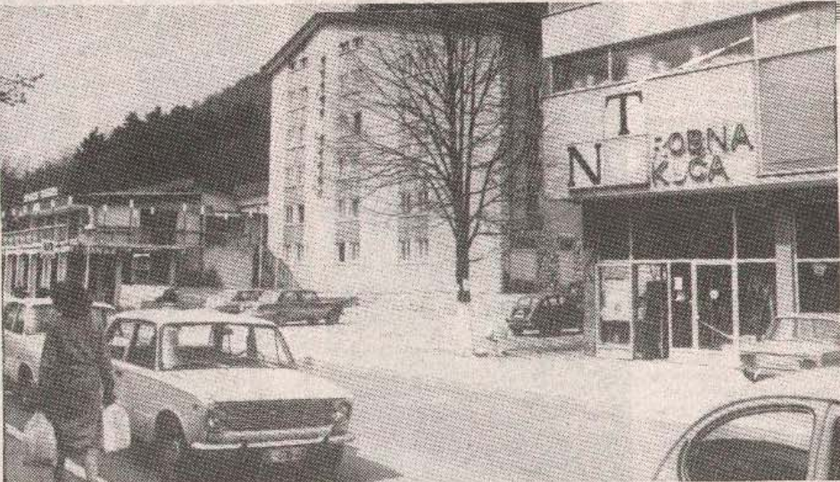
Da li će mir potrajati - Kotor-Varoš