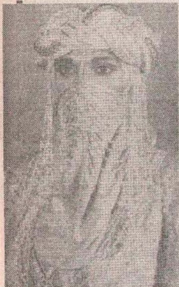
Islamska mlada bogato opremljena

Običaji crkvenih vjenčanja događaji su koji se pamte. Događaji puni romantike i sjećanja na prošlost. Ruka na ruci, mirisi tamjana, svijeća, kruna, vjenčidi, dukati i velovi — sve to izgleda mnogo ljepše i tajanstvenije pred svetim „matičarem“. Zbog toga vraćanje ovoj tradiciji, čak i kad je podstaknuta pomodarstvom treba i u najmanju ruku - razumjeti.