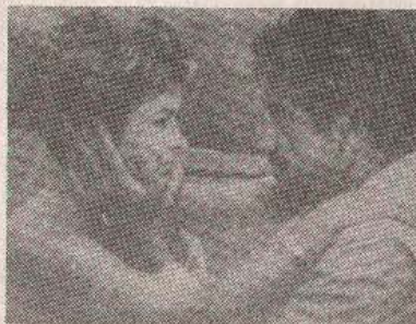
BRIŽNI OTAC: iz filma „Obala Kona“

Radnja ovog filma odigrava se na Havajima. Kapetan ribarskog broda pronalazi svoju kćerku mrtvu nakon jedne kućne zabave. Razlog je prevelika upotreba droge koja joj je podmetnuta. Policija pokreće istragu, ali njen otac preuzima stvari u svoje ruke. Lamot Džonson je jedan od heroja B filmova sedamdesetih godina. Međutim, Džonson je u svoju poziciju „razvodno“ čestom saradnjom s televizijom. Film „Obala Kona“ u velikoj mjeri nagovještava uspehe koje Džonson kasnije dosegao.