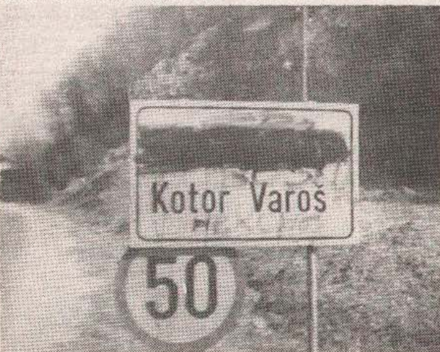
Na nekim područjima kotor-varoške opštine ćirilica nije poželjna

Razloga za zadržavanje više nije bilo. Kotor-Varoš je preživio još jedan svoj težak, pun neizvjesnosti istraha, dan. U Banjoj Luci saznajemo da su barikade u Vrbanjicima uklonjene i da je zavladao potpuni mir. Bilo i nepovratilo se.