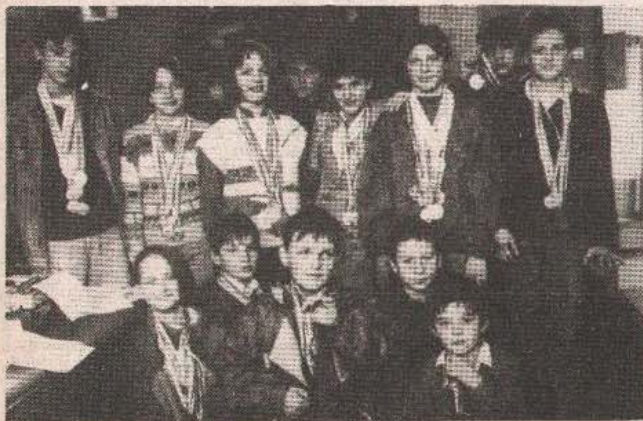
Sadašnjost i budućnost banjolučkog plivanja

● Sjajni rezultati s jedne i loše finansijsko stanje kluba s druge strane su faktori koji će uticati na perspektivu plivanja u Banjoj Luci ● Klub ima veliki potencijal ● Potraga za dugotrajnim rješenjem.