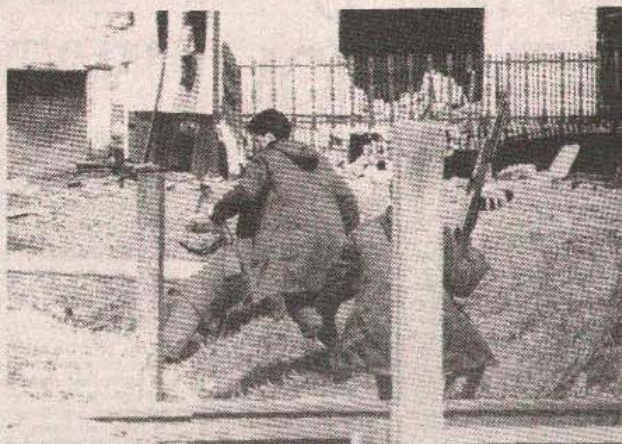
Brisani prostor najčešće na hrvatskoj strani nije „priznao“ dogovorom o primirju.

Ne skidajući praktično pogled s horizonta na hrvatskoj strani, borci Jugoslovenske narodne armije u tak-