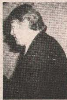
50. put na kormilu „plavih“: Ivica Osim

I Ivica Osim, kao i njegovi igrači, pominje nesretnu bijelu tačku: — Da nije bilo penala, imali bismo bod više od Zvezde! Dobro smo parirali „crveno-bijelima“, nismo bili inferorni. Ambijent je bio predivan, sigurno se sličan neće ponoviti za par godina. S. PETROVIĆ