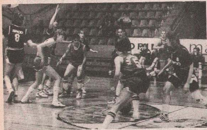
Utakmica sa Partizanom u Beogradu će presuditi (detalji) sasusreta Krajinauto MK — Partizan, jesenas u Banjoj Luci

BANJA LUKA — Još dvije pobjede u posljednja dva kola ovogodišnjeg šampionata Jugoslavije, dijele košarkašice Krajinauto MK od petog mjesta na prvenstvenoj tabeli, koja vodi u Evropu. „Malene“ u pretposljednem kolu, sljedeće subote, dočekuju u svom