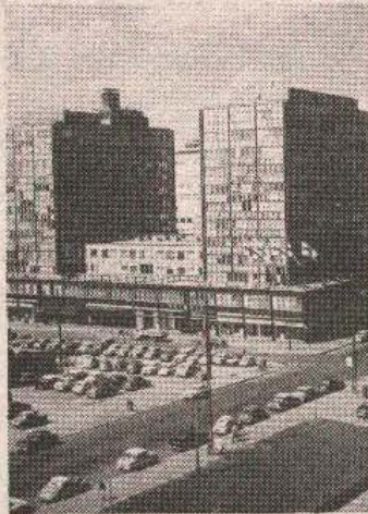
Komitet visokih funkcionera u Helsinkiju treba da odluči o prijemu jugoslovenskih republika u KEBS

Ni jugoslovenska delegacija saznaje Tanjug, ne namjerava da blokira odluku komiteta, ali se može očekivati da će zatražiti garancije da eventualni prijem Hrvatske i Slovenije u punopravno članstvo KEBS-a neće uticati na ishod briselske konferencije o Jugoslaviji niti na poziciju Jugoslavije kao države.