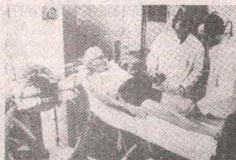
Трауматолошка клиника у Сарајеву — штрајк здравствених радника без временског ограничења

САРАЈЕВО, 23. марта — Према обавјештењу штрајкачког одбора угледне трауматолошке клинике у Сарајеву, данас су запослени ове болнице ступили у штрајк без временског ограничења.