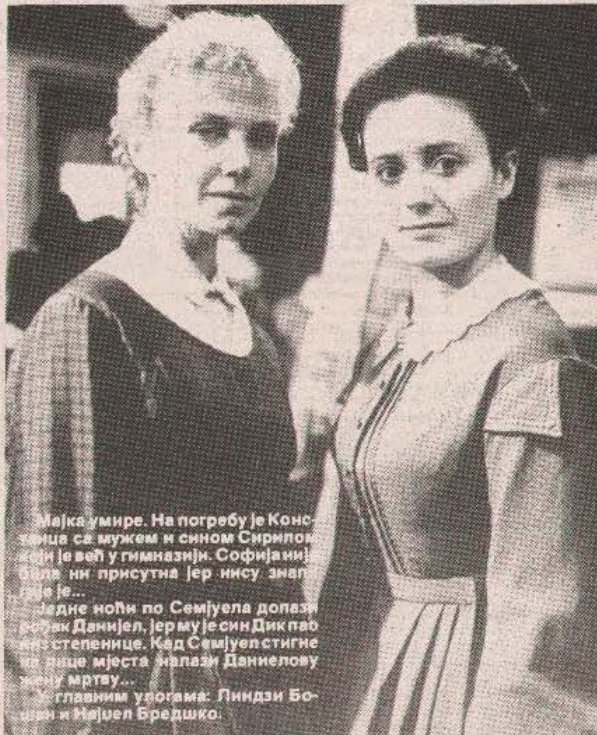
из серије „Софија и Констанца“