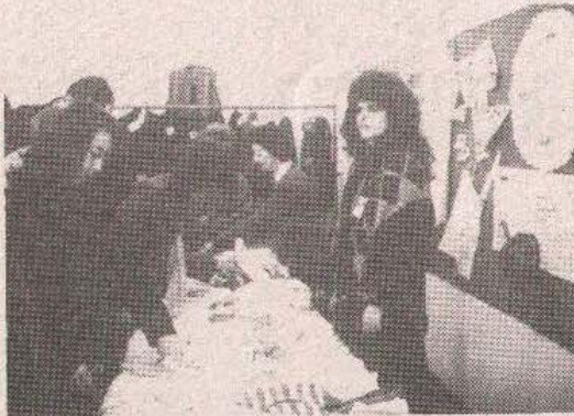
У Дому културе очекују купце, да би помогли изbjеглицима

Циљ је, прије осталог, био да одјевне предмете, гдје има и квалитетних бунди, добијемо од донатора из иностранства, који су хуманитарним акцијама стигли у Добротворно друштво и чија је изричита жеља била да се средства добијена продајом тих бунди и осталих предмета користе за набавку основних животних намирница и средстава за хигијену несретнима и невољницама, са-