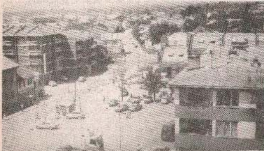
Prnjavor: budžetska opterećenja sve veća

PRNJAVOR, 30. marta - Na posljednjoj sjednici Izvršnog odbora SO najviše dio vremena posvećen je razmatranju prijedloga budžeta opštine za ovu godinu. Prema prijedlogu, budžet za 1992. će biti za 355 odsto veći nego za prošlu godinu i dostiže vrijednost od 196 miliona dinara. Naravno, o ovom dokumentu konačnu riječ će dati odbornici opštinskog parlamenta na narednoj sjednici.