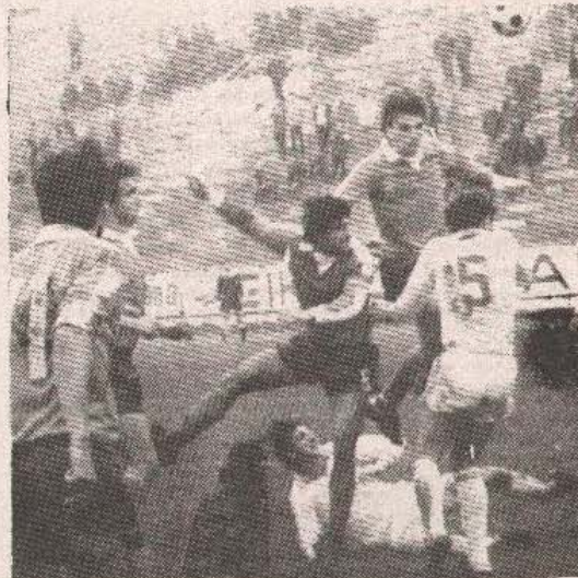
Da li će igrati u bosanskohercegovačkoj ili jugoslovenskoj ligi

Zasad je ovo samo prijedlog. Du njegove realizacije, ipak dug je put. Pogotovo kada se