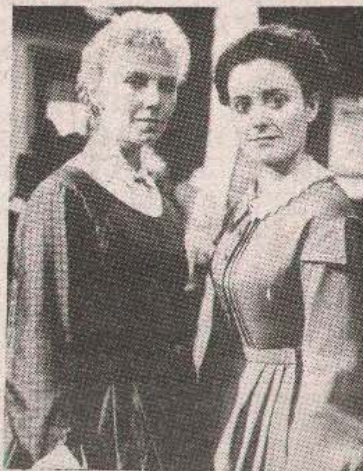
Iz serije „Sofija i Konstanca“