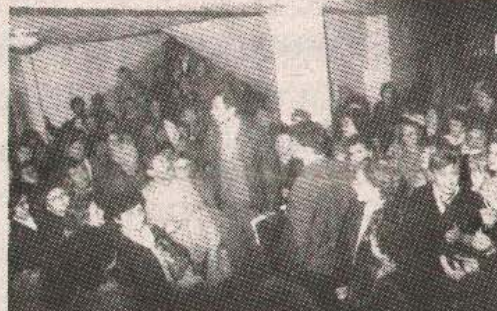
Sa protesta radnika KOMEL-a u holovima bivšeg „Čajavecovog“ Smačkog hotela