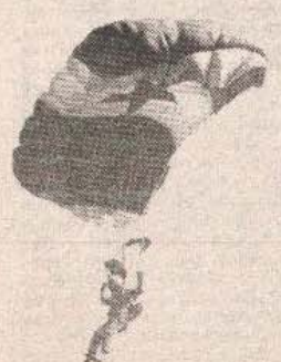
Виктор Куљеник: 5.661. скок

ЖЕЉЕЗНИЧАР: Шкрба 6, Јурић 5, (Павловић 3), Милошевић 6, Крунић 6, Алексовић 6, Крстановић 6, Босановић 5, Марковић 5 (Гулећ 6).