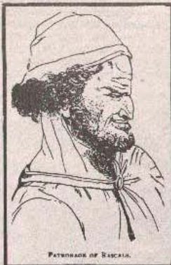
PINJAROVA OF BASKIA

Među mnoštvom naslova ugledne pariske edicije „Que sais-je?“ (Šta znam?), koju izdaje Presses Universitaires de France, 1975. godine, pod brojem 309, u kolekciji Tačka aktuelnih znanja, pojavila se neobična knjiga Histoire de la mise en scene theatrale — Istorija pozorišne režije — Roberta Pinjara (Robert Pignarre). U prevodu Radmile Nedeljković i našem izboru, malo po-