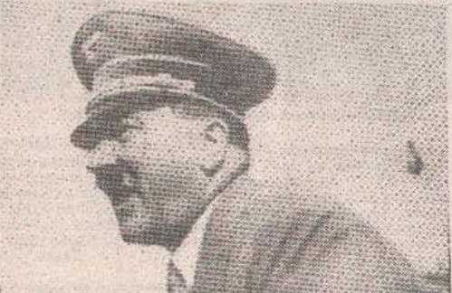
Албанија се уједињила да служи под различитим окриљем: И Хитлер је „резали“ њене земље.