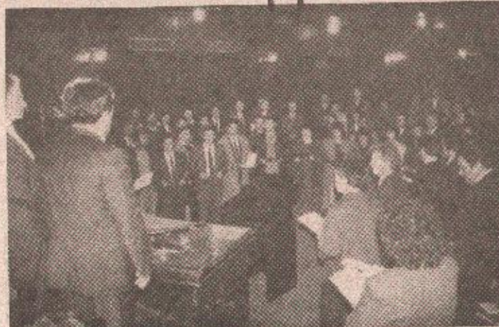
Свечана промоција судија и тужилаца у присуству високог госта - мр Момчила Крајишника, председника Народне скупштине Републике Српске