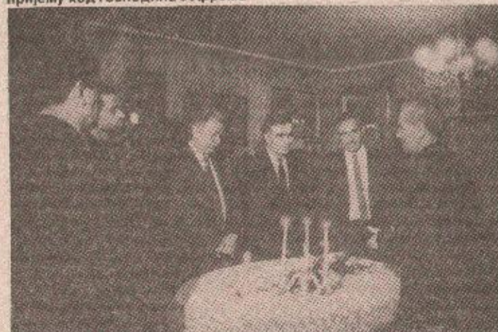
Председник Крајишник у сусрету са бискупом Фрањом Комарићем