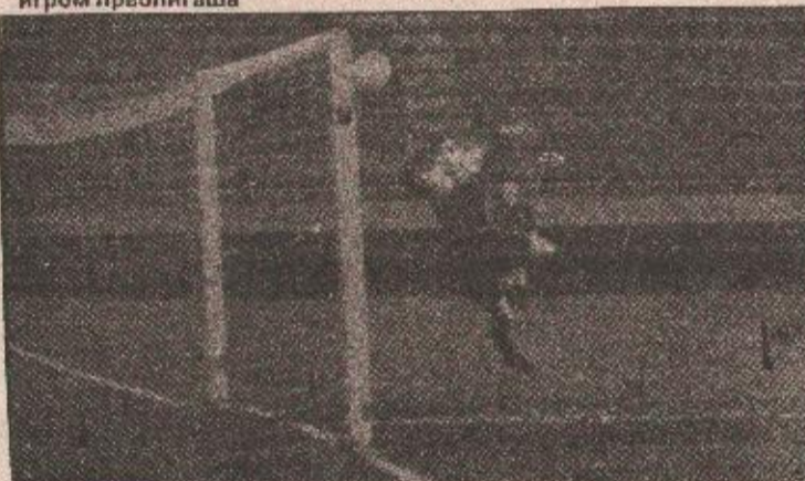
ПОГОДАК: ово је тренутак када вођа навапе Борца Зрилић постиже ефектан погодак и вођство Борца повећава на 2:0