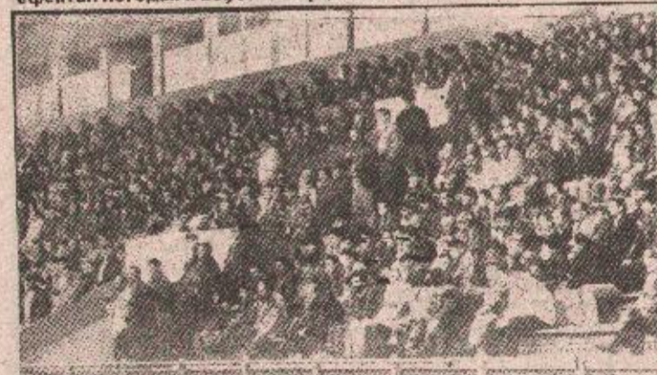
ГЛЕДАОЦИ: и поред лошег, кишовитог времена утакмицу је пратио велики број поштованих фудбалера