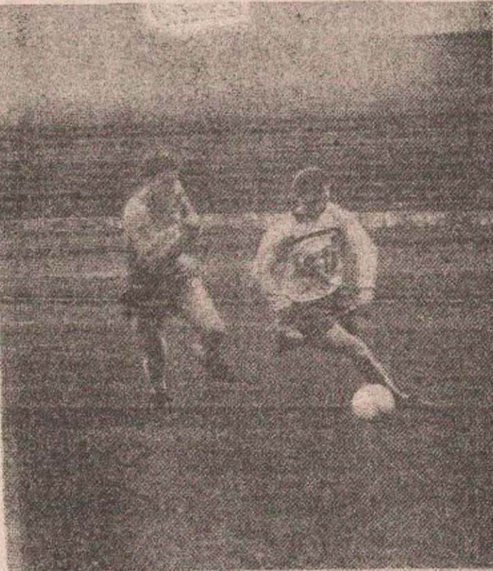
ДУЕП: оваквих окршаја на утакмици било је безброј

Ипак, најважније од свега је да се фудбал вратио ту, међу нас, да ћемо овај рат, уз њега, пакше пребродити.