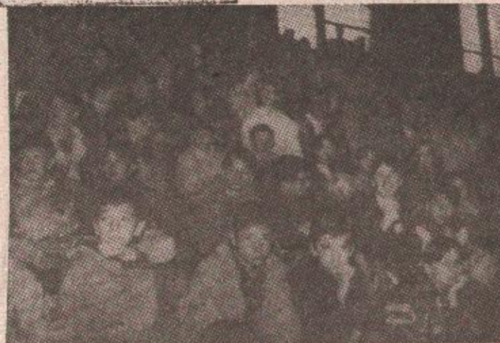
ВРИЈЕМЕ РАДИ ЗА ЊИХ: Један дио ползаника школе