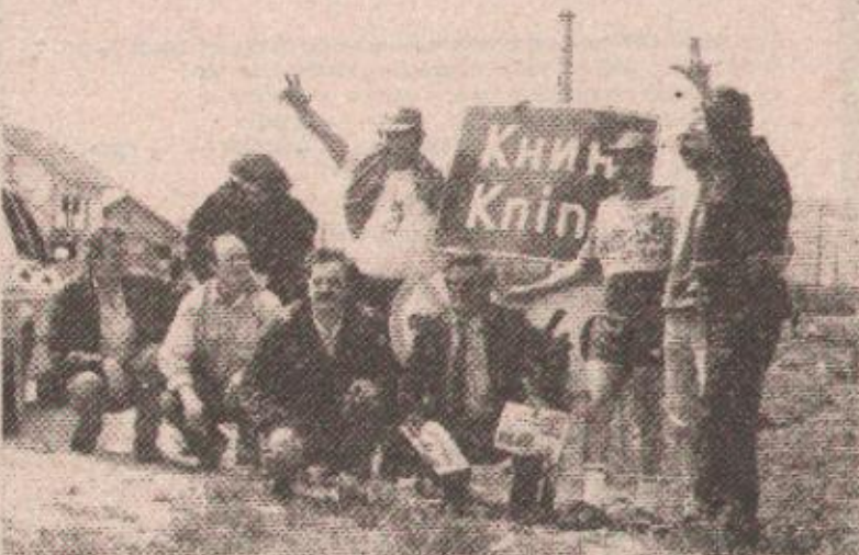
ДОЧЕК: Упорни марафонац отпоздравља Книњанима