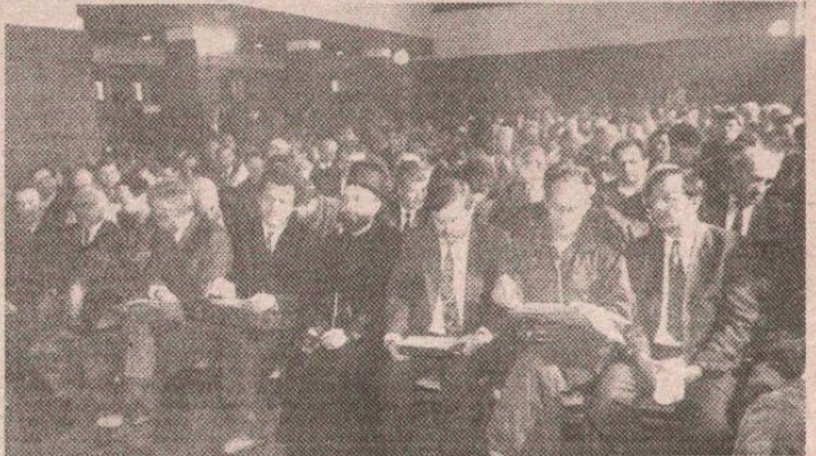
Са сједњања Скупштине РСК у Окучанима

парафа делегације РСК на Резолуцију УН 802 има тек привремен карактер и није обавезујућа за крајинску страну, све док га парламент ове републике не верификује. Да укратко подсетимо читаоце да ова резолуција Уједињених нација првенствено повлачење хрватске војске са привремено заједничких територија Републике Српске Крајине у року од десет дана, те стављање тешког наоружања српске војске под контролу мировних снага. Међутим, споран је и неприхватљив други дио ове резолуције, заправо анекс, у коме се поништавају полиција и законодавство Републике Српске Крајине