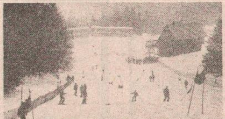
ОЖИВЈЕЛЕ СТАЗЕ НА ЈАХОРИНИ