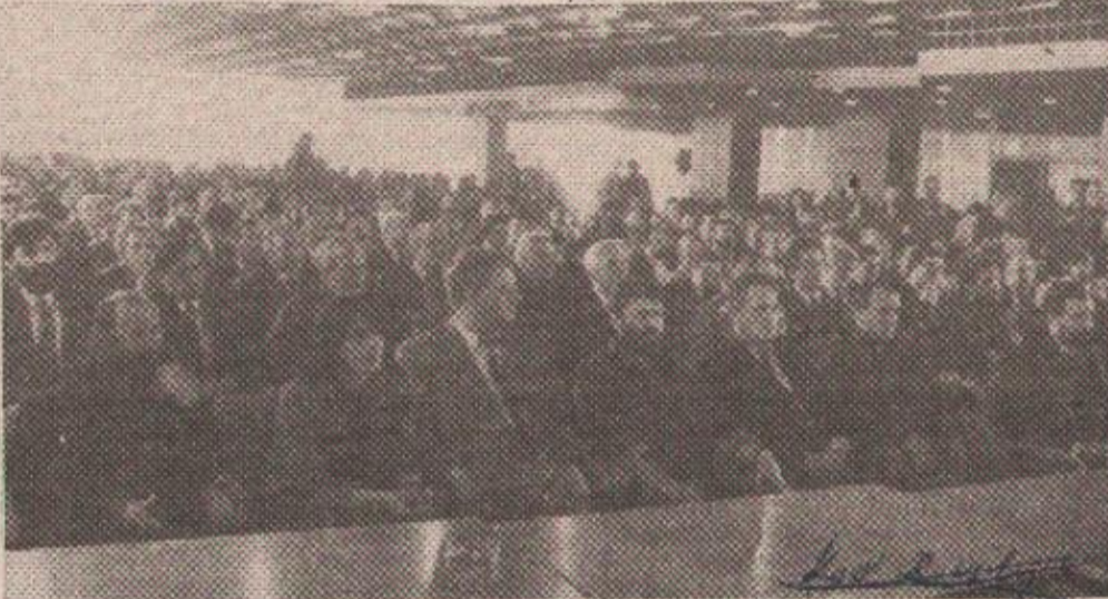
Детаљ са засједања двију скупштина

питањима спољне и унутрашње политике двију република. На данашњој Скупштини је, на приједлог председника Републике Српске Крајине Горана Хаџића, усвојена једна значајна одлука — да се, уколико