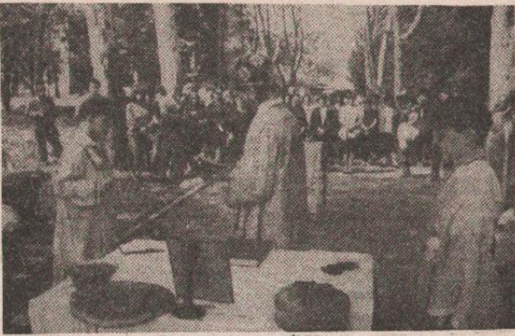
Детаљ са свете литургије