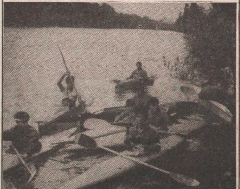
Када ћемо бљопучке кајакаше поново видјети „у води“?