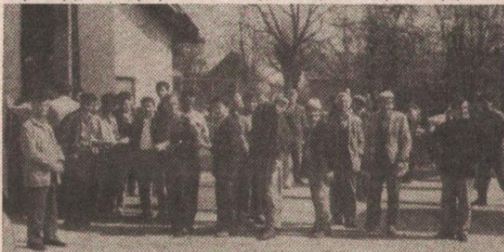
Са расподјеле репроматеријала у Лакташима